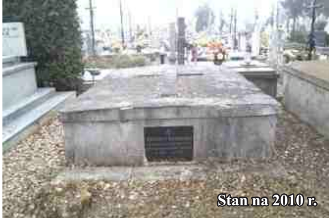
Stan na 2010 r.

Kolejna kwesta odbyła się w listopadzie ubiegłego roku oraz podczas koncertu „Paryżu Kocham Cię”. Brakujące środki w kwocie 3,5 tys. zł. przekazała Rada Rodziców Zespołu Szkół Publicznych w Jedliczu.