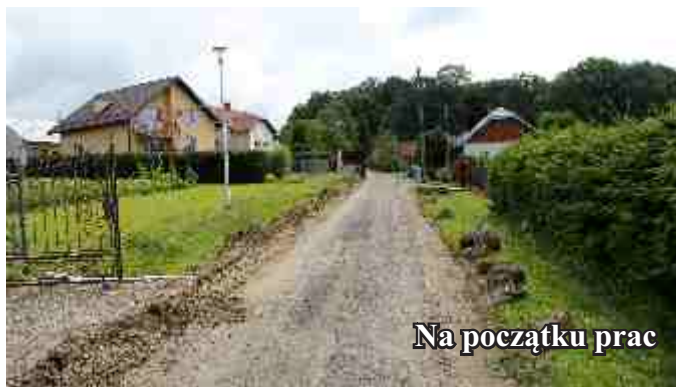
Na początku prac

Zakończono przebudowę ciągu ulic realizowaną w ramach Narodowego Programu Przebudowy Dróg Lokalnych, etap II, Bezpieczeństwo - Dostępność - Rozwój. Był to drugi etap remontu ciągu komunikacyjnego (pierwszy o długości 5 km, obejmował remont od drogi krajowej przez Bratkówkę, Moderówkę, Męcinkę do ul. Brzozowej w Jedliczu - realizowany był w 2009 r.) Tym razem zmodernizowano ul. Betleja, Grabiny i Podlas w Jedliczu. Całkowita wartość projektu to 786 294,78 zł, z czego 235 888,00 zł to środki finansowe pozyskane z Budżetu Państwa. Na przyszły rok przygotowano już dokumentację na remont kolejnego odcinka w ramach wyżej wymienionego programu.