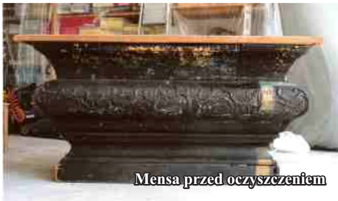
Mensa przed oczyszczeniem

Trwają prace konserwatorskie Kaplicy Cmentarnej pw. Jezusa Ukrzyżowanego w Jedliczu. Konserwatorzy oczyścili mensę ołtarzową z XVIII w. Ściągając z niej warstwę czarnej farby odkryli ciemnozielony kolor, przeplatany posrebrzonymi elementami ozdobnymi. W takiej sytuacji podjęta została decyzja o przywróceniu mense ołtarzowej jej pierwotnego wyglądu.