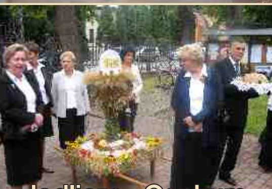
Jedlicze - Centrum