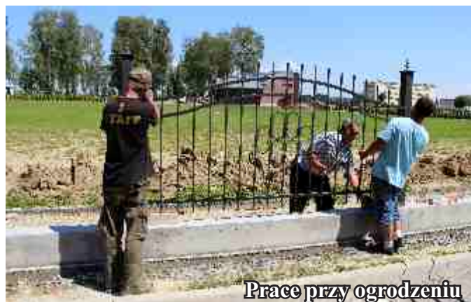
Prace przy ogrodzeniu

Kontynuowane są prace związane z budową ogrodzenia cmentarza komunalnego w Jedliczu, aktualnie prowadzone są prace przy montażu pręseł.