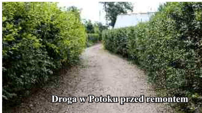
Droga w Potoku przed remontem