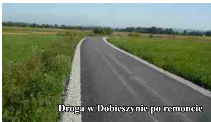
Droga w Dobieszynie po remoncie