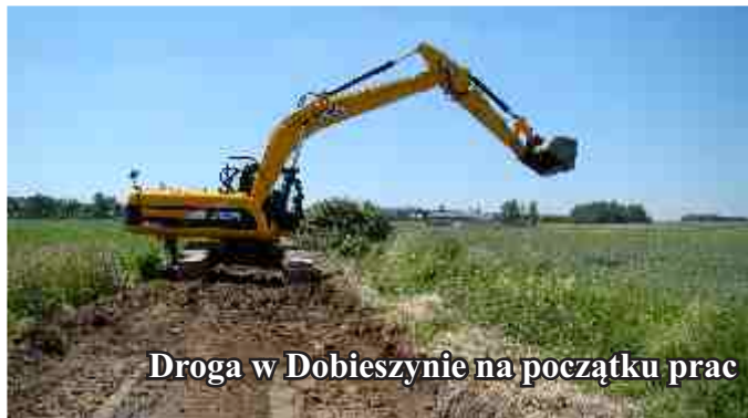
Droga w Dobieszynie na początku prac

Kolejne drogi oddane do użytku, tym razem w miejscowości Potok i Dobieszynie. W ramach prac na obu odcinkach wykonano nową podbudowę i położono nawierzchnię mineralno-bitumiczną. Koszt remontu w Potoku wyniósł ponad 77 tys. zł, zaś w Dobieszynie ponad 240 tys. zł. Łącznie wyremontowano 950 m dróg. Całość kosztów pokryta zostanie z dotacji otrzymanej z Ministerstwa Spraw Wewnętrznych na usuwanie skutków klęsk żywiołowych powstałych w wyniku powodzi w 2010 r.