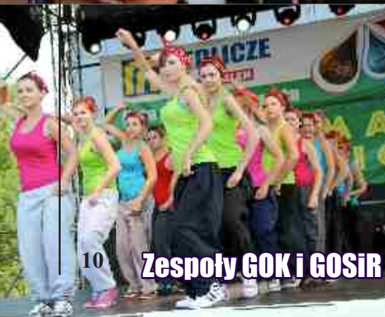
Zespoły GOK i GOSiR