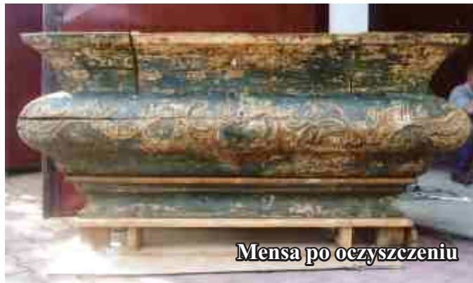
Mensa po oczyszczeniu