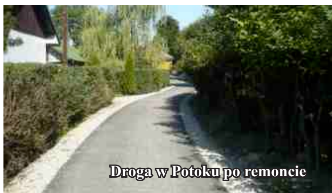
Droga w Potoku po remoncie