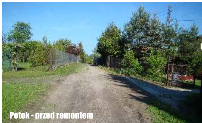
Potok - przed remontem

Zakończono prace remontowe drogi bocznej przy ul. Armii Krajowej w Jedliczu oraz w miejscowości Potok (obok przedszkola). Koszt prac w Jedliczu wyniósł ponad 130 tys. zł, w Potoku ponad 80 tys. zł.