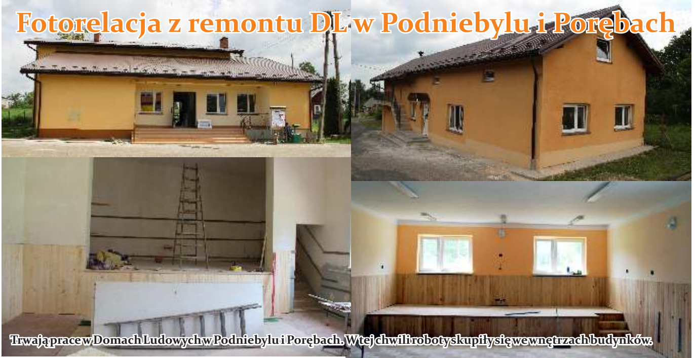
Trwają prace w Domach Ludowych w Podniebylu i Porębach. W tej chwili roboty skupiły się wewnątrz budynków.