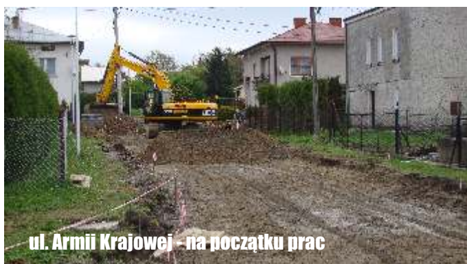
ul. Armii Krajowej - na początku prac