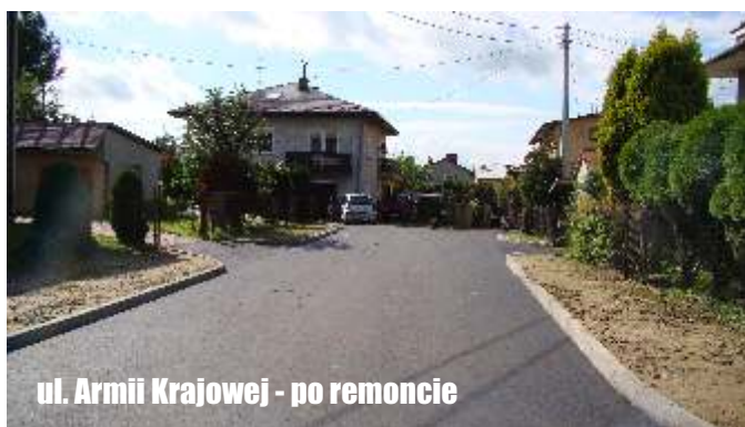
ul. Armii Krajowej - po remoncie