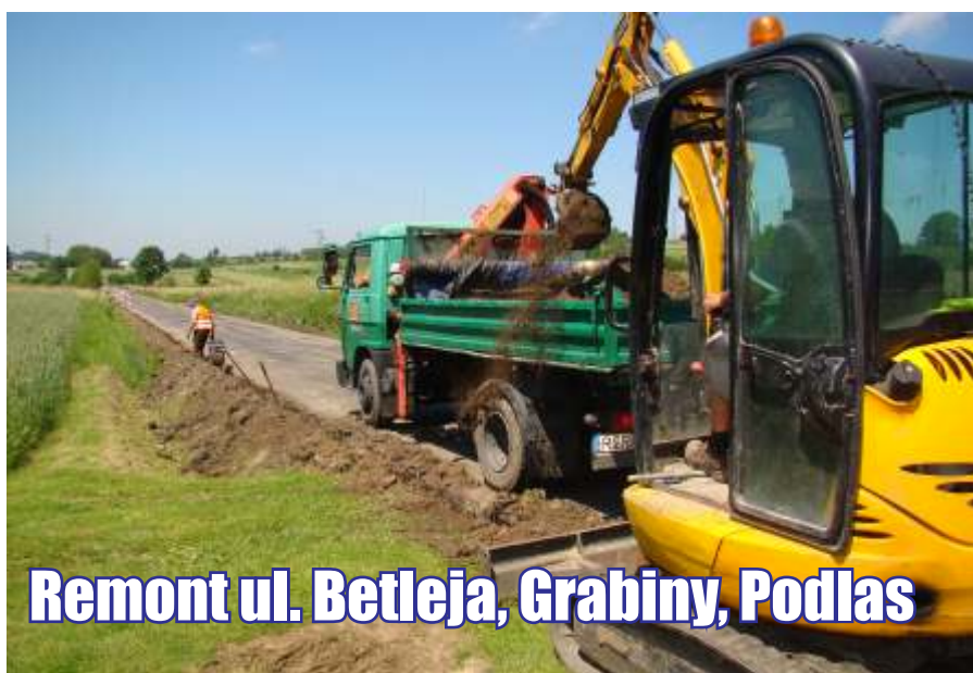
Remont ul. Betleja, Grabiny, Podlas

Rozpoczęto remont ciągu dróg od Męcinki tj. ul. Betleja, ul. Grabiny, ul. Podlas. Prace remontowe polegać będą na oczyszczeniu nawierzchni asfaltowej, wykonaniu warstwy profilowej, wykonanie koryt pod poszerzenie drogi. Roboty ziemne obejmują wykonanie przepustów, ściek czołowych i czyszczenie rowów. Ostatni etap prac remontowych polegał będzie na oznakowaniu poziomym i pionowym świeżo wyremontowanych ulic. Na ten cel pozyskane zostały środki zewnętrzne. Całkowita wartość projektu to 786 294,78 zł, z czego 235 888,00 zł pochodzi z dofinansowania z Budżetu Państwa.