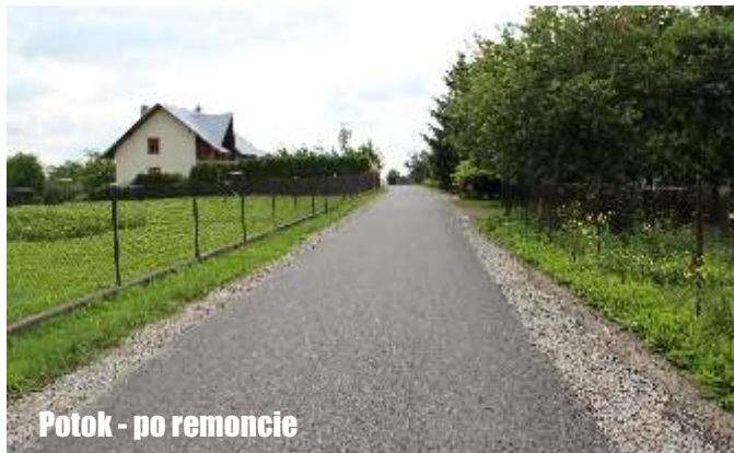
Potok - po remoncie