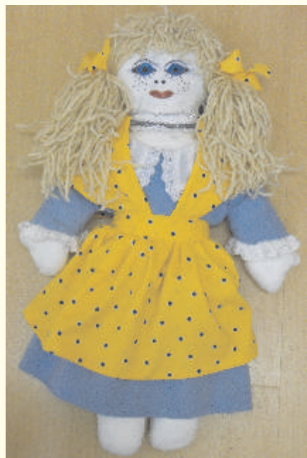
Sofie z Bawarii

Kilkanaście szmacianych lalek, każda z innego regionu świata, w charakterystycznych dla każdego kraju strojach, stworzonych po to by pomóc potrzebują-