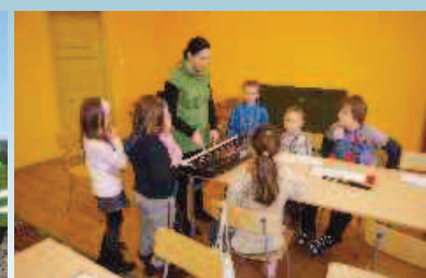
Dodatkowe zajęcia pozalekcyjne