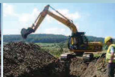
Rozliczenie kanalizacji w Żarnowcu