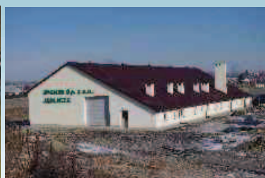
Remont sortowni w Żarnowcu