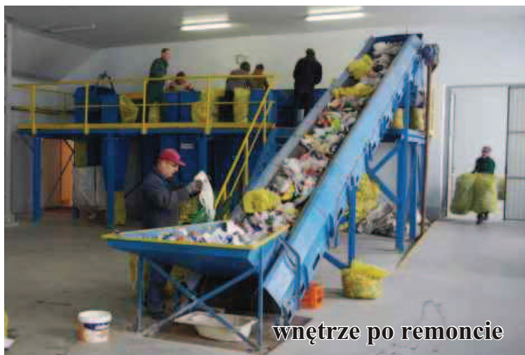
wnętrze po remoncie

manewrowe. Zagospodarowane będą działki oraz zamontowany zostanie monitoring budynku i terenu, gdzie ustawione są kontenery z odpadami.