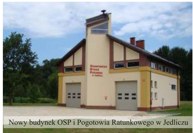
Nowy budynek OSP i Pogotowia Ratunkowego w Jedliczu

Znaczną jej część bo 961 tys. zł to wydatki poniesione na budowę remizy w Jedliczu. Kupiono też niezbędny sprzęt taki jak: agregaty prądotwórcze, piły, pompy szlamowe, węże tłoczne i ubrania. W budynku tym mieści się również siedziba Podstacji Pogotowia Ratunkowego, której istnienie znacznie skraca czas dojazdu Zespołu Ratunkowego do pacjenta. Oprócz budowy nowego budynku w Jedliczu wyremontowana została kompleksowo Remiza OSP w Dobieszynie.