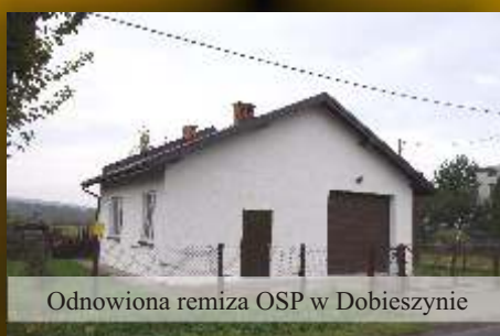
Odnowiona remiza OSP w Dobieszynie