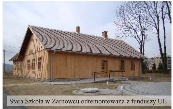
Stara Szkoła w Żarnowcu odremontowana z funduszy UE