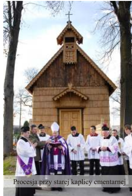
Procesja przy starej kaplicy cmentarnej

Aby zachować pamięć o osobach zasłużonych, które swoją pracą i zaangażowaniem przyczyniły się do rozwoju gminy, Gminna Biblioteka Publiczna im. Kaspra Wojnara w Jedliczu wydała publikację dotyczącą Jedlickiego cmentarza pt.: "Cmentarz Jedlicki - mały przewodnik biograficzno - historyczny".