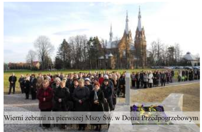
Wierni zebrani na pierwszej Mszy Św. w Domu Przedpogrzebowym