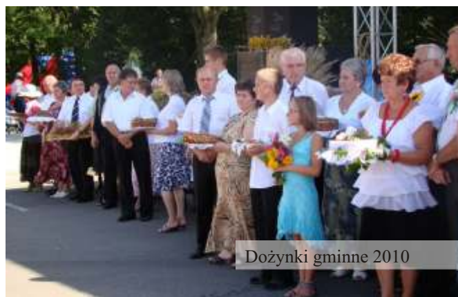
Dożynki gminne 2010

Wszystkie imprezy promujące tradycje organizowane były wspólnie z kołami gospodyń wiejskich. Aktualnie działa 14 KGW, we wszystkich miejscowościach gminy oraz dzielnicach Jedlicza.