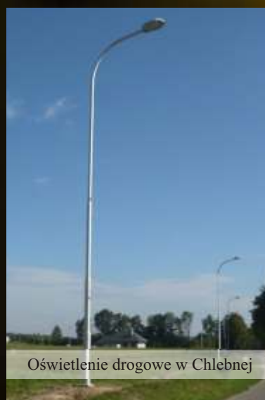
Oświetlenie drogowe w Chlebnej

REDAKCJA ZASTRZEGA SOBIE PRAWO DO DOBORU SKRACANIA PUBLIKOWANYCH INFORMACJI. MATERIAŁÓW NIE ZAMÓWIONYCH NIE ZWRACAMY