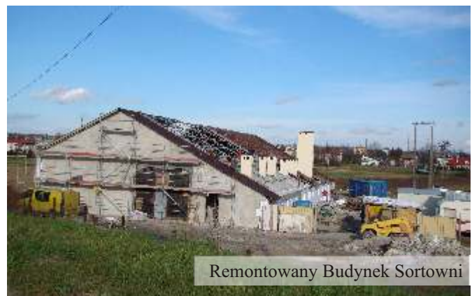
Remontowany Budynek Sortowni

Ponadto spółka pozyskała środki z Unii Europejskiej