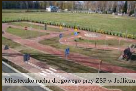
Miasteczko ruchu drogowego przy ZSP w Jedliczu