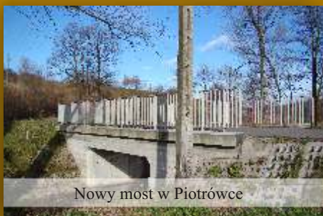
Nowy most w Piotrówe