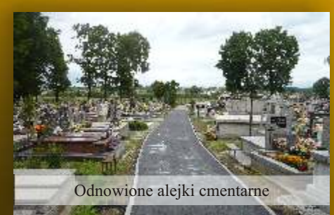
Odnowione alejki cmentarne