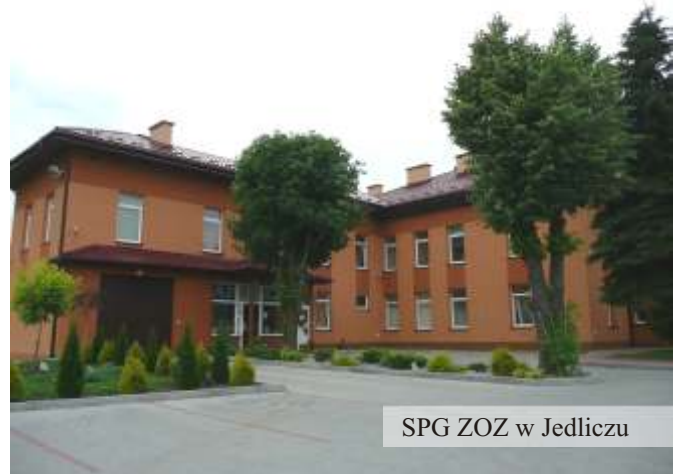
SPG ZOZ w Jedliczu

Na przełomie marca i kwietnia 2009 roku otwarto filię Ośrodka Zdrowia w Moderówce. Mieści się ona w wydzielonej części budynku Domu Ludowego w Moderówce. Pacjentów w nowych gabinetach przyjmują pediatra i lekarz ogólny.