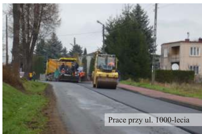
Prace przy ul. 1000-lecia