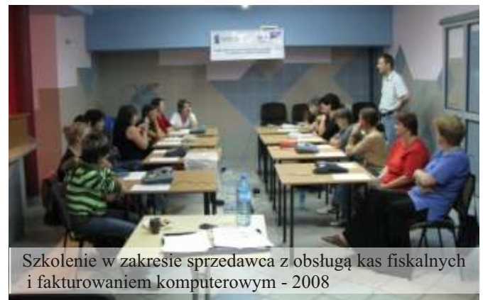
Szkolenie w zakresie sprzedawca z obsługą kas fiskalnych i fakturowaniem komputerowym - 2008

Społecznej. W ramach działalności Klubu prowadzone są m.in. spotkania informacyjne, organizowane są grupy wsparcia dla osób z problemem alkoholowym oraz warsztaty doradztwa zawodowego.