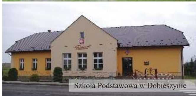
Szkoła Podstawowa w Dobieszynie