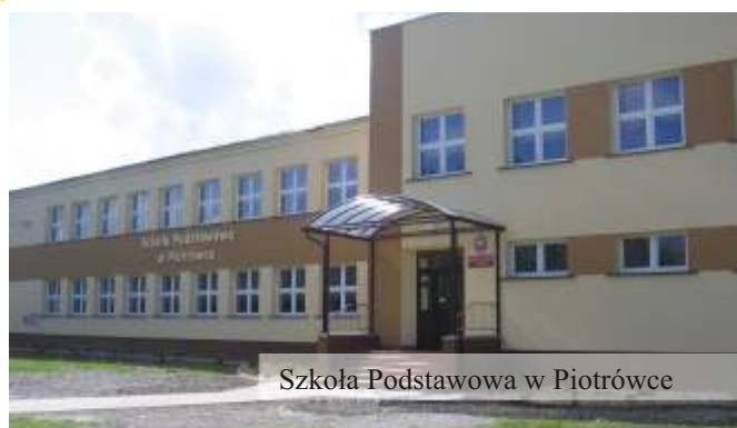
Szkoła Podstawowa w Piotrówce

W okresie tej kadencji wymieniono 99% okien w placówkach oświatowych. W każdej placówce przeprowadzono remonty bieżące, na które wydatkowano kwotę ponad 1,3 mln złotych. Zdecydowanie został zmieniony wygląd zewnętrzny i wewnętrzny kolejnych placówek. Wykonano elewację i docieplenia w budynkach Szkół: w Dobieszynie, Piotrówce i Żarnowcu oraz Samorządowym Przedszkolu w Jedliczu. Znaczną część środków na ten cel pozyskano z funduszy unijnych. Łączny koszt tych prac wyniósł ponad 600 tys. złotych. Wykonano dojazd do Szkoły w Długiem i Potoku. Poprawił się także wygląd obejścia wszystkich szkół. Placówki w naszej Gminie