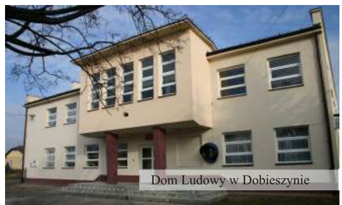
Dom Ludowy w Dobieszynie

Wiele z tych prac udało się wykonać dzięki zaangażowaniu sołtysów, Rad Sołeckich i Kół Gospodyń Wiejskich.