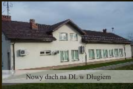
Nowy dach na DL w Długiem