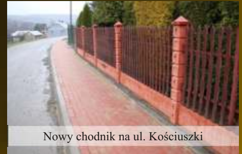
Nowy chodnik na ul. Kościuszki