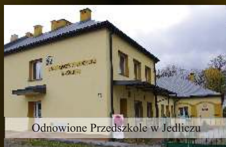
Odnowione Przedszkole w Jedliczu