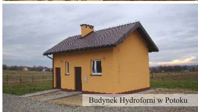
Budynek Hydroforni w Potoku

ten cel 757 tys. złotych. Corocznie Gmina ponosi koszty transportu i utylizacji