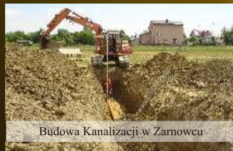
Budowa Kanalizacji w Żarnowcu