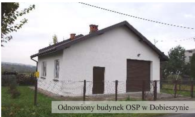
Odnowiony budynek OSP w Dobieszynie

W tej kadencji na utrzymanie Ochotniczych Straży Pożarnych wydatkowano kwotę 1.626 tys. złotych.