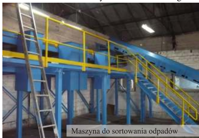
Maszyna do sortowania odpadów

Od 1 stycznia 2010 roku śmieci, które wszyscy produkujemy nie są już składowane, ale dzięki zawartej przez JPGKiM umowie są wywożone poza teren gminy i przetwarzane jako surowiec wtórny, co z punktu widzenia ekologii jest znacznie bardziej korzystne niż ich składowanie. Siedziba spółki została gruntownie odremontowana. Ponadto wybudowano dwa duże garaże