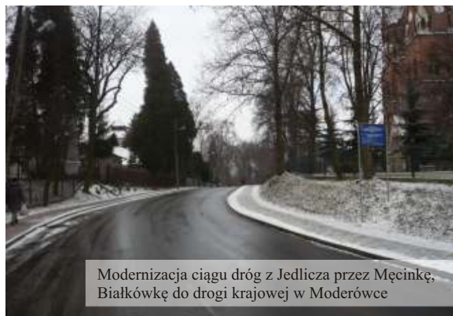
Modernizacja ciągu dróg z Jedlicza przez Męcinkę, Białkówkę do drogi krajowej w Moderówce