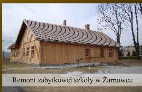
Remont zabytkowej szkoły w Żarnowcu