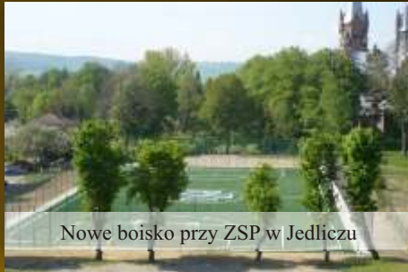
Nowe boisko przy ZSP w Jedliczu