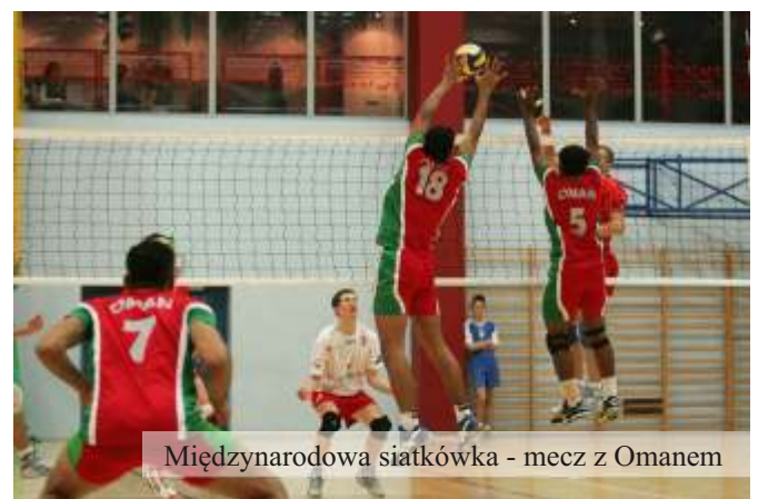
Międzynarodowa siatkówka - mecz z Omanem