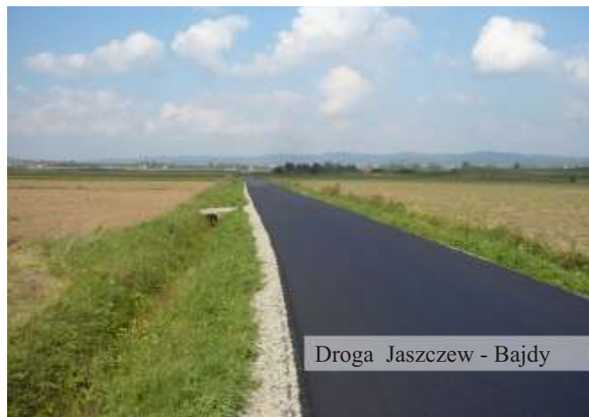
Droga Jaszczew - Bajdy