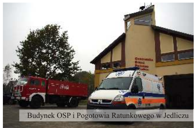
Budynek OSP i Pogotowia Ratunkowego w Jedliczu