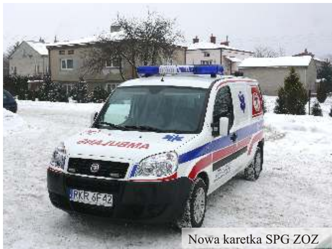
Nowa karetka SPG ZOZ

Ponadto w 2010 r. zmieniła się siedziba Pogotowia Ratunkowego. Z budynku w dz. Borek pogotowie przeniesiono do nowo wybudowanego budynku przy ul. Sienkiewicza, gdzie stacjonuje razem z Ochotniczą Strażą Pożarną, co znacznie ułatwia koordynację działań tych służb.