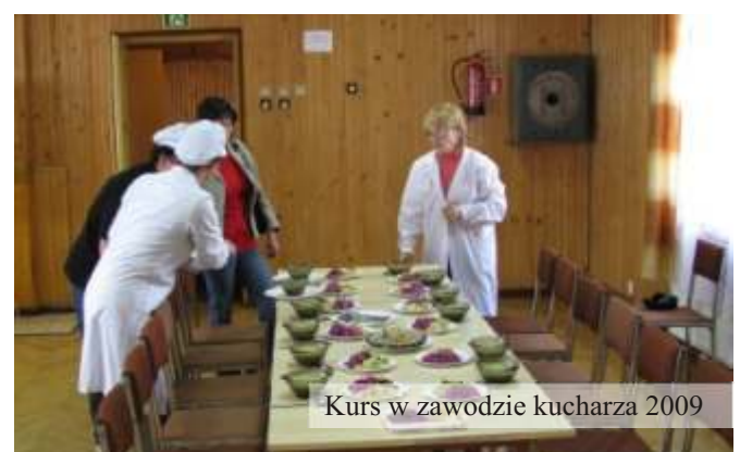
Kurs w zawodzie kucharza 2009