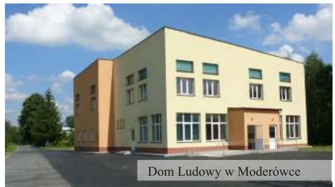
Dom Ludowy w Moderówce

Kolejnych dużych nakładów finansowych wymaga zabytkowy Dom Ludowy w Jaszczwi. Po przeprowadzeniu już kilku etapów kosztownych prac remontowych wydawało się, że skończyły się problemy i zagrożenie katastrofą budowlaną. Niestety pod koniec 2009 roku okazało się, że zagrożony jest dach budynku co jest efektem wymontowania części elementów konstrukcyjnych dachu podczas prowadzonych remontów w przeszłości. Gmina jeszcze w tym roku wyda ze swojego budżetu kwotę ponad 73 tys. zł z przeznaczeniem na wzmocnienie i zabezpieczenie konstrukcji tego dachu.