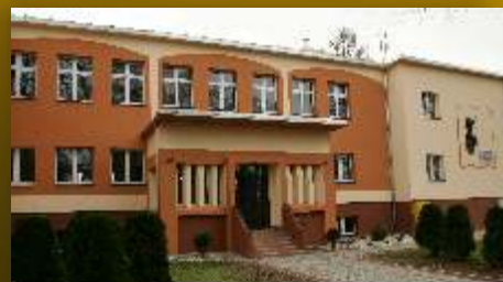
Odnowiona SP w Żarnowcu