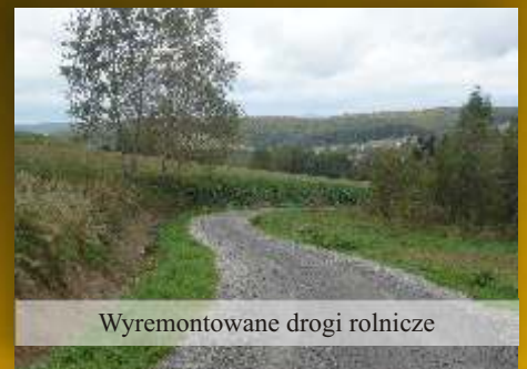
Wyremontowane drogi rolnicze