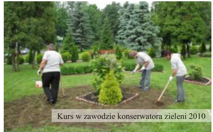
Kurs w zawodzie konserwatora zieleni 2010

W czerwcu 2009 r. w Ośrodku powstał Klub Integracji