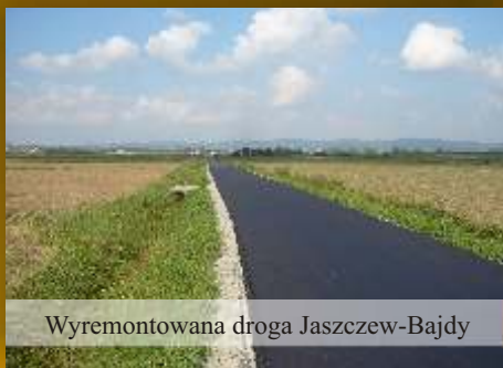
Wyremontowana droga Jaszczew-Bajdy