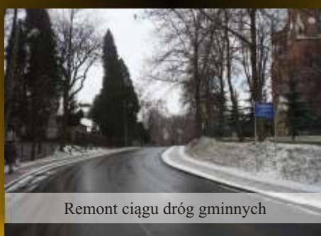
Remont ciągu dróg gminnych