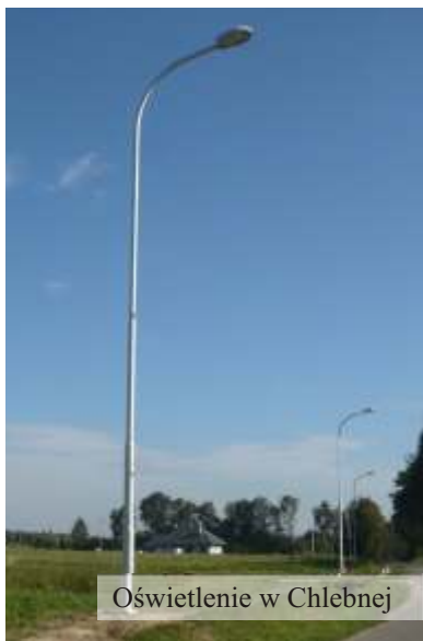
Oświetlenie w Chlebnej

Ściśle z drogami powiązane jest zagadnienie oświetlenia ulic. W minionym czteroletnim okresie wykonano oświetlenie m.in.: w Żarnowcu, Długiem, Jaszczwi, Jedliczu i Chlebnej za kwotę ponad 600 tys. zł. Myśląc o dalszym rozwoju sieci oświetleniowej przygotowano kolejne projekty.