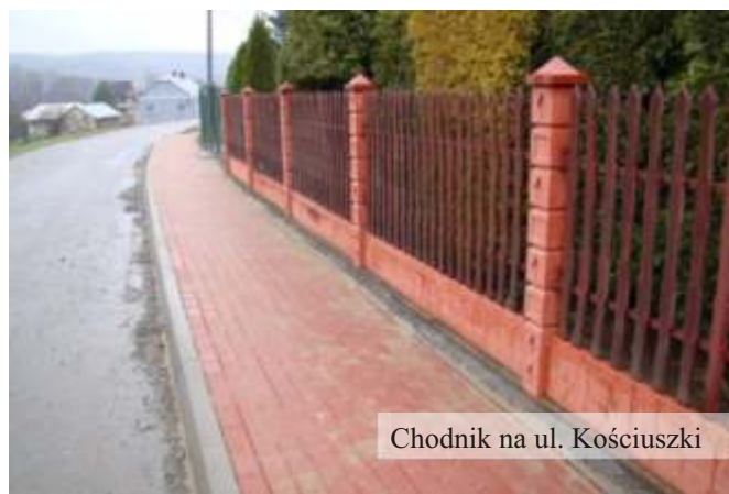
Chodnik na ul. Kościuszki