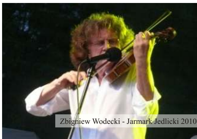
Zbigniew Wodecki - Jarmark Jedlicki 2010