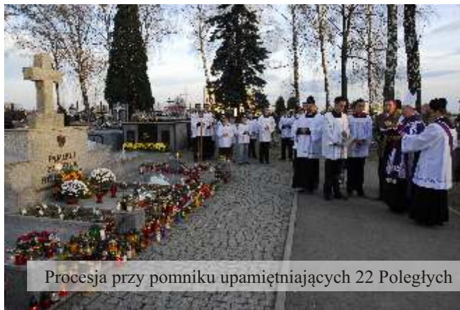
Procesja przy pomniku upamiętniających 22 Poległych