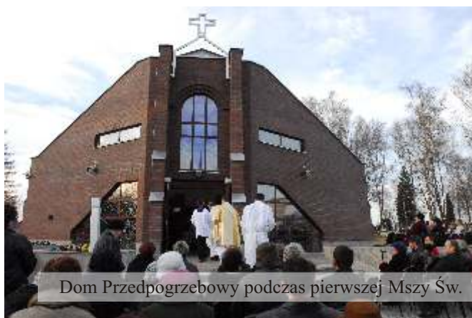
Dom Przedpogrzebowy podczas pierwszej Mszy Św.