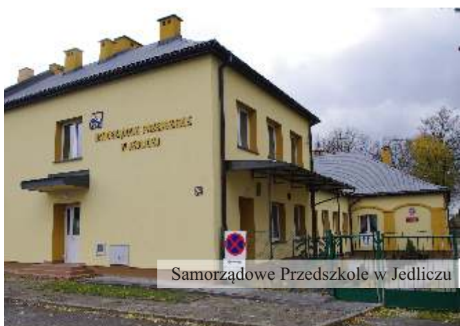
Samorządowe Przedszkole w Jedliczu