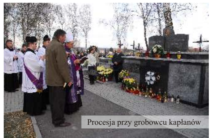
Procesja przy grobowcu kapłanów