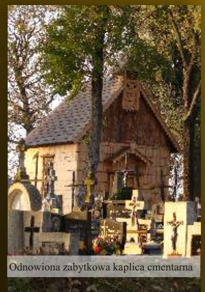
Odnowiona zabytkowa kaplica cmentarna