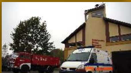
Nowy budynek OSP i Pogotowia w Jedliczu