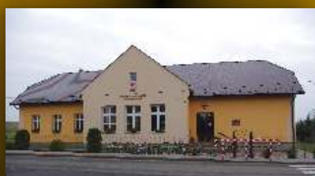
Odnowiona SP w Dobieszynie