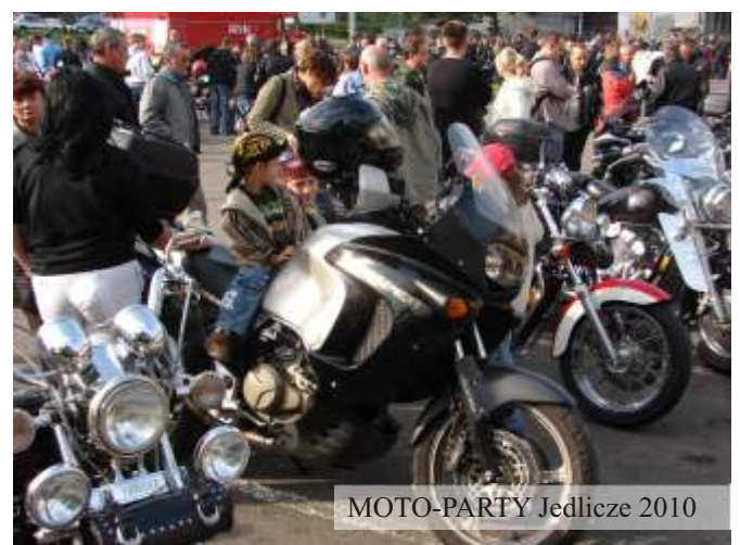
MOTO-PARTY Jedlicze 2010