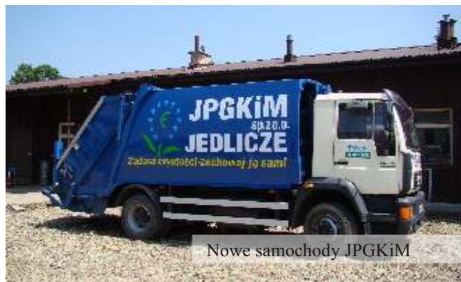
Nowe samochody JPGKiM

na sprzęt oraz wykonano asfaltowe parkingi wokół budynku.