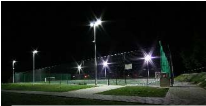
Boisko ze sztuczną nawierzchnią przy ZSP w Jedliczu

W 2007 r. Gmina Jedlicze weszła w program