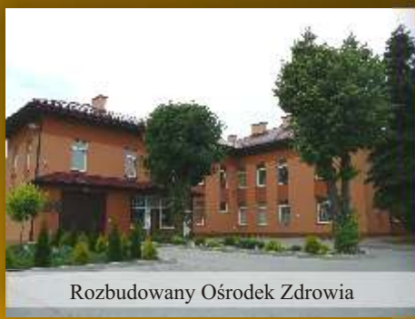
Rozbudowany Ośrodek Zdrowia