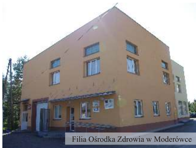
Filia Ośrodka Zdrowia w Moderówce