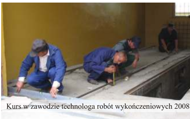
Kurs w zawodzie technologia robót wykończeniowych 2008

W swoich działaniach Ośrodek nawiązuje współpracę z Urzędem Gminy, Gminną Komisją Rozwiązywania Problemów Alkoholowych, Ochotniczymi Strażami Pożarnymi, kuratorami sądowymi, szkołami, Powiatowym Centrum Pomocy Rodzinie, Powiatowym i Wojewódzkim Urzędem Pracy.