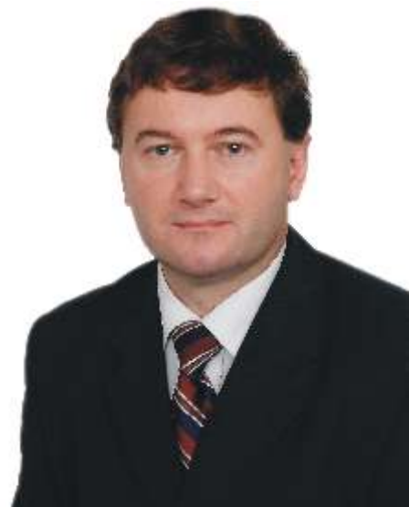
Burmistrz Gminy Jedlicze Zbigniew Sanocki