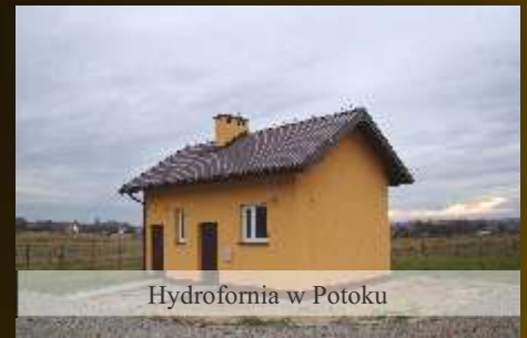
Hydrofornia w Potoku