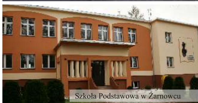
Szkoła Podstawowa w Żarnowcu