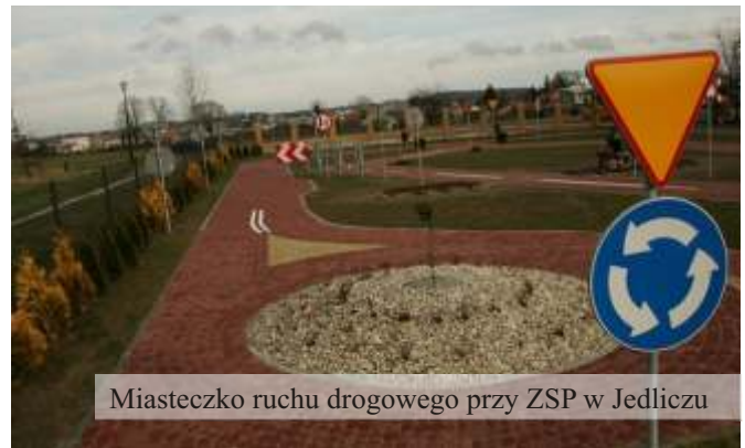
Miasteczko ruchu drogowego przy ZSP w Jedliczu

dożywiania dzieci. W ramach tego programu pozyskano blisko 1 mln zł, za które m.in. wyremontowano kuchnię w Zespole Szkół w Jedliczu oraz stołówki w szkołach na terenie Gminy.