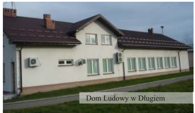
Dom Ludowy w Długiem