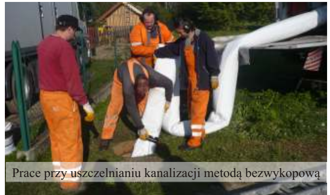
Prace przy uszczelnianiu kanalizacji metodą bezwykopową

Związek Gmin Dorzecza Rzeki Wisłoki, do którego należy Gmina Jedlicze ubiega się o środki finansowe z przeznaczeniem na dotację do instalacji paneli słonecznych na budynkach prywatnych. Wniosek przeszedł pozytywną weryfikację i czeka na dofinansowanie.