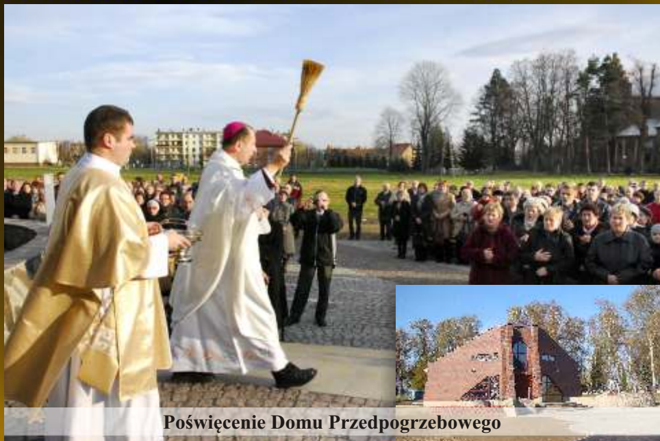
Poświęcenie Domu Przedpogrzebowego