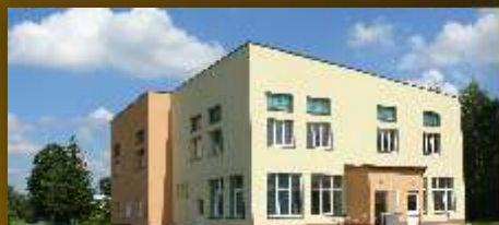
Odnowiony DL w Moderówce

CHLEBNA • DŁUGIE • DOBIESZYN • JASZCZEW • JEDLICZE • MODERÓWKA • PIOTRÓWKA • PODNIEBYLE • POTOK • POREBY • ŻARNOWIEC