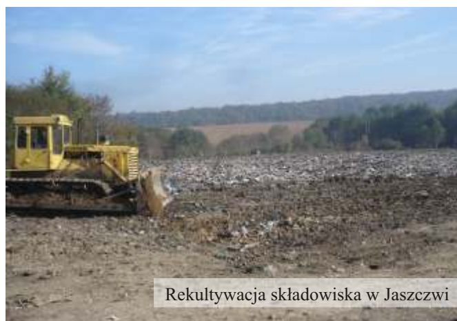
Rekultywacja składowiska w Jaszczwi