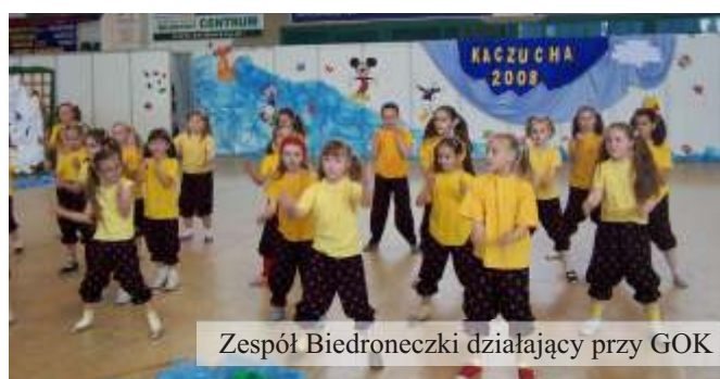
Zespół Biedroneczki działający przy GOK