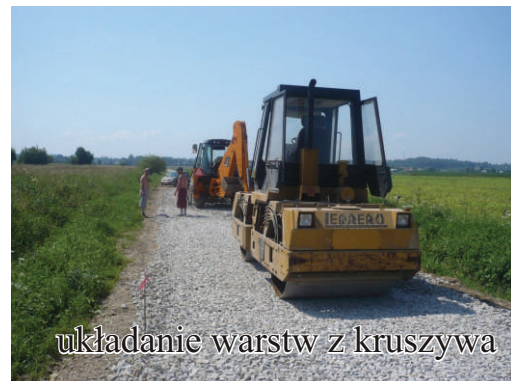
układanie warstw z kruszywa