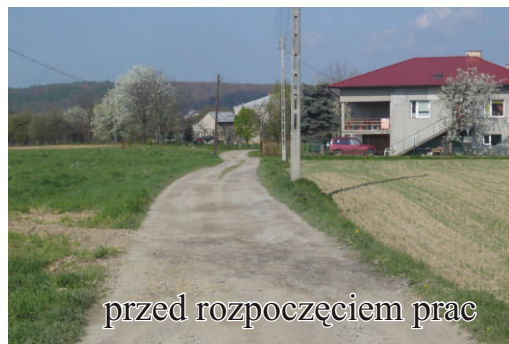
przed rozpoczęciem prac

23 czerwca 2010 r. oddano wyremontowany odcinek drogi bocznej od ul. Armii Krajowej w Jedliczu. Prace trwały od kwietnia i obejmowały 200-metrowy odcinek drogi, na której położono nową nawierzchnię bitumiczną.