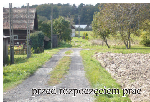
przed rozpoczęciem prac

Zakończono prace przy remoncie odcinka drogi w Potoku koło państwa Młoczek. Prace obejmowały przygotowanie podłoża oraz położenie nawierzchni bitumicznej na odcinku 250 m.