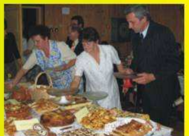
Degustacja przygotowanych potraw