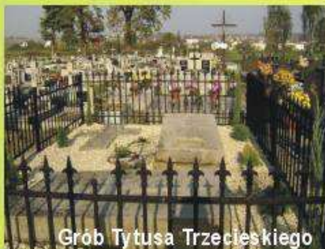
Grób Tytusa Trzecieskiego

Dzięki finansowemu wsparciu Rafinerii Nafty Jedlicze uporządkowano grób Tytusa Trzecieskiego.