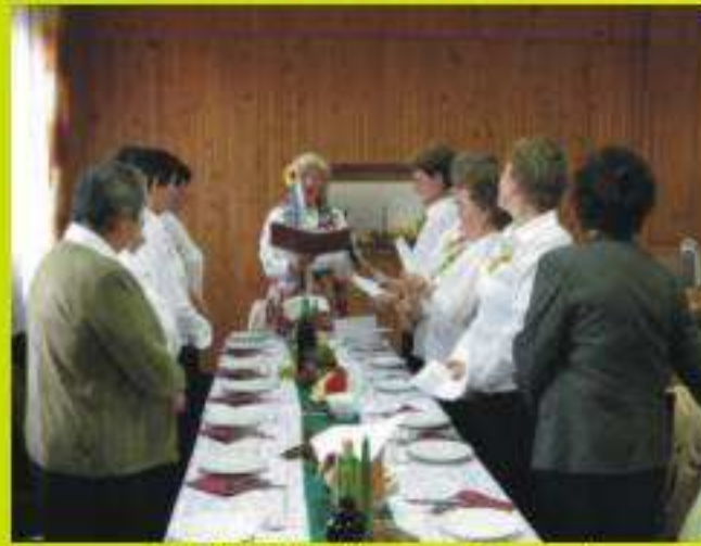
KGW Jedlicze - Borek