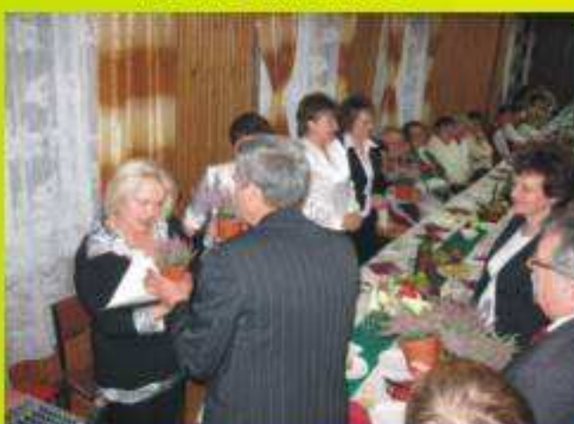
Wrzosa dla Gospodyń