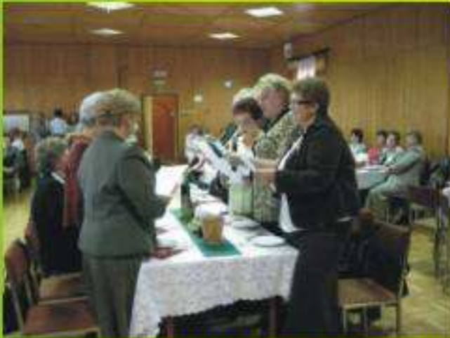
Miejskie Koło Kobiet Jedlicze - Centrum