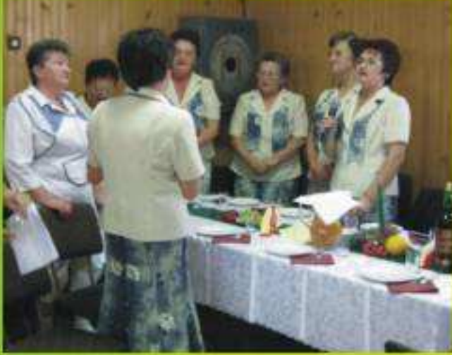
Osiedlowe Koło Kobiet Jedlicze-Borek