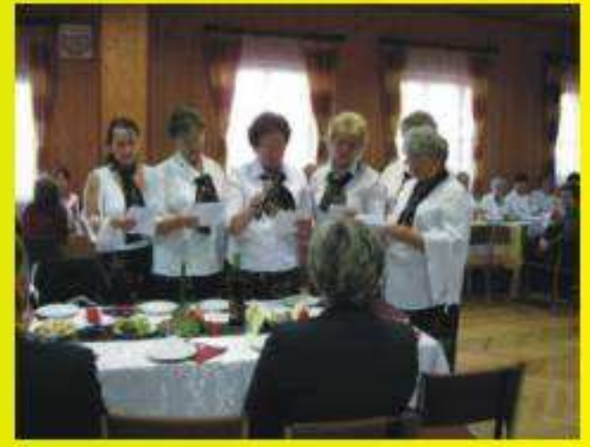
KGW Jedlicze - Męcinka