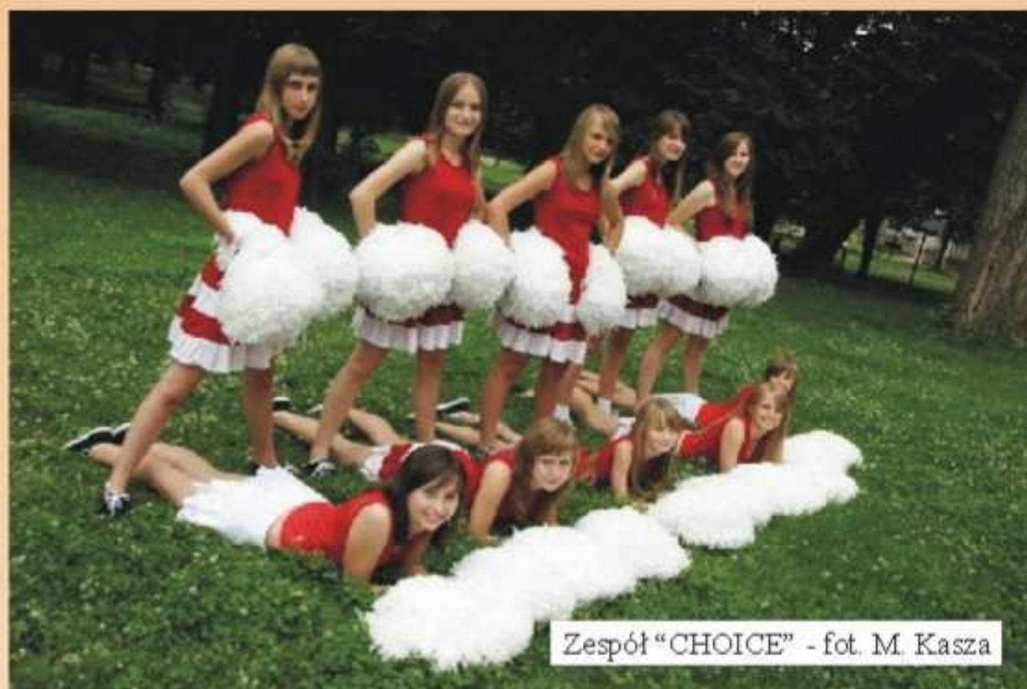
Zespół „CHOICE”

2006 r. W skład zespołu wchodzi sześć dziewcząt, które są uczennicami Liceum Ogólnokształcącego im. M. Konopnickiej