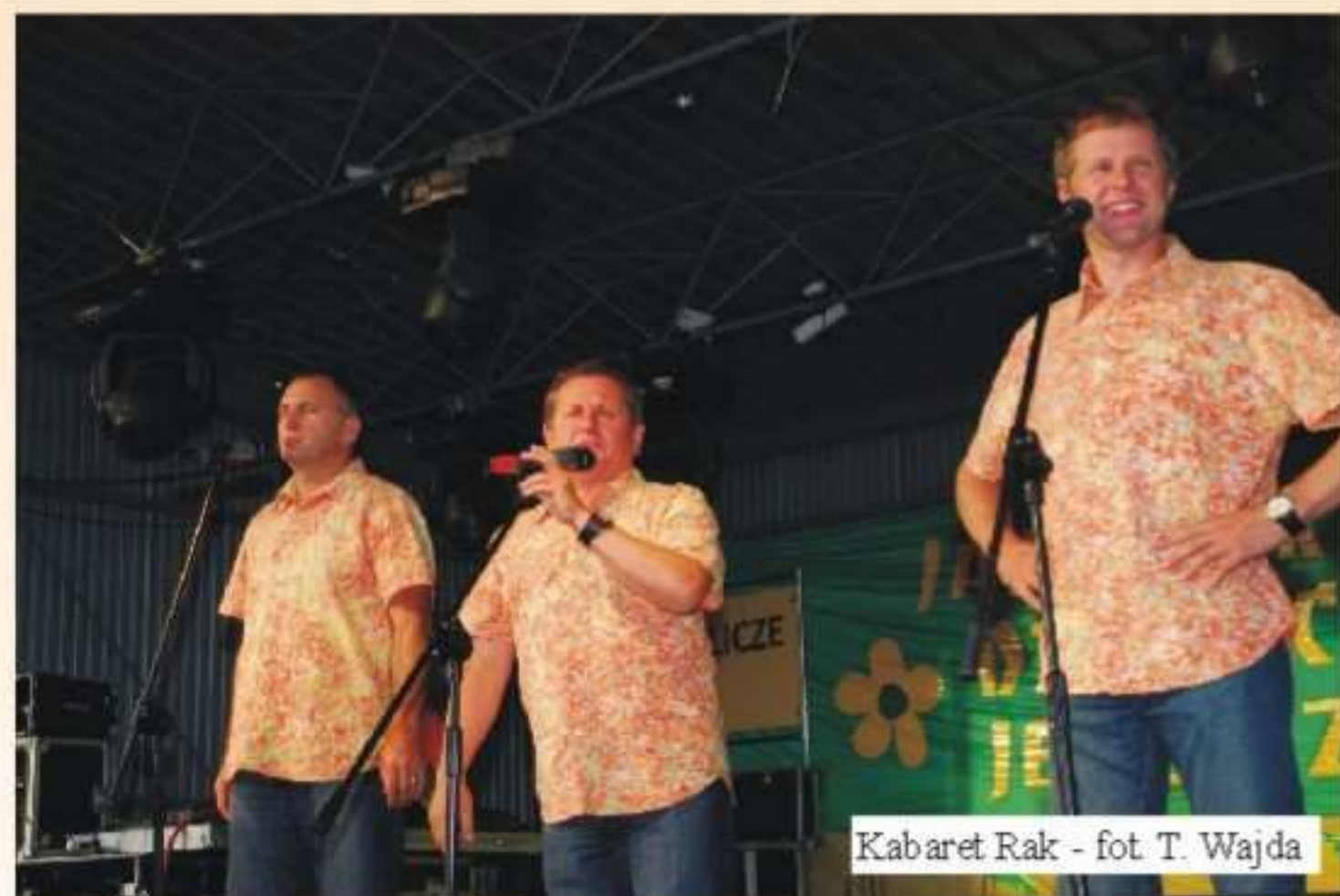
Kabaret Rak

Następnie wystąpiły zespoły taneczne działające przy GOK.