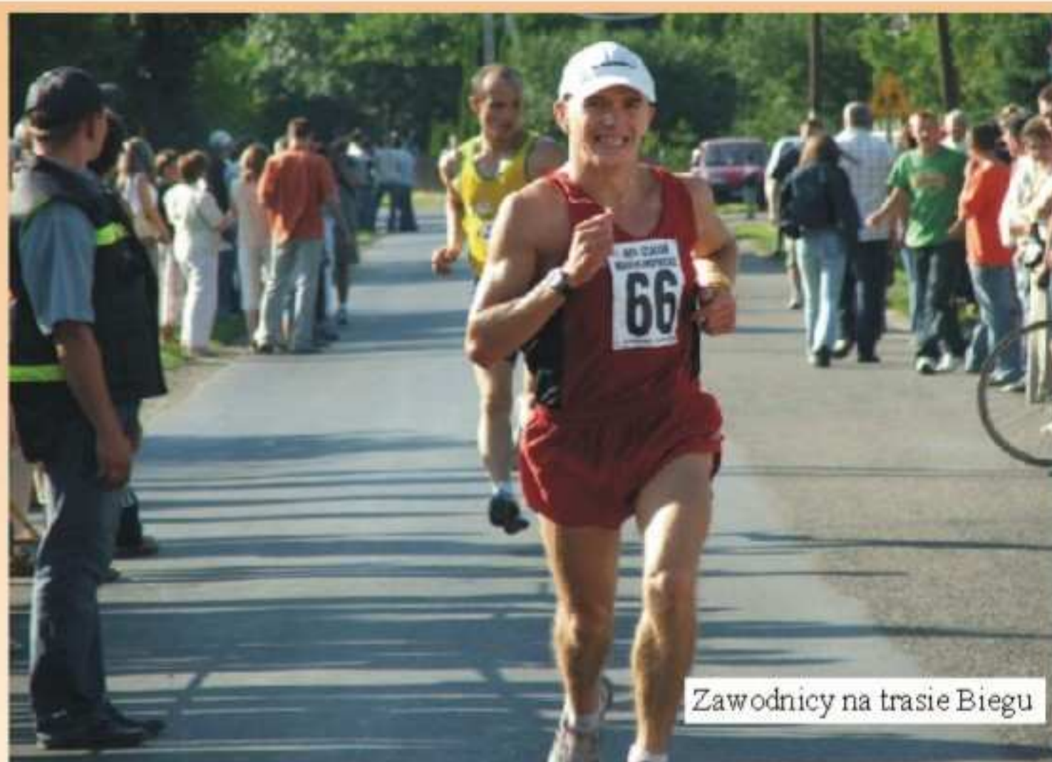
Zawodnicy na trasie Biegu