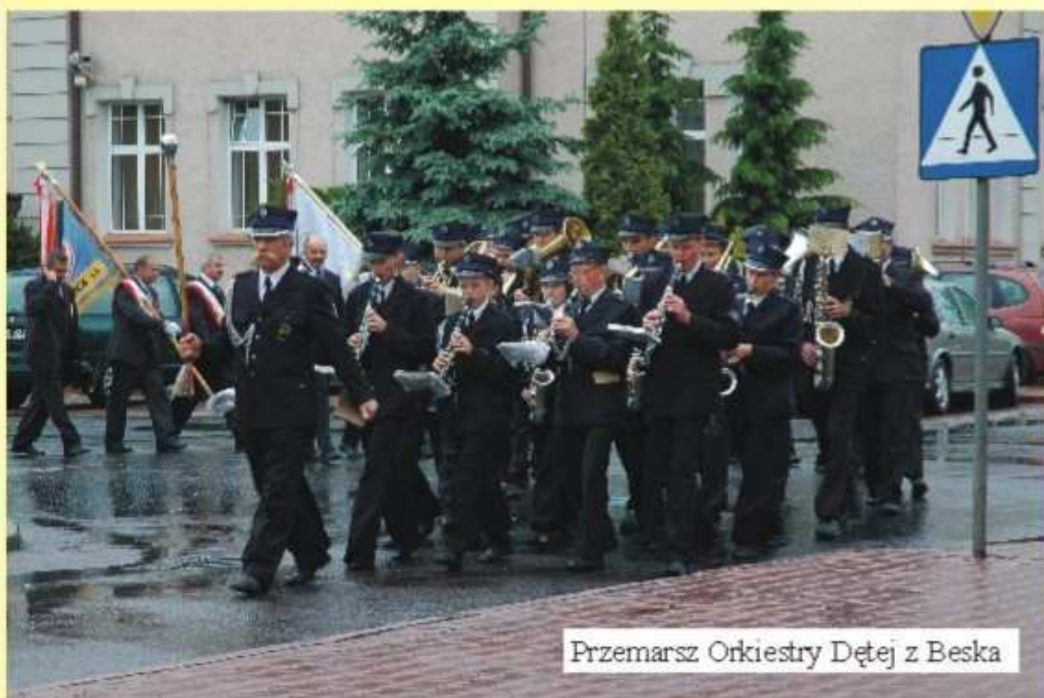
Przemarsz Orkiestry Dętej z Beska