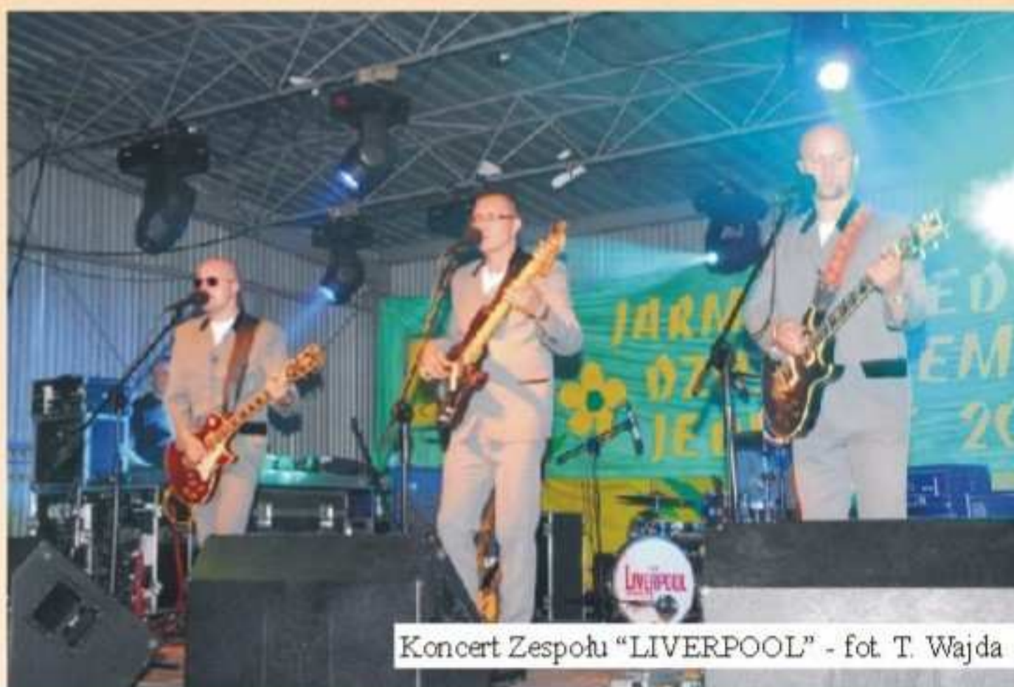
Koncert Zespołu „LIVERPOOL”

Gastronomię zapewnił „Bar nad oceanem” z Frysztaka.