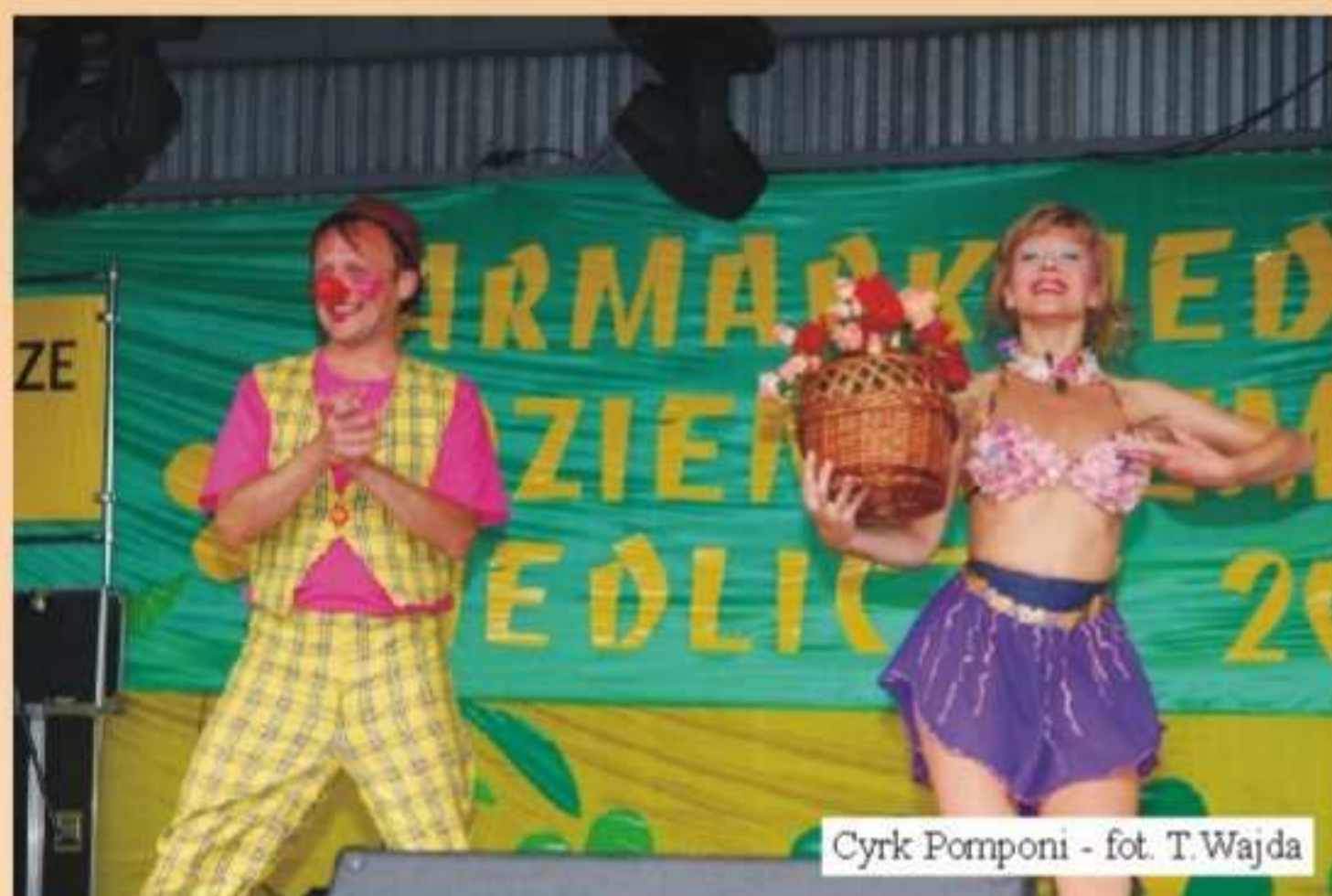
Cyrk Pomponi

Impreza rozpoczęła się pokazami cyrkowców z ukraińskiego Cyrku Pomponi. Artyści bawili dzieci żonglerką, pokazami