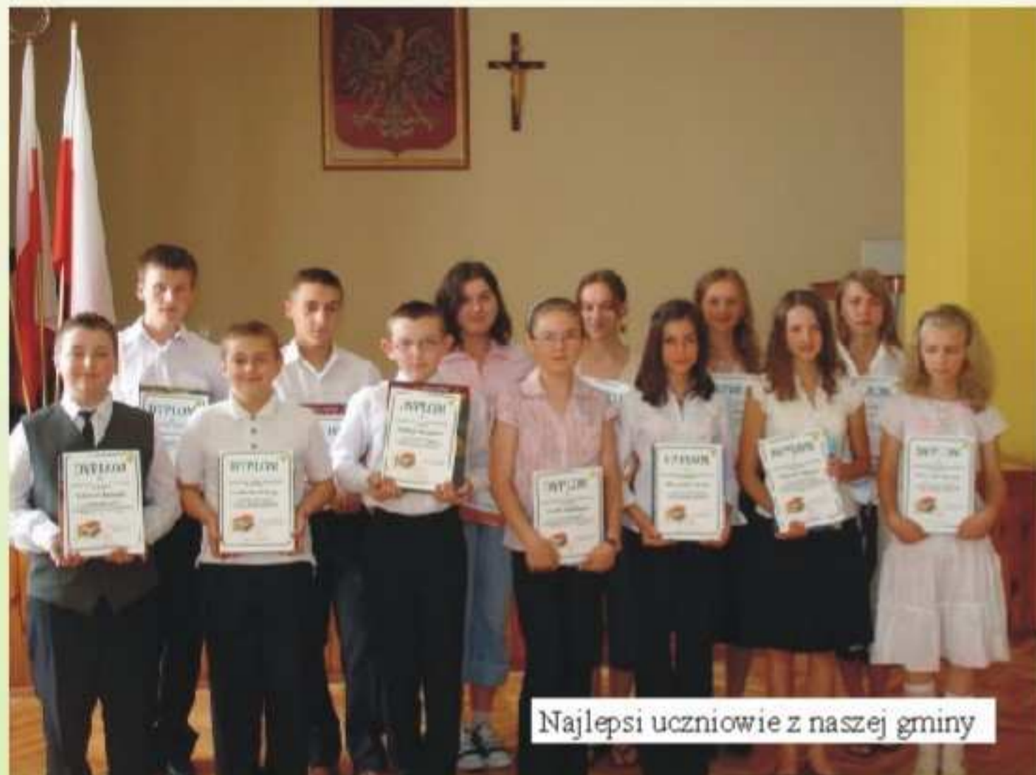
Najlepsi uczniowie z naszej gminy

21 czerwca br. w Urzędzie Gminy w Jedliczu zostały wręczone Nagrody Burmistrza Gminy Jedlicze dla 14 wyróżniających się uczniów z każdej szkoły naszej gminy. Pozwólcie, że przytoczę słowa Jana Pawła II: każdy ma w sobie talent. A Wy udowodniście, że potraficie z niego