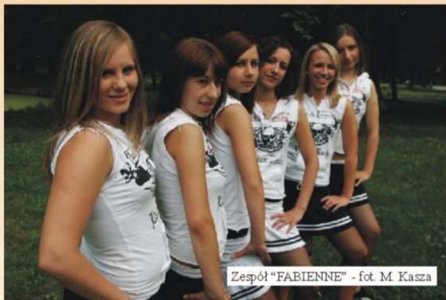
Zespół „FABIENNE”

Przy GOSiR w Jedliczu działają dwa zespoły taneczne, które odnoszą coraz większe sukcesy promując tym samym naszą gminę w kraju. W maju br. w Stalowej Woli odbył się III Wojewódzki Przegląd Zespołów Szkolnych pod patronatem Marszałka Województwa Podkarpackiego, Wojewody Podkarpackiego i Starosty Powiatu Stalowowolskiego. W ciągu trzech dni prezentowane były m.in. występy teatralne, pokazy taneczne oraz przegląd twórczości muzycznej. Początkowo odbywały się tu tylko eliminacje dla szkół ze Stalowej Woli i powiatu, jednak z roku na rok wzrastająca liczba chętnych do wzięcia w nim udziału spowodowała, że od 3 lat przegląd objął