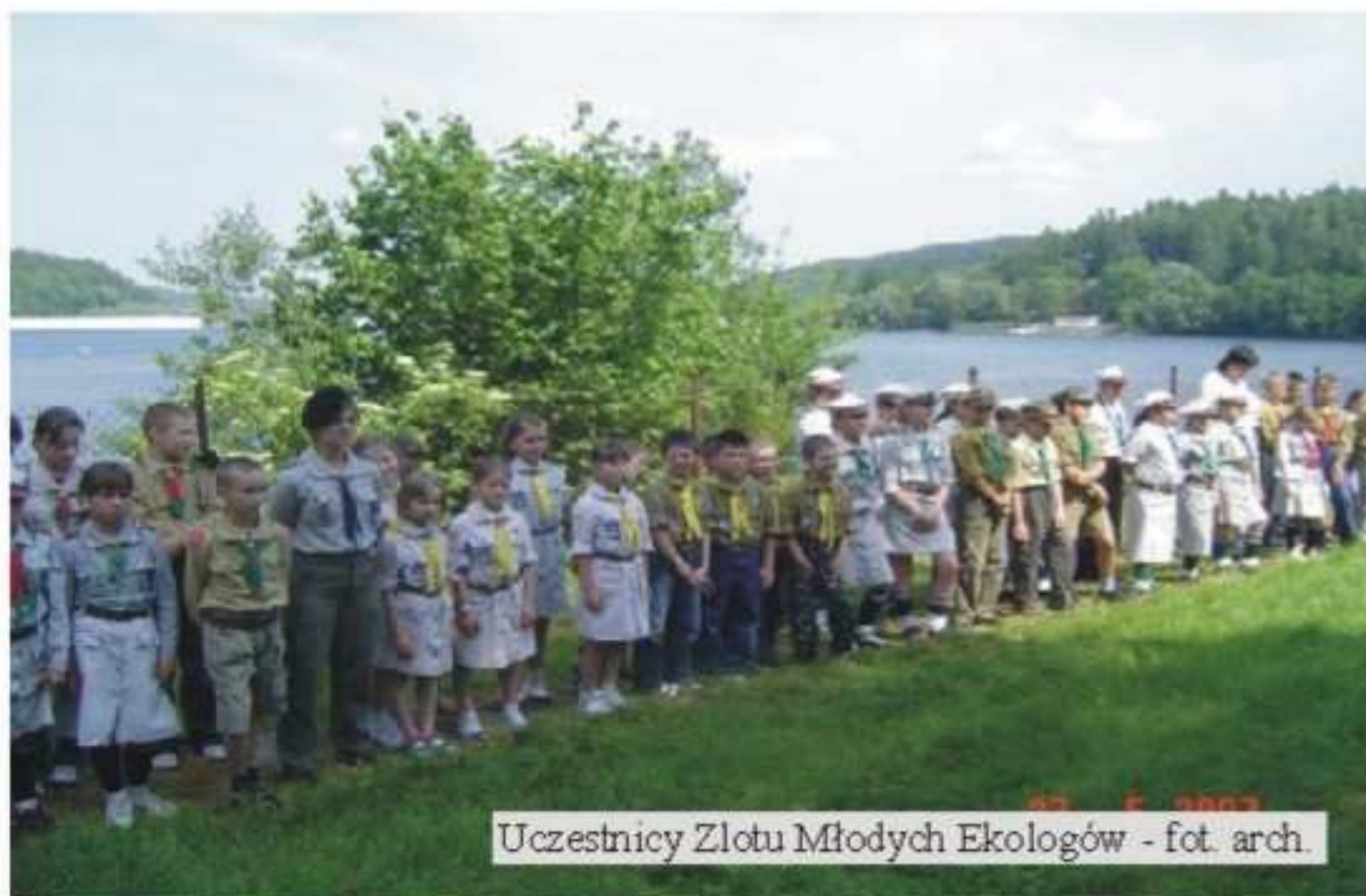
Uczestnicy Złotu Młodych Ekologów

W dniach od 25 – 27 maja 2007 r. 11 Gromada Zuchowa „Laskowe Orzeszki” z Jedlicza wzięła udział w X Zlocie Młodych Ekologów, który był podsumowaniem XVIII edycji Ogólnopolskiej Akcji Ekologicznej „Florek”. Przez cały rok szkolny zuchy