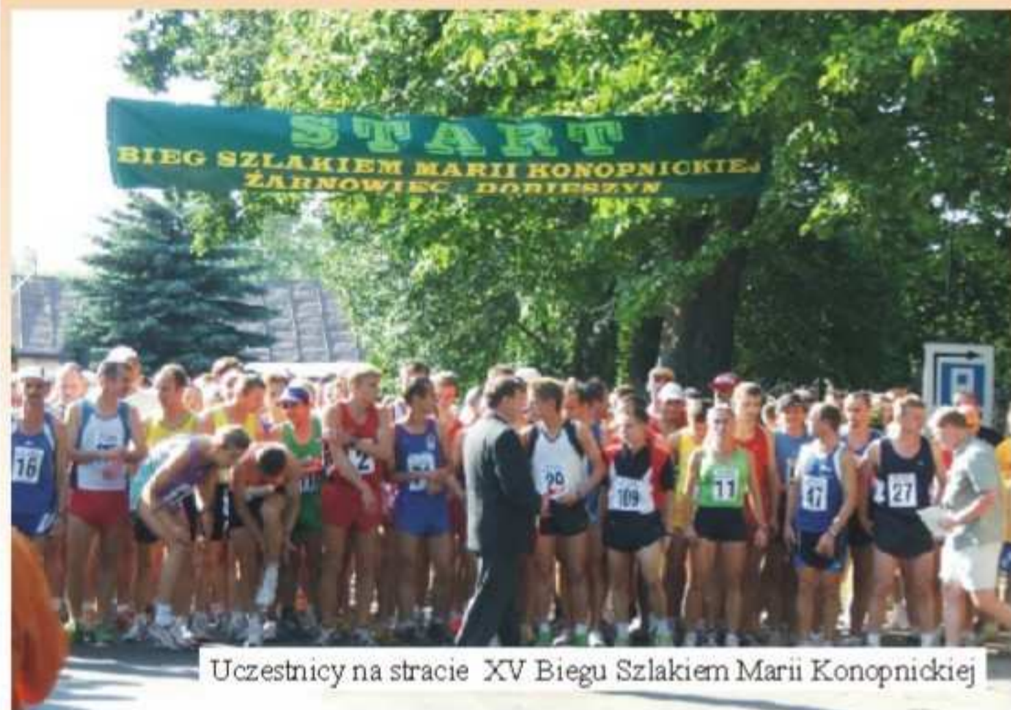
Uczestnicy na stracie XV Biegu Szlakiem Marii Konopnickiej

8 lipca już po raz XV odbył się Bieg Szlakiem Marii Konopnickiej. Tradycyjnie spod Muzeum Marii Konopnickiej w Żarnowcu uczestnicy wystartowali do biegu na dystansie 10,6 km. Meta jak zwykle usytuowana była przed Domem Ludowym w Dobieszynie.