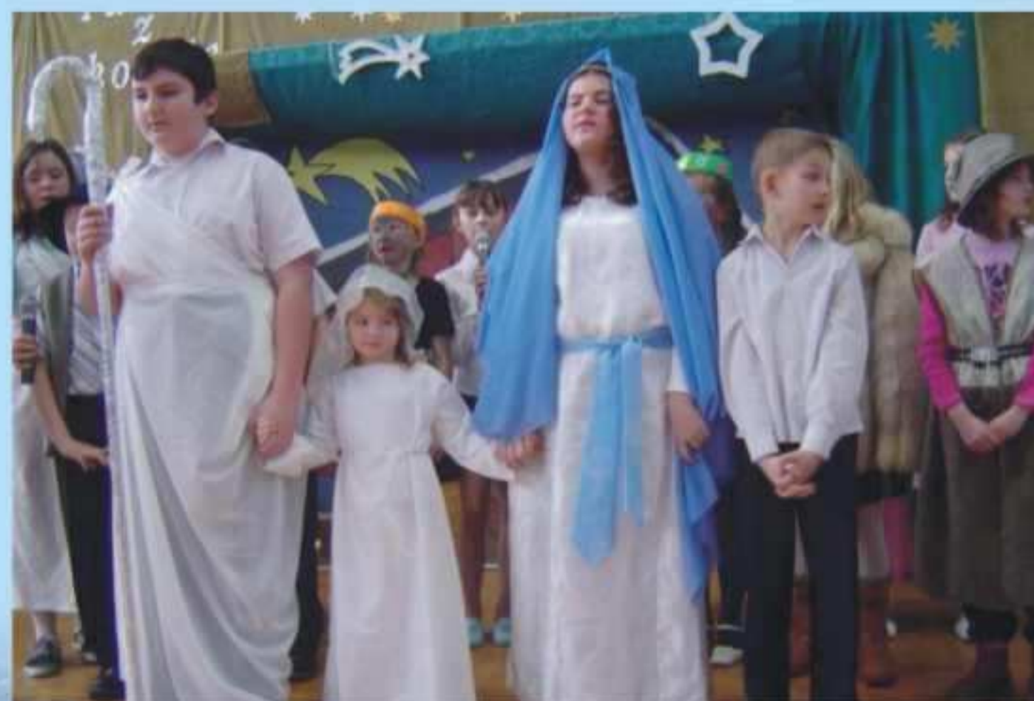
Jaselka w Gminnym Ośrodku Sportu i Rekreacji

Wydawca i adres redakcji: URZĄD GMINY W JEDLICZU, 38-460 Jedlicze, ul. Rynek 6, tel. (0-13) 435 22 07, fax (0-13) 435 20 25, e-mail: ug_jedlicze@poczta.onet.pl Redakcja: Redaktor Naczelny - Małgorzata Gonet, skład i łamanie - Piotr Wójcik, współpracownicy - GOK, GBP, GOSR, MiKS "Pockarpacie", fotografie - Mariusz Kasza Nakład 2500 egz. Przygotowanie do druku i druk: DRUKARNIA "JASŁO" Kosiba, Sz. J. 38-200 Josta, ul. Kasprzowicza 6, tel. (0-13) 446 26 51, e-mail: drukjas@karpaty.pl REDAKCJA ZASTRZEGA SOBIE PRAWO DO DOBORU I SKRACANIA PUBLIKOWANYCH INFORMACJI, MATERIAŁÓW NIE ZAMÓWIJONYCH NIE ZWRACAMY