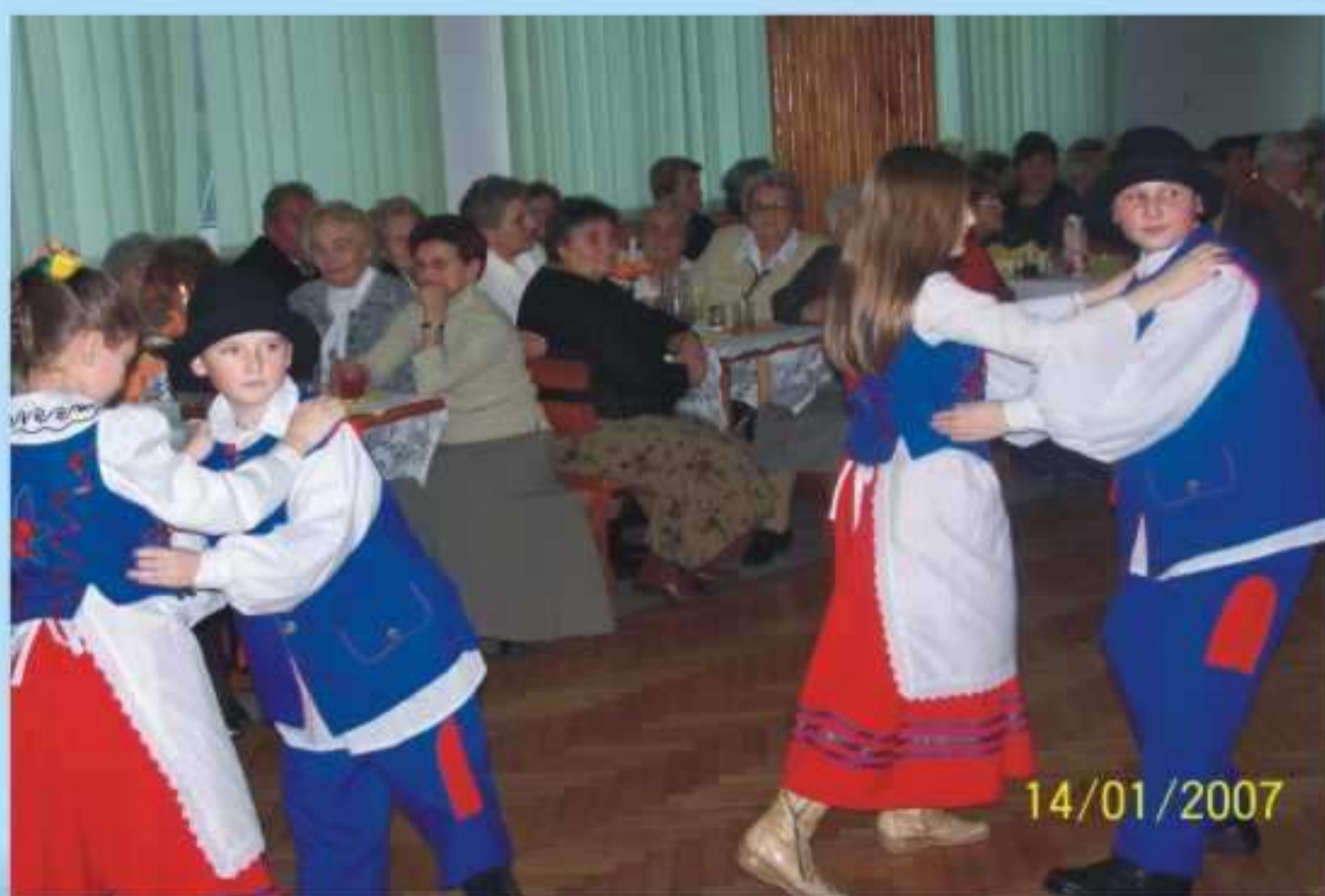
Opłatek dla starszych i samotnych w Długiem