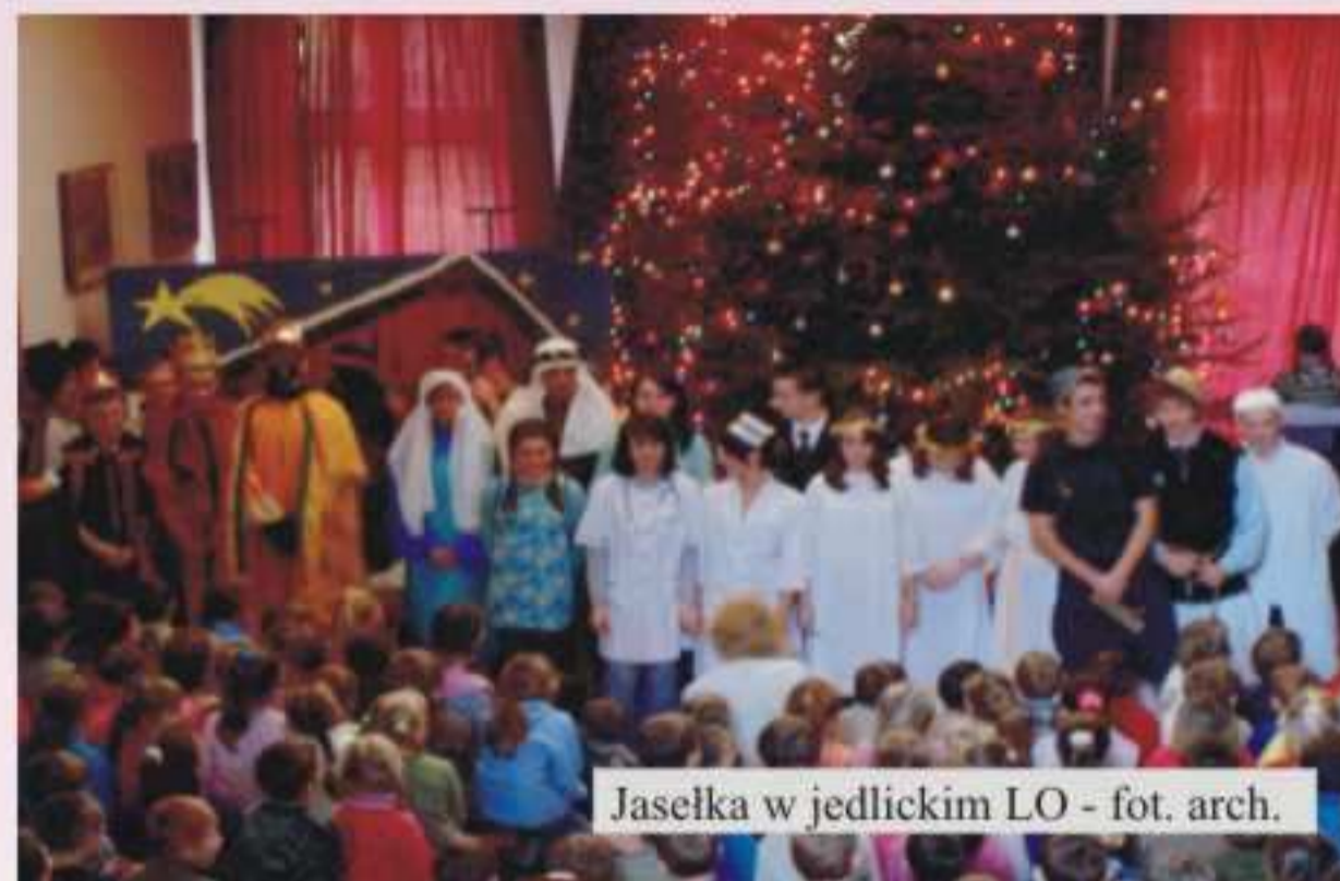
Jasełka w jedlickim LO

Trzeba powiedzieć, że takich widzów szkolne jasełka jeszcze nie miały! Żywiłowe reakcje, wypieki na buziach, spontaniczne włączanie się do śpiewanych przez jedną z uczennic kolęd to dowód, że przedstawienie się podobało i wzbudziło emocje. Nawiasem