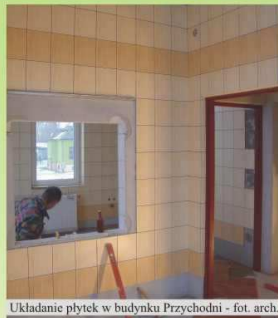
Układanie płytek w budynku Przychodni

„Restrukturyzacja i modernizacja sektora żywnościowego oraz rozwój obszarów wiejskich 2004-2006” pozyskano na ten cel 113.091 zł.