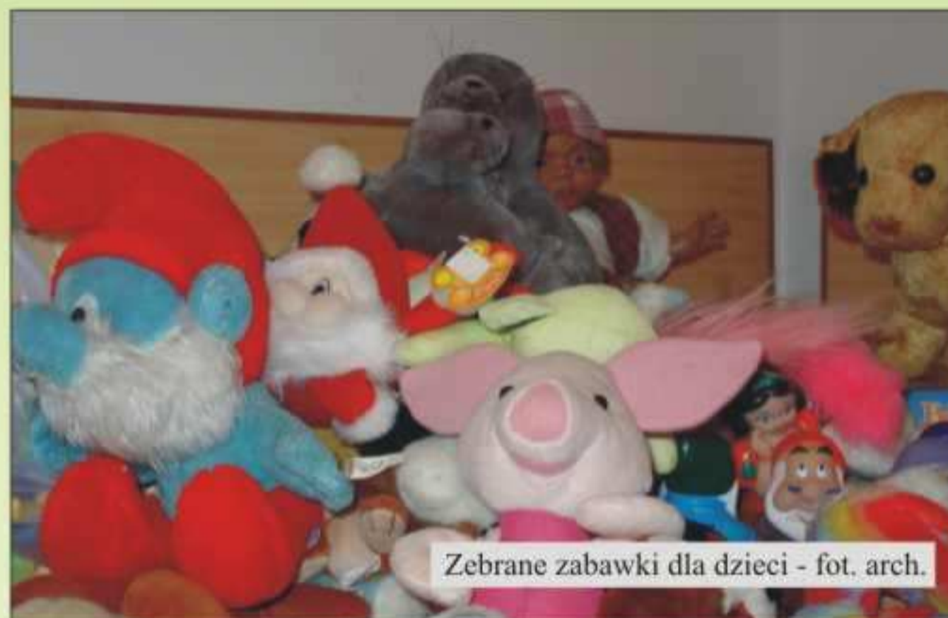
Zebrane zabawki dla dzieci

3 grudnia 2006r. na terenie Gminy Jedlicze została przeprowadzona akcja charytatywna „Pomóż dzieciom przetrwać zimę”. Zebrane dary zostały przekazane dzieciom z rodzin najuboższych z terenu gminy.