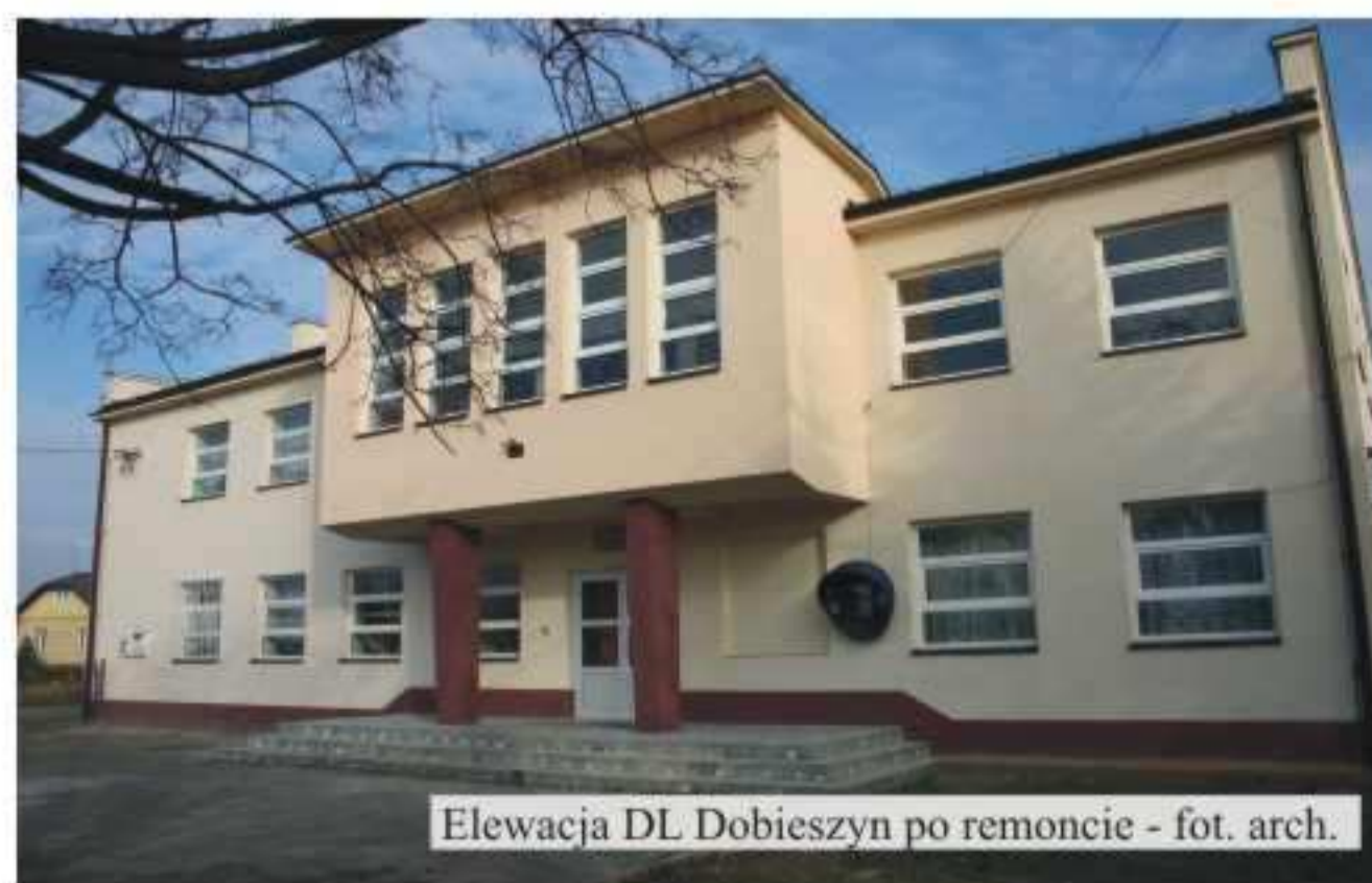
Elewacja DL Dobieszyn po remoncie

W bieżącym roku będzie przeprowadzony remont witryny sklepowej, która z uwagi na prowadzoną tam działalność gospodarczą nie mogła być uwzględniona w projekcie dofinansowania z UE.