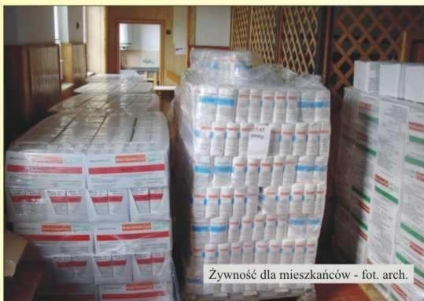
Żywność dla mieszkańców

Pomocą objęto 321 rodzin, które w ramach programu otrzymały 48.055 kg żywności.