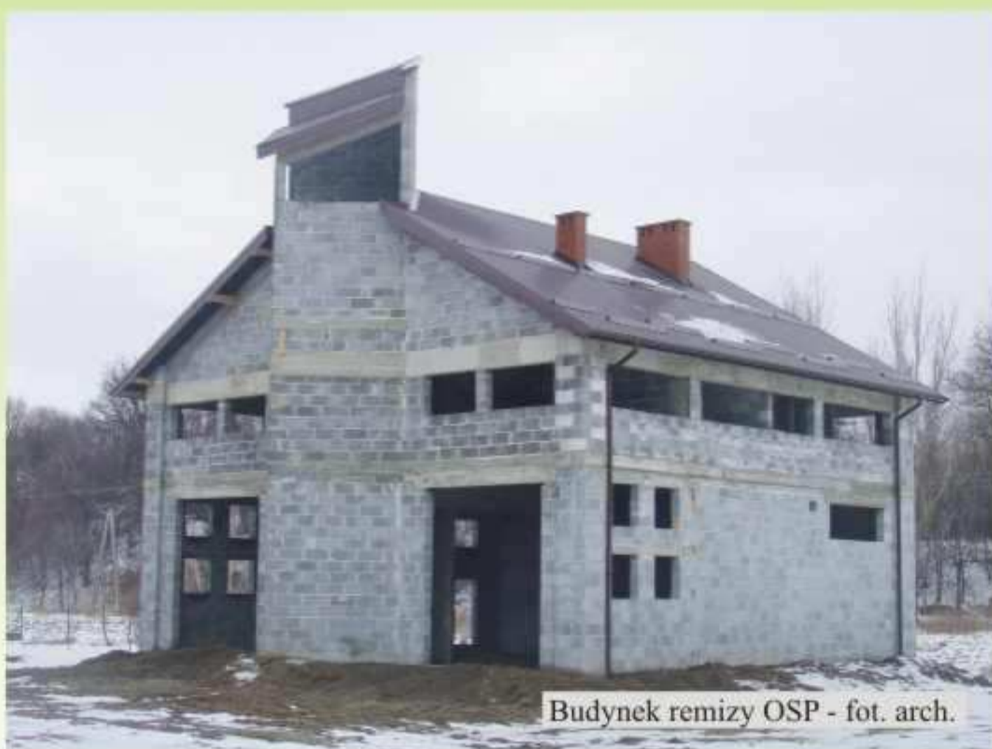
Budynek remizy OSP

W lipcu 2006r. ruszyły prace związane z budową Remizy Ochotniczej Straży Pożarnej przy ulicy Sienkiewicza w Jedliczu, niedaleko Miejskiej Oczyszczalni Ścieków. Inwestycję zaprojektowała Autorska Pracownia Projektowa „Archit Studio” z Korczyny. Wylonionym w drodze przetargu nieograniczonego wykonawcą została Firma Handlowa „Ela” H.M.B. Jasielskie Przedsiębiorstwo Inżynieryjno Budowlane Sp. z o.o. Wykonany został stan surowy budynku, który był pierwszym etapem budowy. W bieżącym roku planuje się kontynuowanie prac przy budowie obiektu. W dniu 19 stycznia br. ogłoszony został przetarg na II etap budowy budynku Remizy Ochotniczej Straży Pożarnej w Jedliczu przy ul. Sienkiewicza. Obejmuje on część robót wykończeniowych i instalacyjnych w budynku Remizy Ochotniczej Straży Pożarnej, w tym: dostawę i montaż stolarki okiennej i drzwiowej, wykonanie podłogi betonowych pod