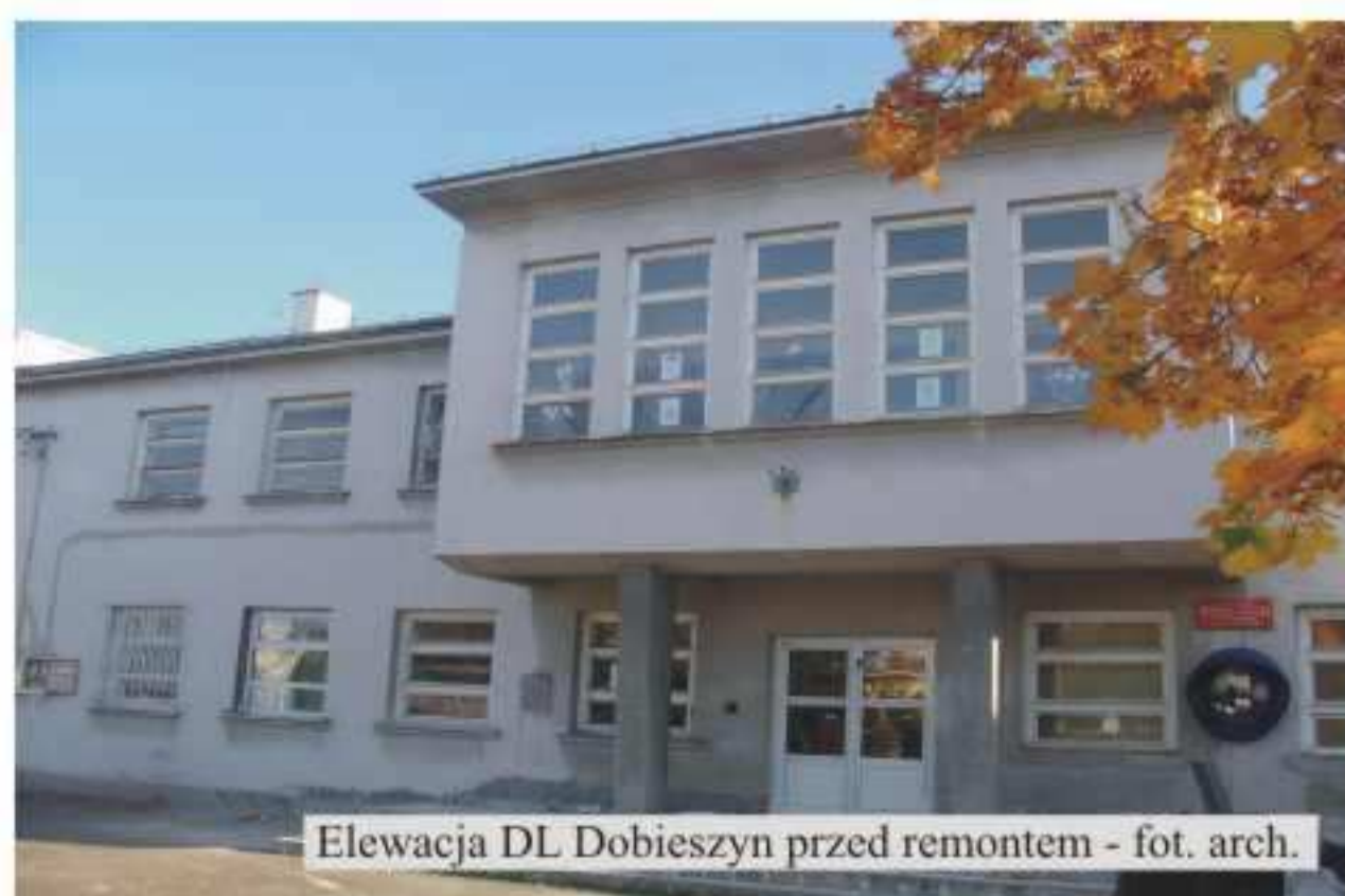
Elewacja DL Dobieszyn przed remontem

Oddano do użytku wyremontowany Dom Ludowy w Dobieszynie. Całkowity koszt remontu wyniósł 256.824,82 zł. Ze środków unijnych Sektorowego Programu Operacyjnego