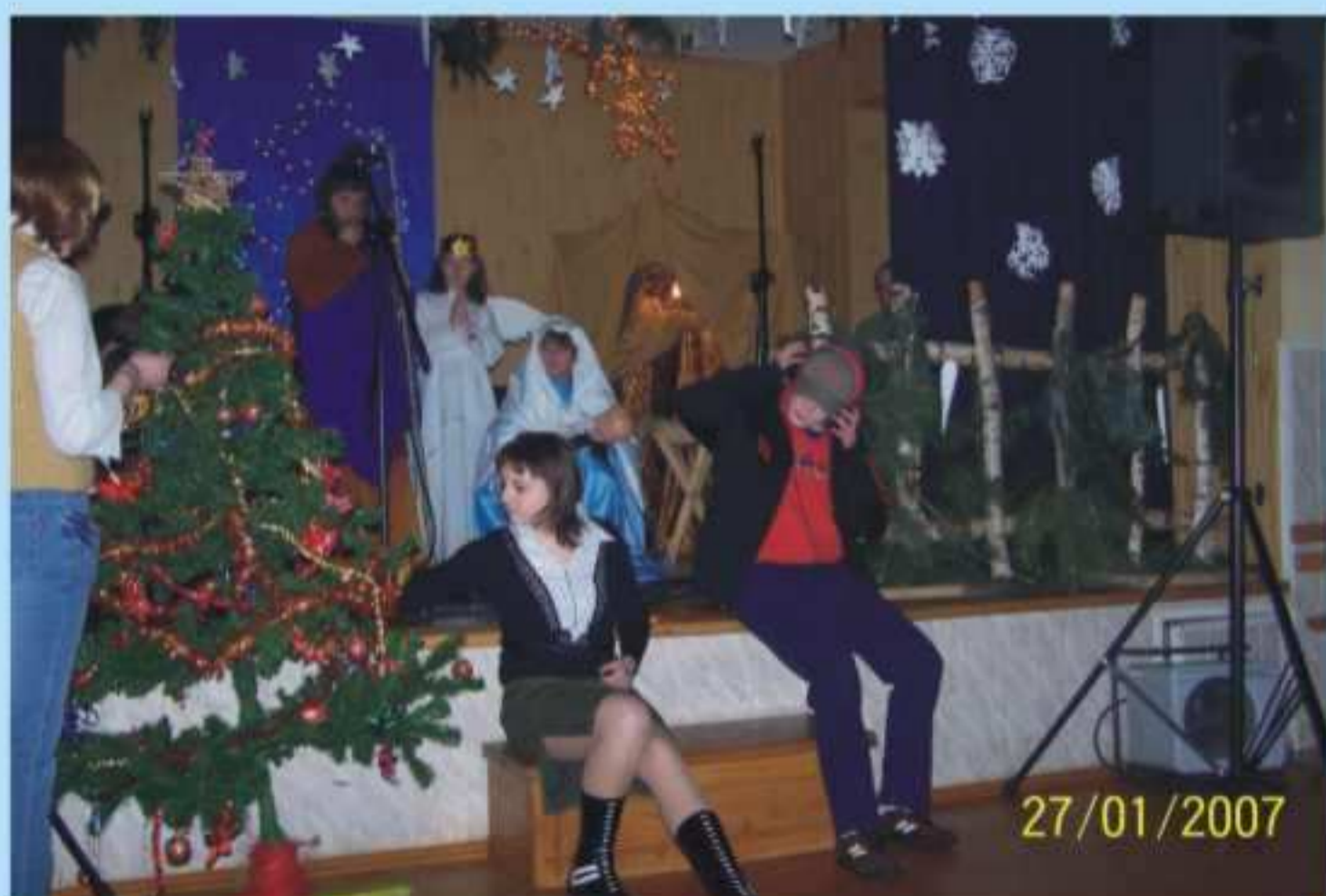
Jaselka w Chlebnej