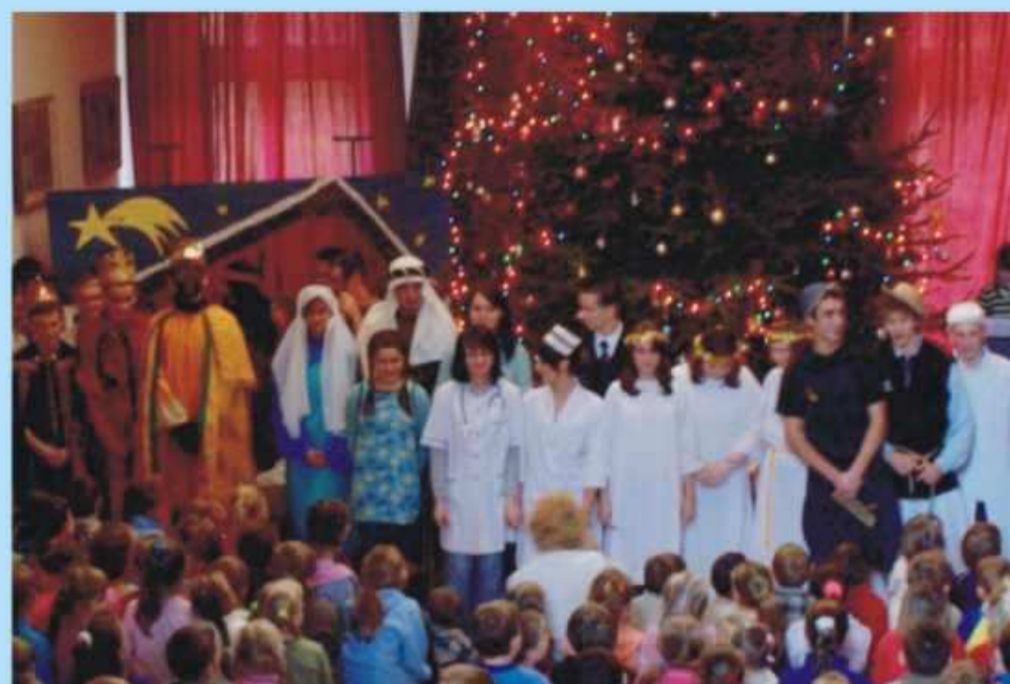
Jaselka w jedlickim LO