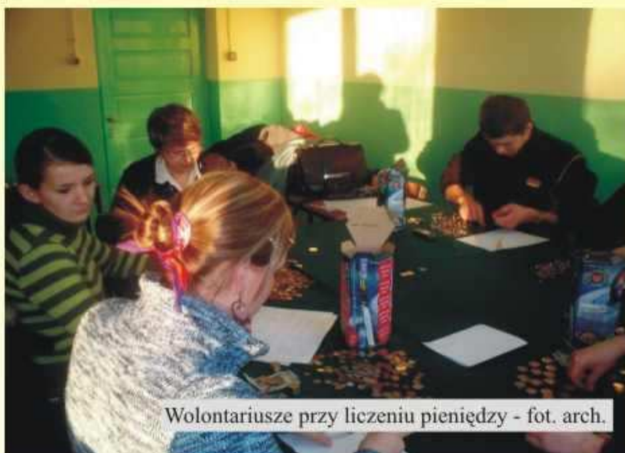
Wolontariusze przy liczeniu pieniędzy

XV Finał przypadł na 14 stycznia 2007 roku. W tym dniu każdy wolontariusz posiadał ważny identyfikator i puszkę, zabezpieczoną plombami. Kwestorzy zbierali pieniądze na rzecz fundacji w Jedliczu i w okolicznych miejscowościach. I tym razem zebrane pieniądze zostaną przeznaczone dla ratowania życia dzieci poszkodowanych w wypadkach i na naukę udzielania pierwszej pomocy oraz ratowania zdrowia dorosłych