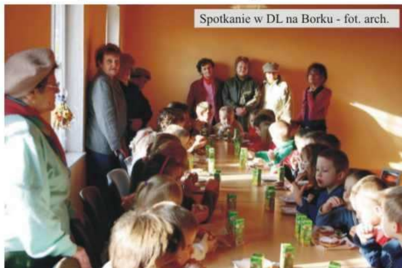
Spotkanie w DL na Borku

Były opowieści o Turoniu, Pasterce, Wigilii, tradycjach związanych z Bożym Narodzeniem, wspólne śpiewanie kolęd... Dzieci z Przedszkola Samorządowego w Jedliczu odwiedziły w dniu 16 stycznia br. Panie z Osiedlowego Koła Kobiet Dzielnicy Borek.