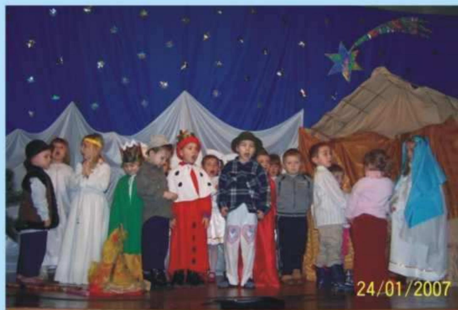
Jaselka w Gminnym Ośrodku Kultury w Jedliczu