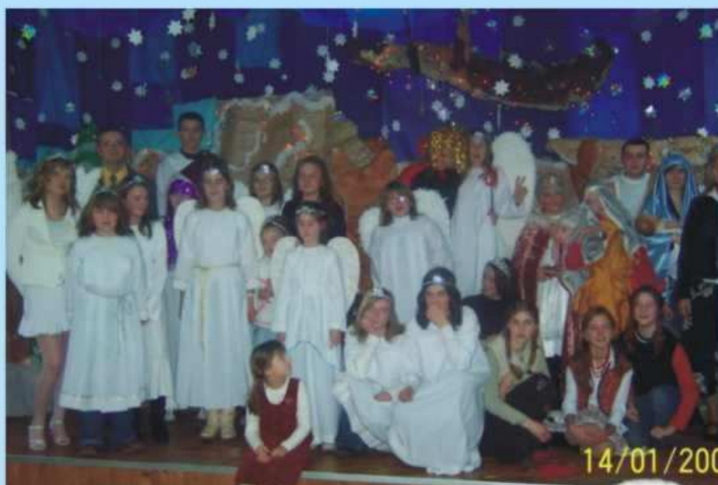
Jaselka w Jaszczwi