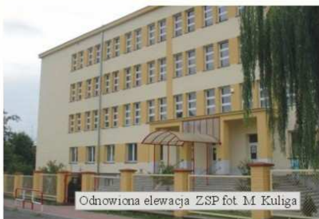
Odnowiona elewacja ZSP

Na ukończeniu są prace remontowe przy elewacji budynku Zespołu Szkół Publicznych w Jedliczu oraz hydroizolacji pionowej ścian piwnic.