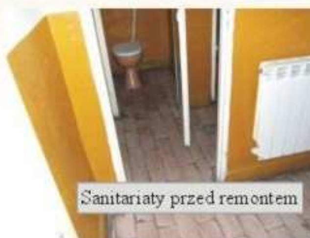
Sanitariaty przed remontem

robót wyniósł 50 tys. zł. Ponadto zostały odmalowane pomieszczenia gospodarcze, sala taneczna i jedna ściana zewnętrzna. Koszty robocizny pokryła Rada Sołecka oraz Koło Gospodyń Wiejskich, koszty materiałów pokryte zostały ze środków budżetu gminy.