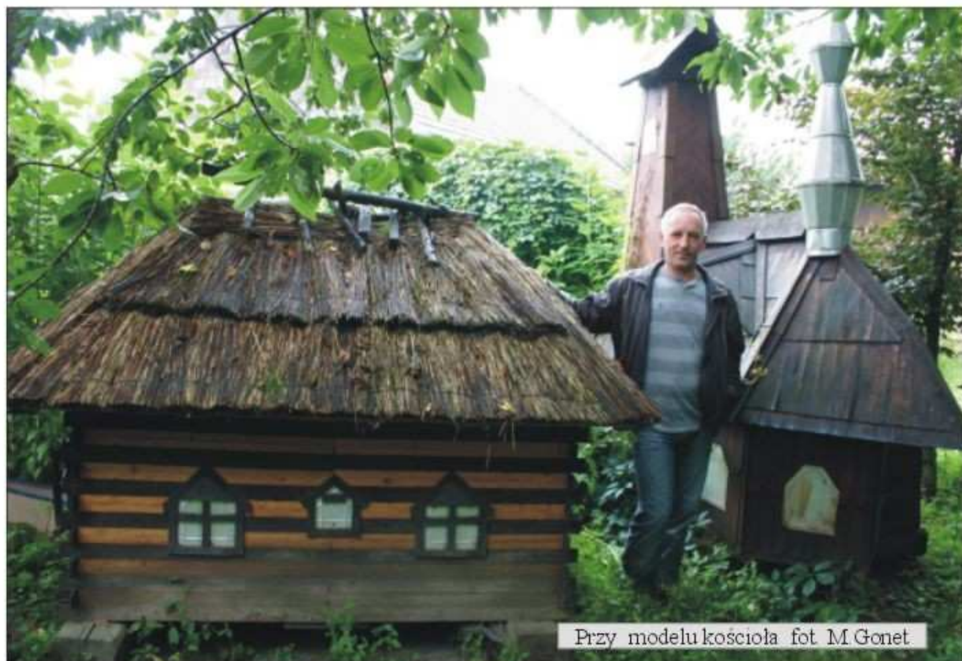
Przy modelu kościoła