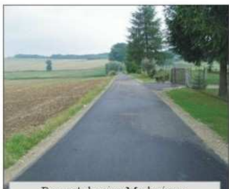
Remont drogi w Moderówce Winnica do ul. Naftowej wartość 100.076,60 zł, długość 530m