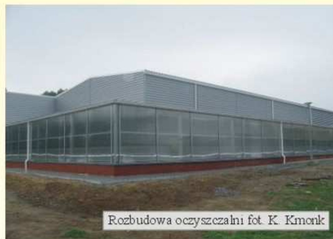
Rozbudowa oczyszczalni

W sierpniu br. wykonano poszycie laguny hydroponicznej z płyt poliwęglanowych. Obecnie trwają dalsze prace budowlane w lagunie i reaktorze biologicznym. Trwają prace wykończeniowe i przygotowawcze