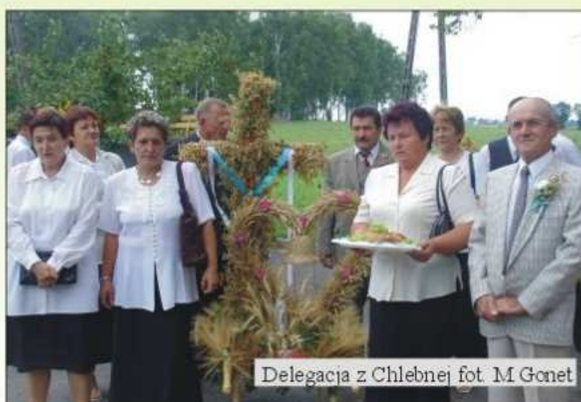
Delegacja z Chlebnej

Wieniec z Długiego przedstawiający stół z krzyżem przyciągał wzrok czystą formą i spójną dekoracją podobnie