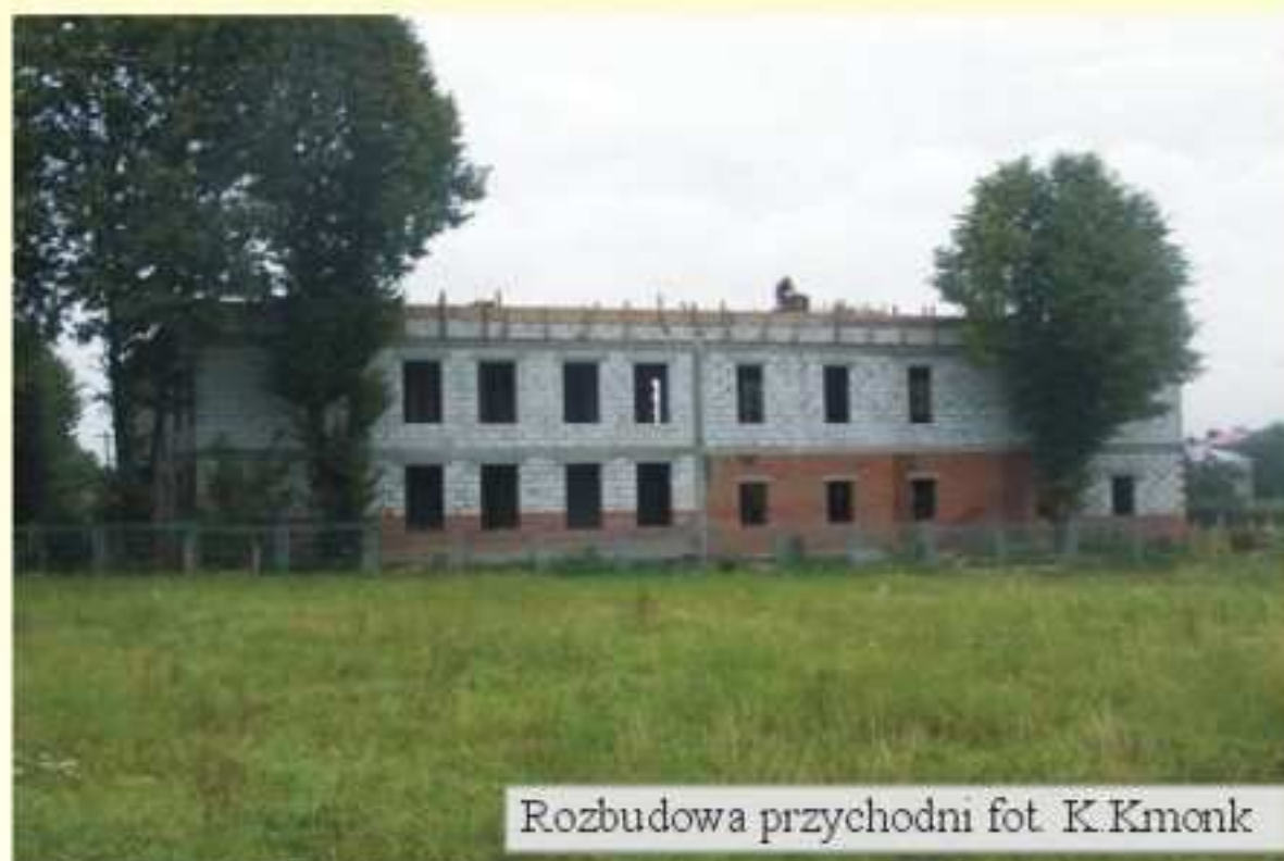
Rozbudowa przychodni

Ukończone zostały ściany kondygnacji „parter” i „I piętro”. Obecnie wykonywany jest strop nad piętem. Trwają prace przygotowawcze przy budowie dachu, w najbliższym czasie