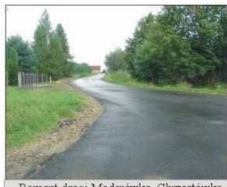
Remont drogi Moderówka Chrzastówka długość 158,5mb wartość 20 tys zł zadanie zrealizowane wspólnie z gminą Jasło