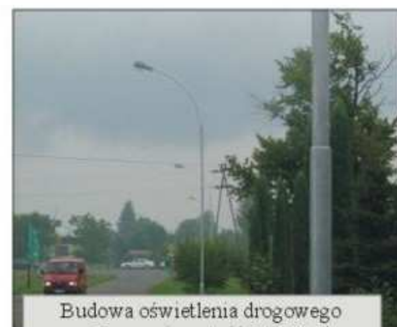
Budowa oświetlenia drogowego w Jaszczwi wartość 24.000 zł - 4 lampy uliczne