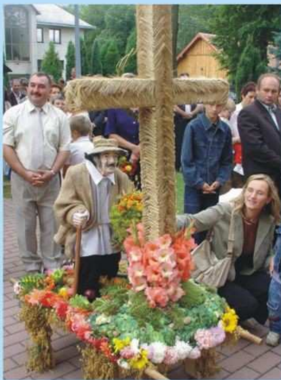
Kolo Gospodyń Wiejskich i Rada Solecka w Porębach