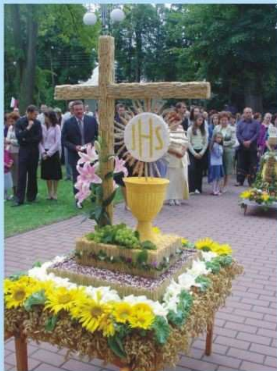
Kolo Gospodyń Wiejskich z Długiego

Wieńce z poszczególnych miejscowości przygotowali: