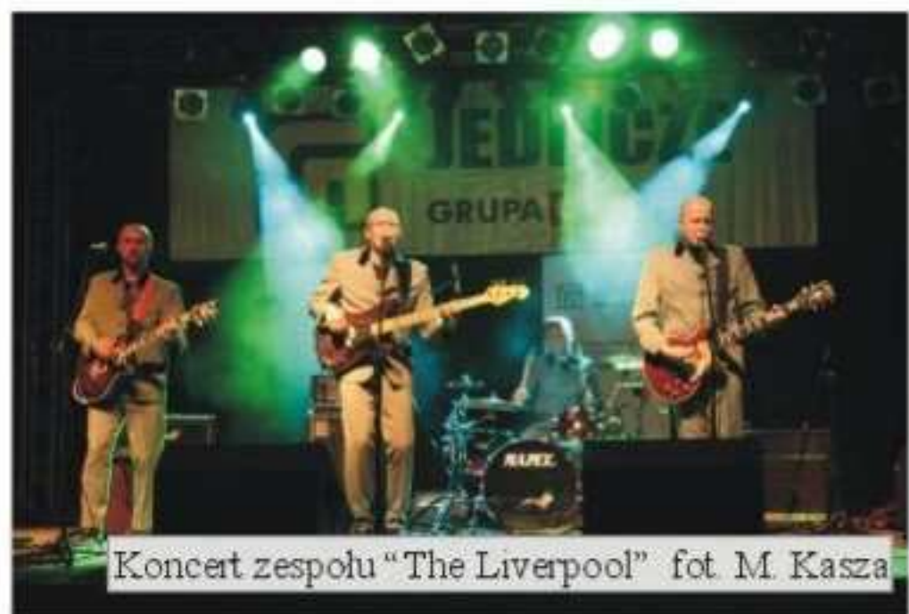
Koncert zespołu „The Liverpool”