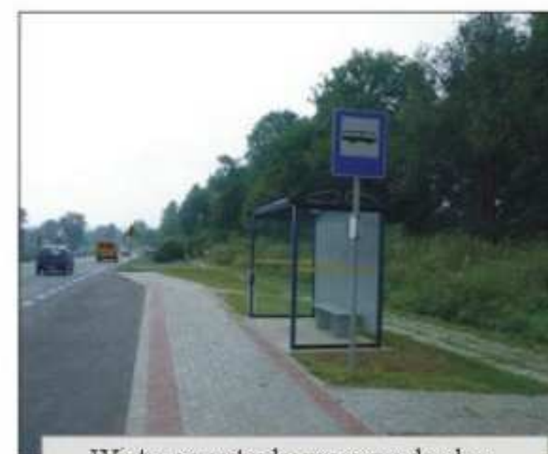
Wiaty przystankowe przy drodze krajowej 3 sztuki (Moderówka 2 szt., Potok 1 szt.)