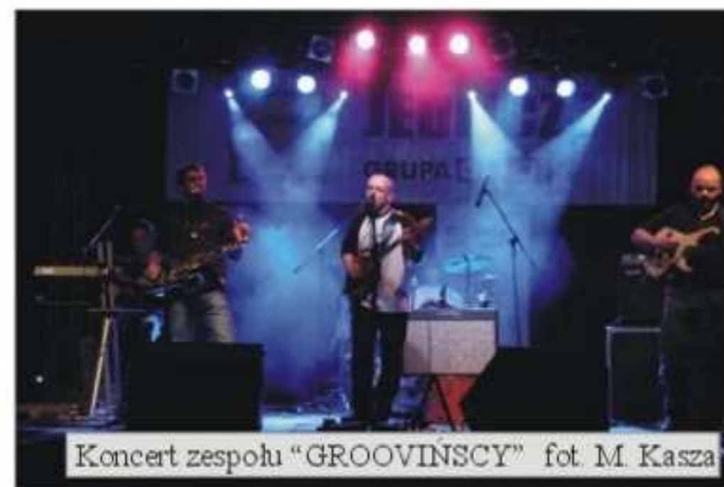
Koncert zespołu „GROOVINSCY”

Po raz pierwszy ta impreza odbyła się przy obiekcie Gminnego Ośrodka Sportu i Rekreacji w Jedliczu. Lokalizacja Jarmarku sprawdziła się, po za tym, że brak asfaltu