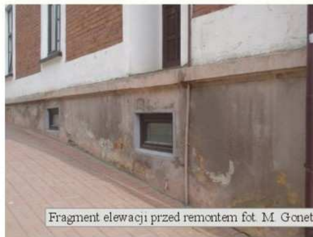
Fragment elewacji przed remontem

Zakończył się remont budynku administracyjnego przy ul. Rynek 5 w Jedliczu. Prace obejmowały uzupełnienie ścian o okładzinę z kamienia naturalnego, odbicie tynków zewnętrznych dolnej części budynku i wykonanie nowych, wzmocnienie tynku elewacyjnego zaprawą klejową, zbrojoną siatką oraz wyprawą tynkarską i zabezpieczenie, poprzez