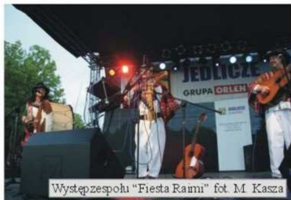
Występ zespołu „Fiesta Raimi”

Duże zainteresowanie szczególnie wśród młodzieży wywołał zespół „The Liverpool”, który największymi przebojami polskiej i zagranicznej muzyki rockowej rozgrzał publiczność. Zespół śpiewał m.in. przeboje grupy The Beatles.