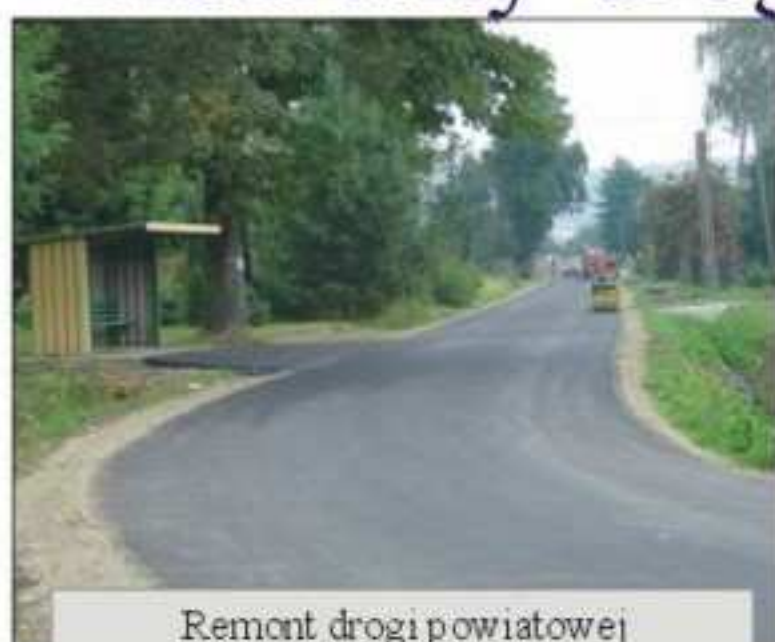
Remont drogi powiatowej Jedlicze - Długie - Zamowiec wartość 270.000 zł