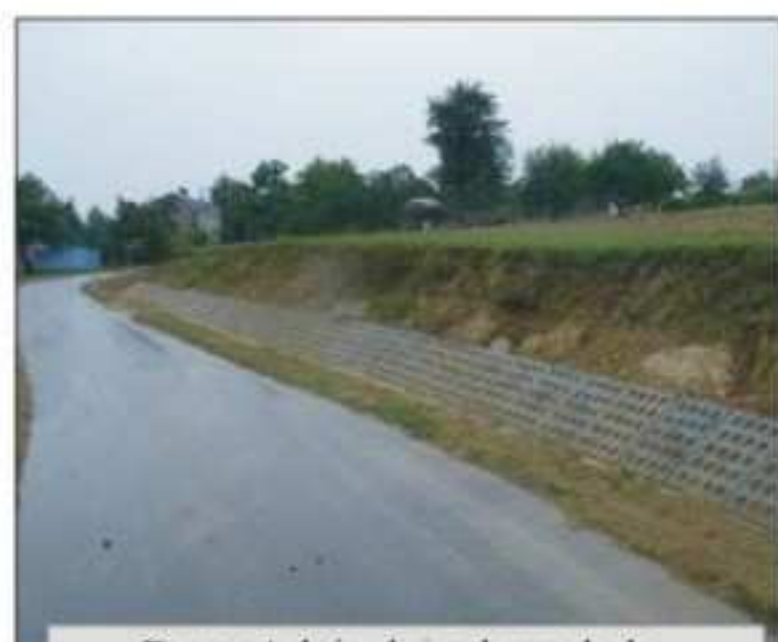
Remont dróg dojazdowych do gruntów rolnych w miejscowości Piotrowka wartość zadania 57.516,25zł