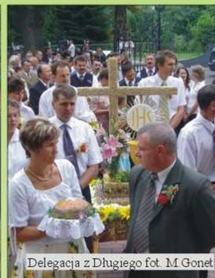
Delegacja z Długiego

była odrobina duszy i serca włożona przez pracujących nad nimi. Ważnym jest, że w pracach przy wieńcach brały udział dzieci i młodzież. Swoją obecnością wniosły radość a nas wszystkich