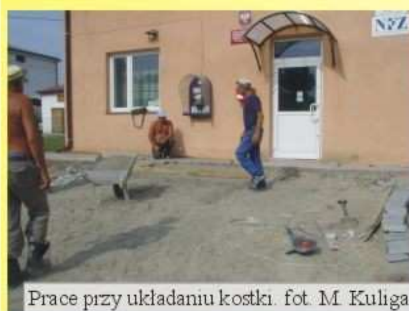
Prace przy układaniu kostki.

Przed Ośrodkiem Zdrowia w Jeszczy została położona kostka brukowa. Odnowione zostało również ogrodzenie wokół Ośrodka. Koszt robót został pokryty ze środków SPG ZOZ w Jedliczu.