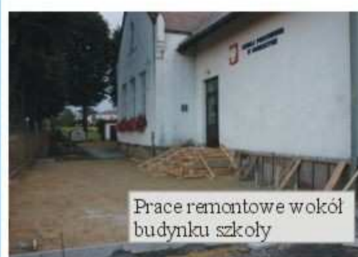
Prace remontowe wokół budynku szkoły

Na ukończeniu są prace remontowe wokół budynku Szkoły Podstawowej w Dobieszynie. Zakres prac obejmuje wykonanie nawierzchni z kostki brukowej na powierzchni 130 m 2 wraz z podbudową, remont kapitalny schodów wejściowych i obłożenie płytkami oraz częściowy remont cokołu elewacji budynku. Prace remontowe wykonuje Jedlickie Przedsiębiorstwo Gospodarki Komunalnej i Mieszkaniowej w Jedliczu. Koszt robót wyniesie 12.993,89 zł