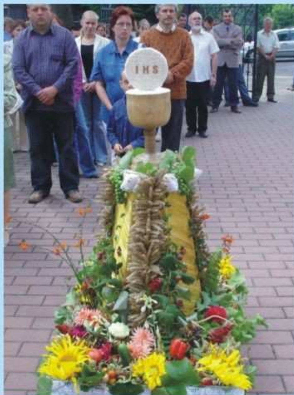
Kolo Gospodyń Wiejskich i Zarząd Osiedla Jedlicze - Męcinka