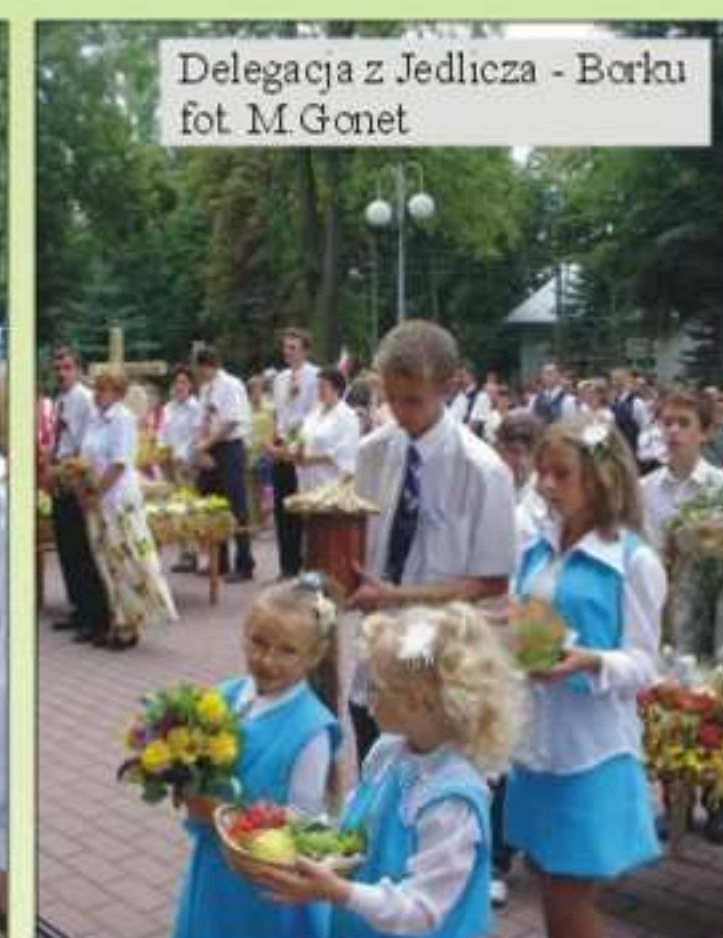
Delegacja z Jedlicza - Borku

cieszy, że już od najmłodszych lat uczą się one tej pięknej tradycji. Do Kościoła przynieśli w darze miód, chleb, ziola i owoce.