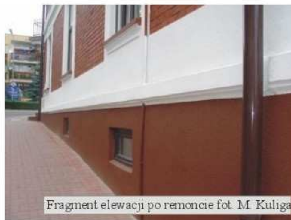
Fragment elewacji po remoncie