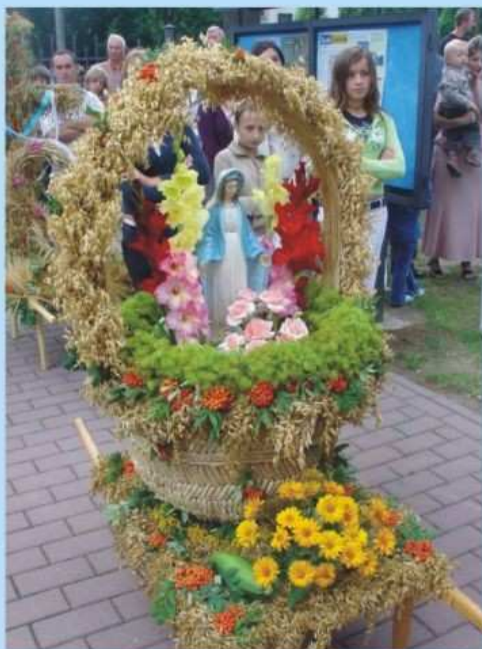
Młodzież ze Świątlicy opiekuńczo - wychowawczej w Chlebnej