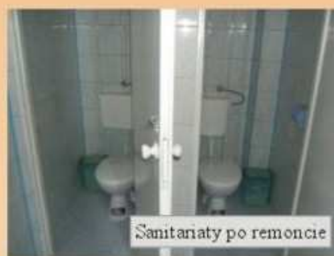
Sanitariaty po remoncie

Wokół budynku Domu Ludowego w Porębach wykonano kostkę odbojową i taras z kolorowej kostki brukowej. Wykonano również remont nawierzchni placu wokół DL, położono nawierzchnię z masy mineralno-bitumicznej. Łączna wartość robót wyniosła 19.996 zł