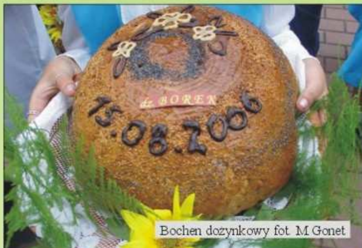
Bochen dozynkowy

Ku czci Matki Boskiej Zielnej do kościoła przywieziono 6 brogów. Koło Kobiet Dzielnicy Borek, wykonało wieńce, który przedstawiał grotę z Matką Boską do której przyszły dzieci. Emanował dziecięcą radością. Ozdoby z jarzębiny i słoneczników przyciągały wzrok i wzbudzały