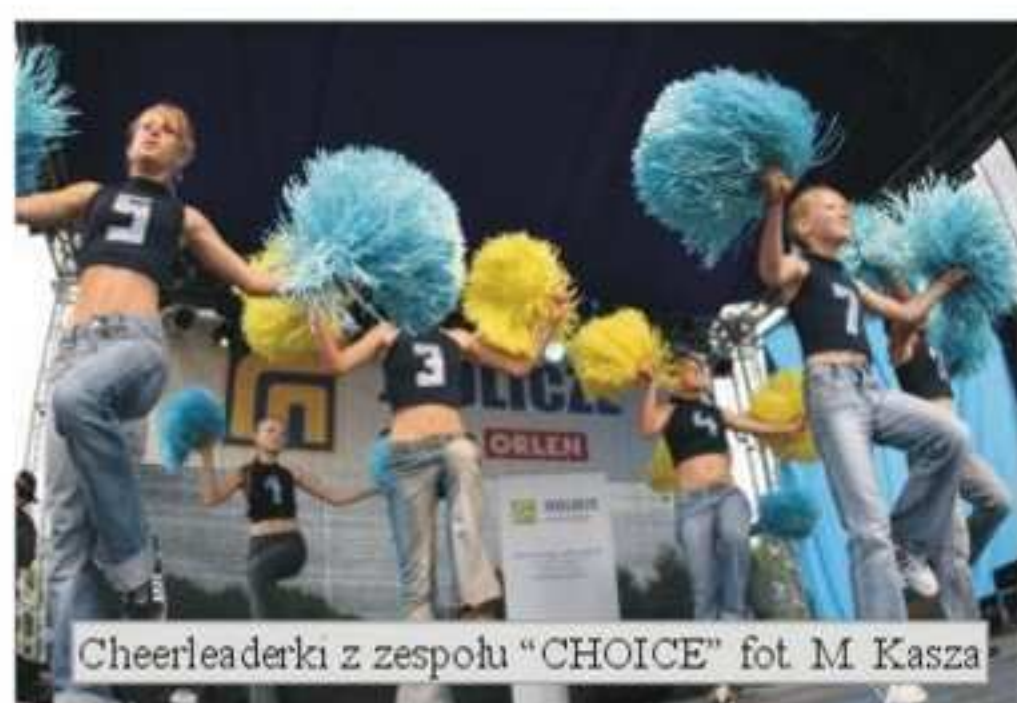
Cheerleaderki z zespołu „CHOICE”

Na scenie zaprezentowały się cheerleaderki z zespołu „CHOICE”, który działa przy Gminnym Ośrodku Sportu i Rekreacji w Jedliczu. Dziewczyny zaprezentowały się