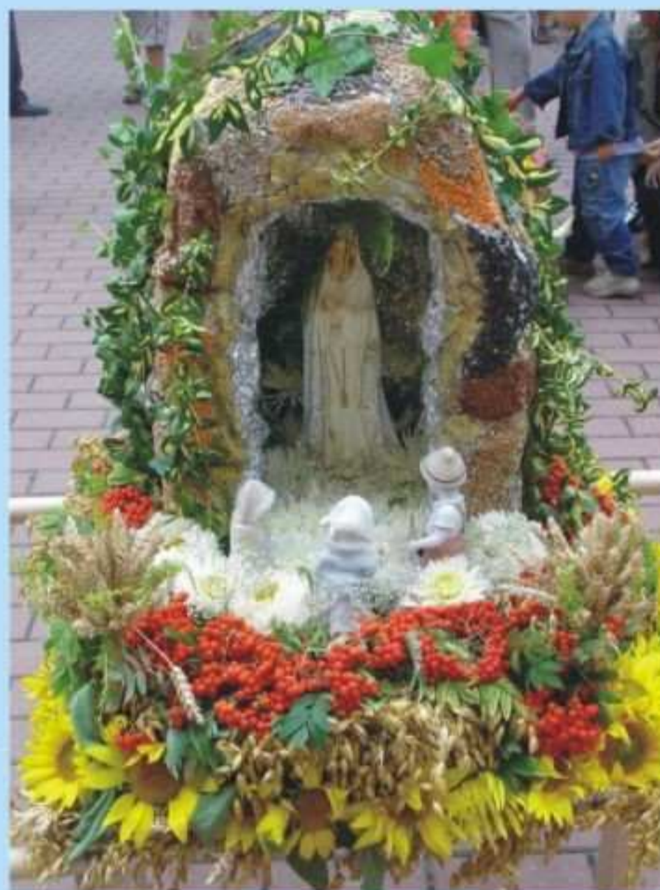
Osiedlowe Kolo Kobiet Dzielnicy Borek