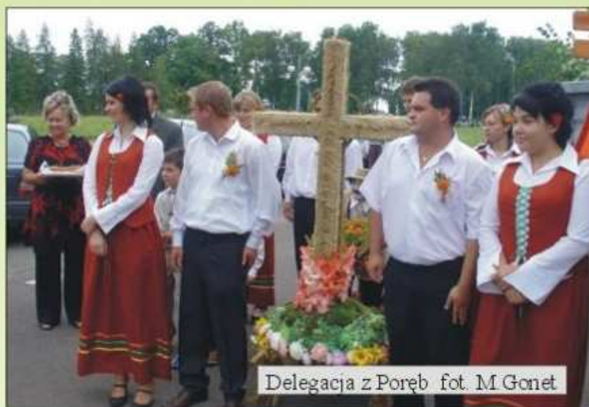
Delegacja z Poręb

wiele sympatii. Mieszkańcy Poręb przynieśli wieńce, który promieniował bogactwem formy krzyż, a pod nim spracowany rolnik oraz przepych użytych zbóż i kwiatów.