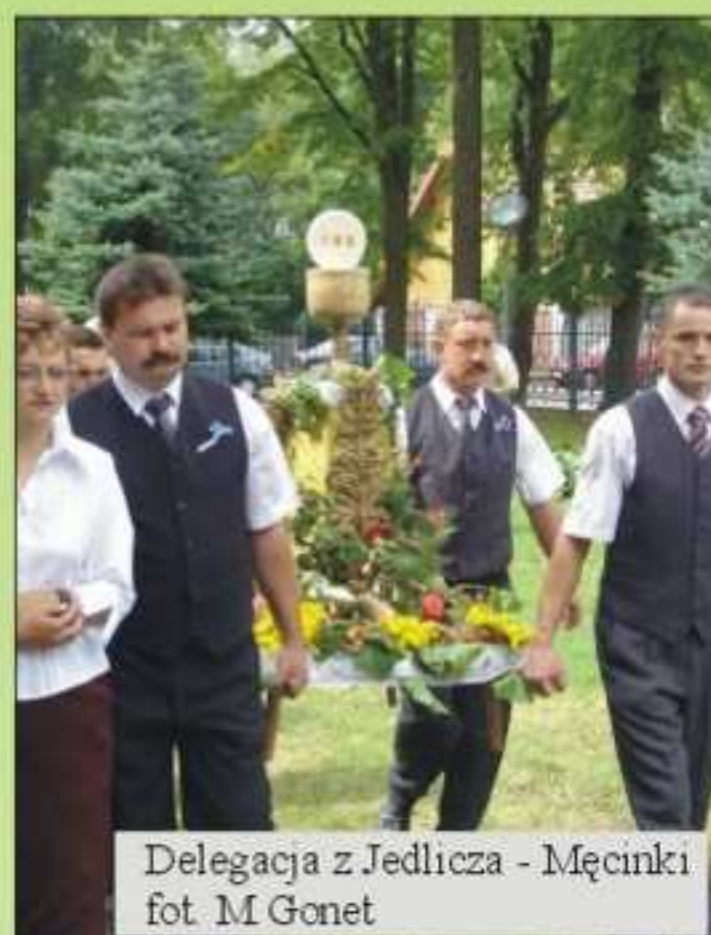
Delegacja z Jedlicza - Męcinki

Nie sposób powiedzieć, który z nich był najpiękniejszy. W każdym