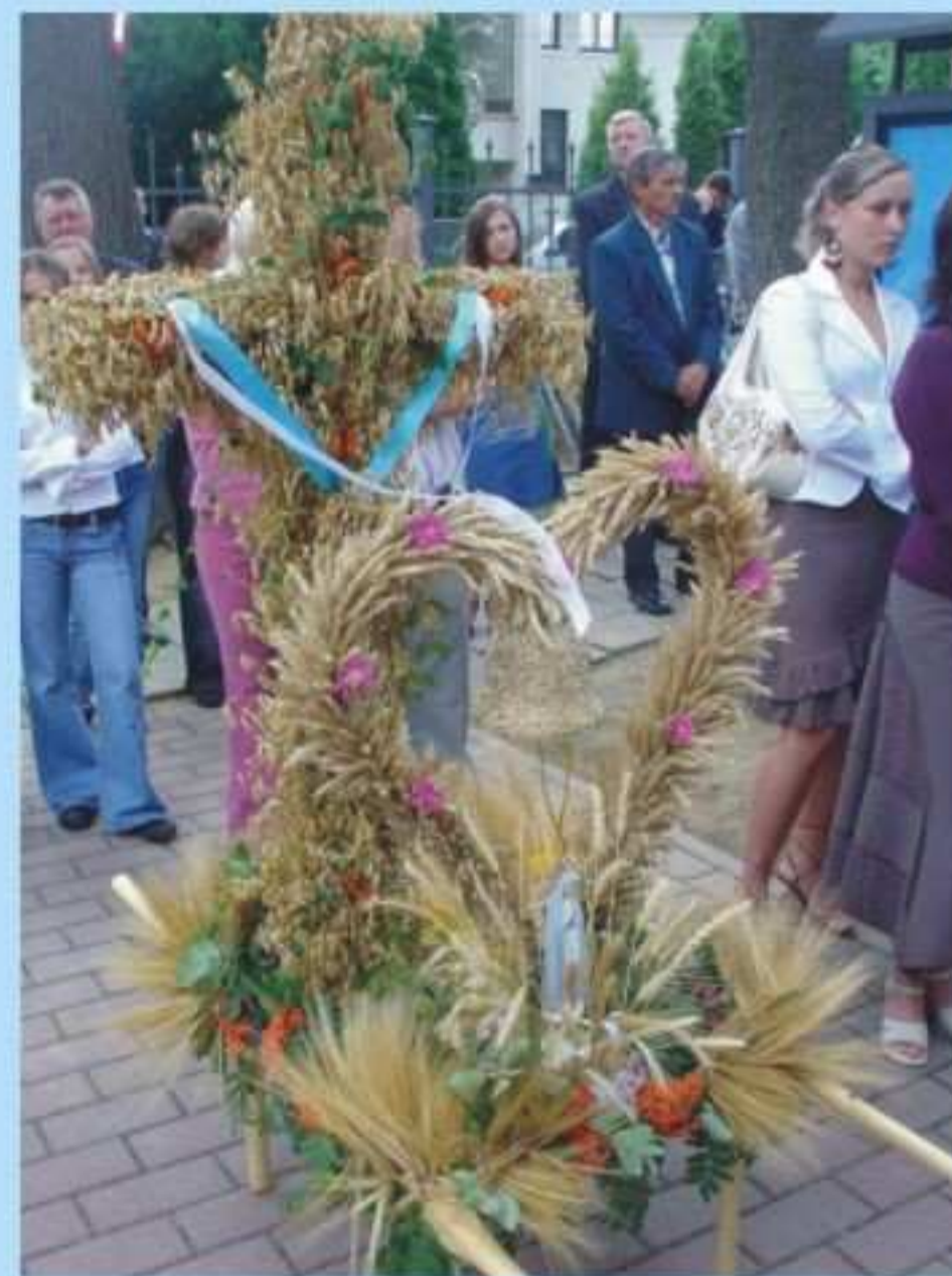
Kolo Gospodyń Wiejskich i Rada Solecka w Chlebnej