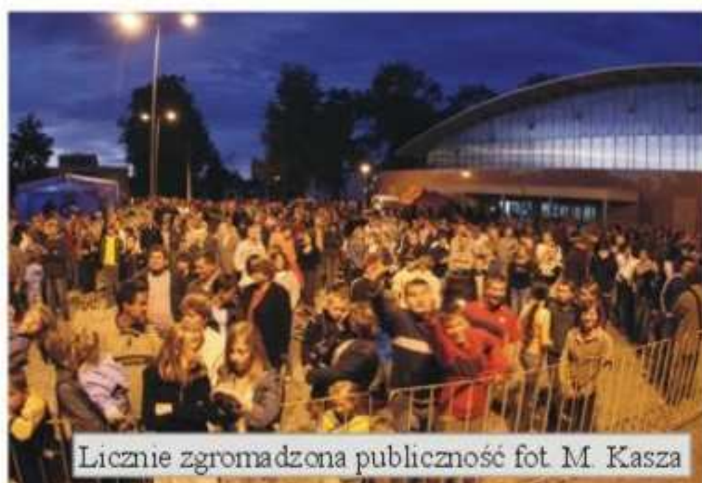
Licznie zgromadzona publiczność

Turystyczny Rajd Bieszczadzki dla dzieci z terenu gminy Jedlicze, Turniej Minitenisa Ziemię dla młodzieży, Zawody Strzeleckie, Zawody Wędkarskie czy też Bieg Uliczny o Puchar Burmistrza Gminy Jedlicze. Wszyscy uczestnicy Jarmarku znaleźli coś dla