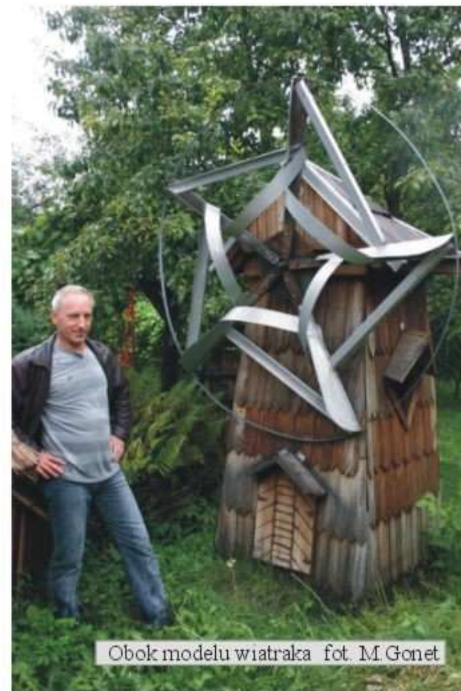
Obok modelu wiatraka

Przez rok powstało osiem budyneczków: są wśród nich: kościółek, młyn, wiatrak,