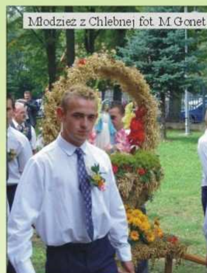
Młodzież z Chlebnej

była odrobina duszy i serca włożona przez pracujących nad nimi. Ważnym jest, że w pracach przy wieńcach brały udział dzieci i młodzież. Swoją obecnością wniosły radość a nas wszystkich