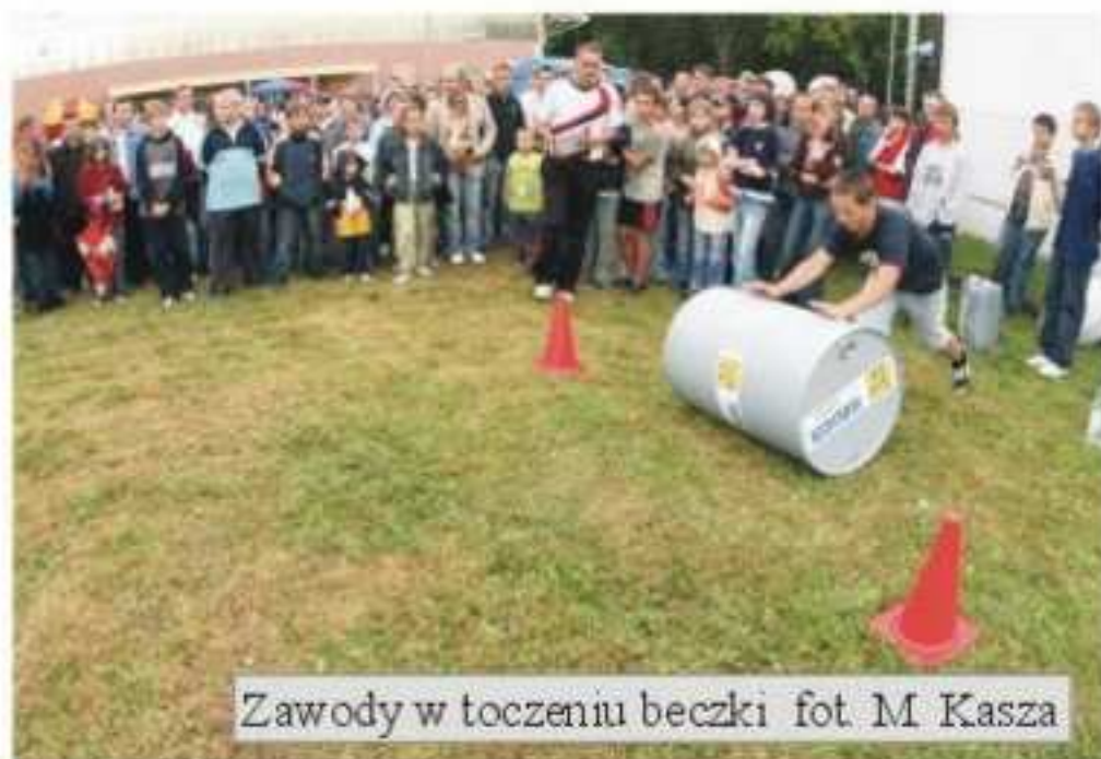
Zawody w toczeniu beczki

publiczności, którą swoim brawurowym występem rozbawił Jurij Tokar z folkim ukraińskim oraz „Fiesta Raymi” z muzyką