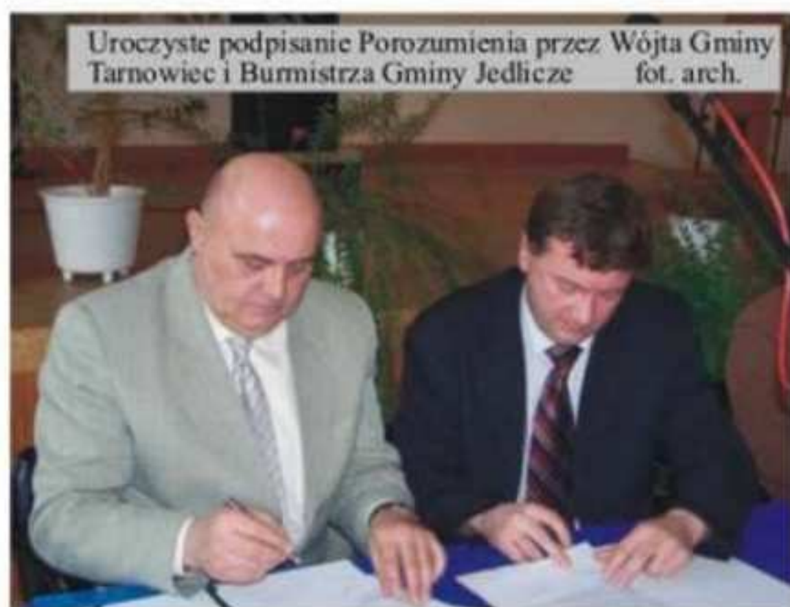
Uroczyste podpisanie Porozumienia przez Wójta Gminy Tarnowiec i Burmistrza Gminy Jedlicze