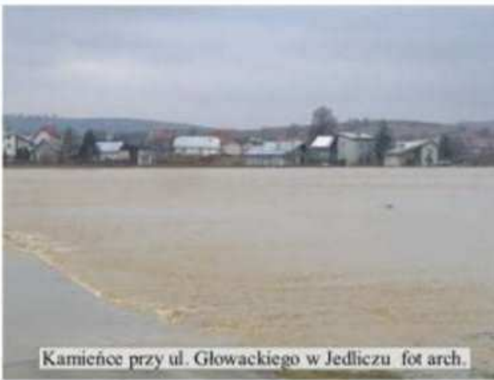
Kamieńce przy ul. Głowackiego w Jedliczu

Zadaniem organów gminy Jedlicze w zakresie przeciwdziałania powodziom jest przede wszystkim stosowanie w procesie zagospodarowywania terenu gminy norm bezpieczeństwa określonych w przepisach prawa, mających na celu zapobieganie szkodom podczas ewentualnej powodzi, a jeśli takie zagrożenie wystąpi - przeprowadzenie akcji przeciwpowodziowej.