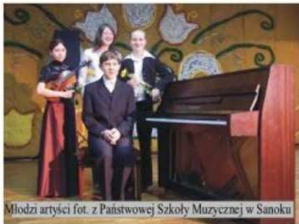
Młodzi artyści fot. z Państwowej Szkoły Muzycznej w Sanoku