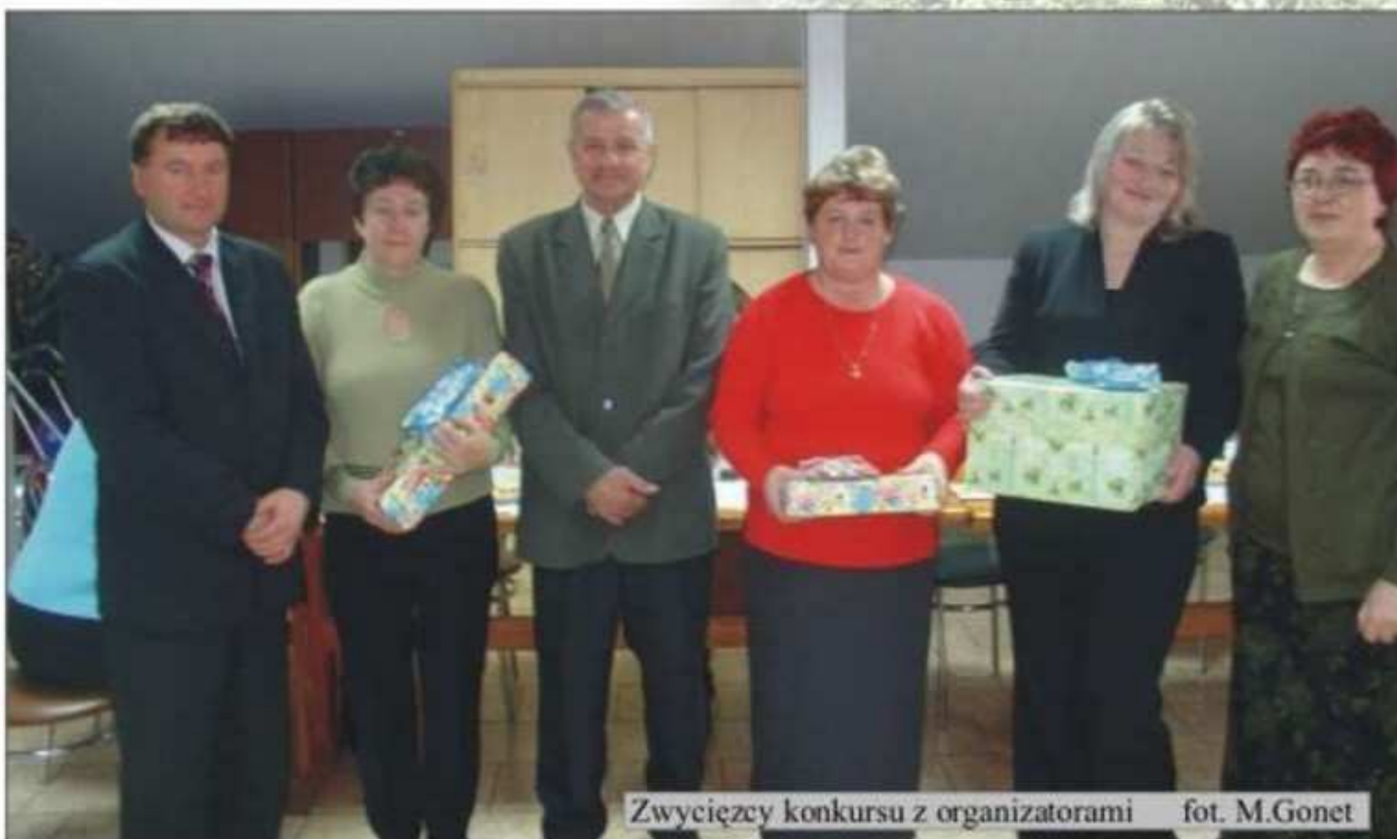
Zwycięzcy konkursu z organizatorami