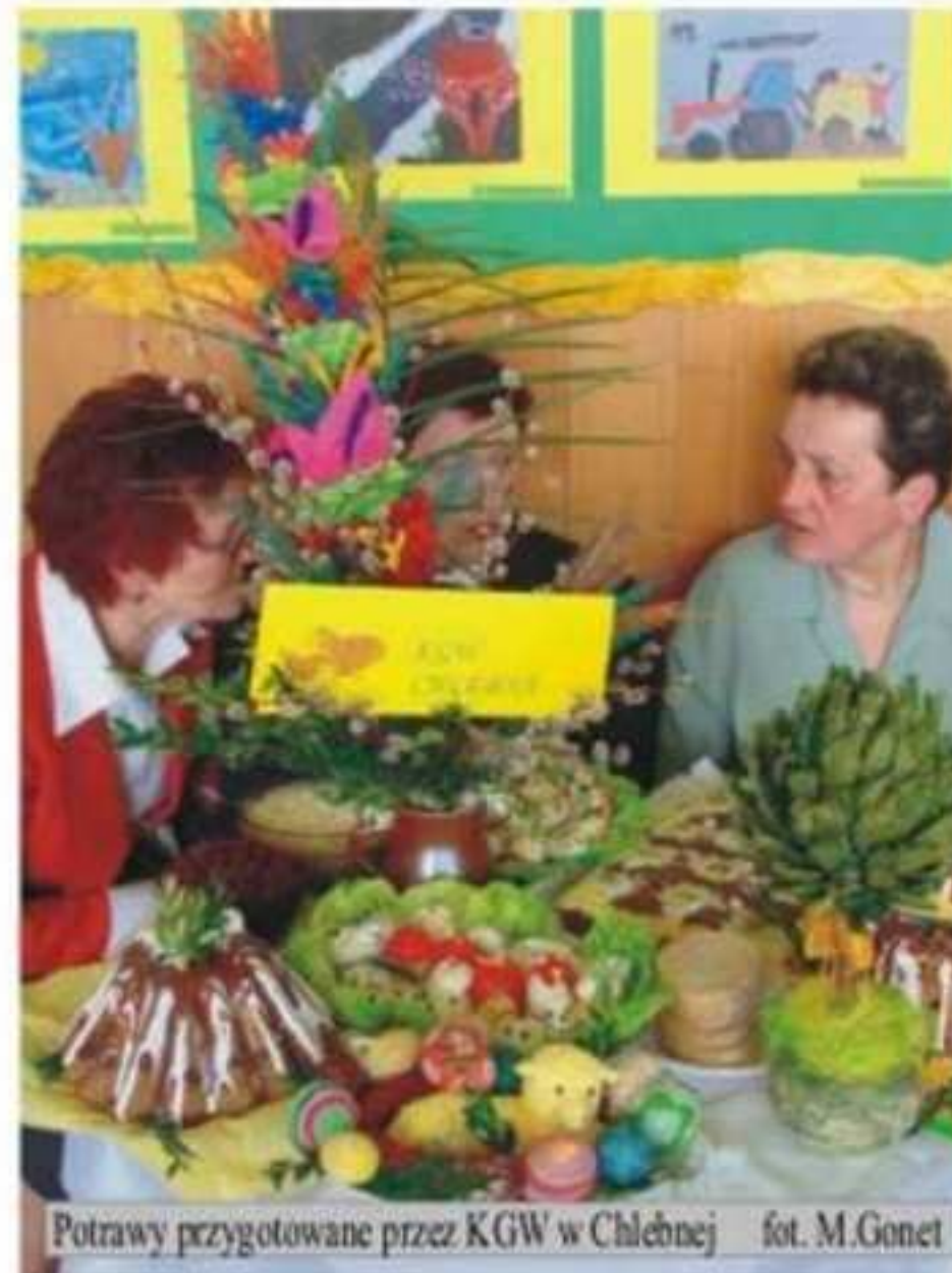
Potrawy przygotowane przez KGW w Chlebnej