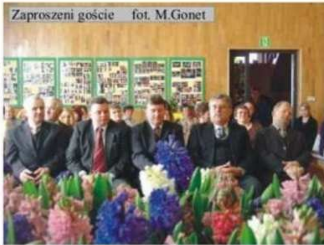
Zaproszeni goście

Corocznym zwyczajem prezentowania tradycyjnych potraw wielkanocnych wszystkie Koła Gospodyń Wiejskich z gminy Jedlicze w sobotę, przed Niedzielą Palmową, skorzystały