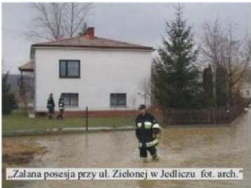
„Zalana posesja przy ul. Zielonej w Jedliczu”

Burmistrzowi Gminy Jedlicze, który jest odpowiedzialny za kierowanie akcją przeciwpowodziową, pozostaje często po prostu posprzątać po powodzi, nie ma on bowiem możliwości, aby odpowiednio zabezpieczyć przed zalaniem tereny gminy potencjalnie zagrożone. Ten problem dotyczy zresztą większości gmin naszego regionu, przez które przepływają cieków wodne o charakterze górskim.