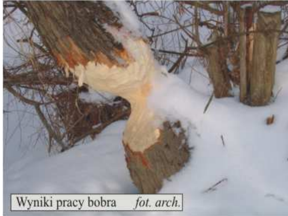
Wyniki pracy bobra

cm, ogona 30-35 cm, waga 18-30 kg. Masywna budowa ciała; futro bardzo gęste, od szaro - do czarnobrunatnego; ogon spłaszczony, pokryty łuskami, uszy i oczy