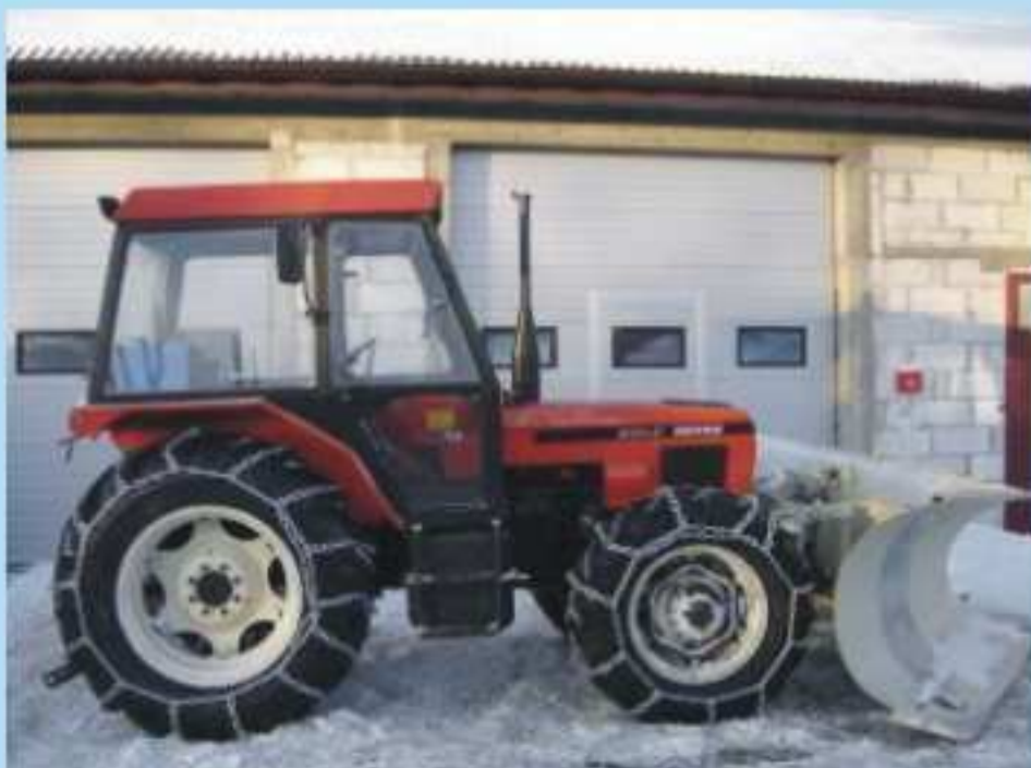
Zetor 6340 z pługiem stalowym