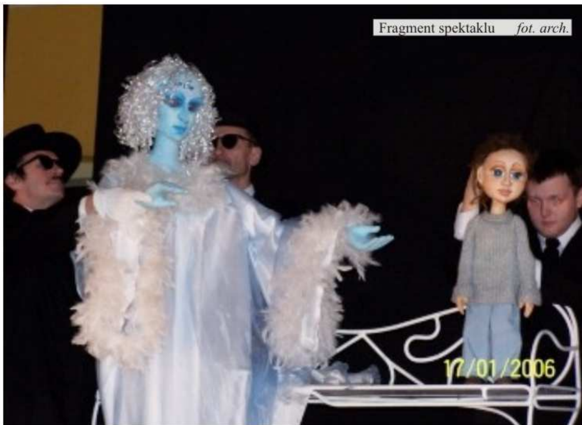
Fragment spektaklu

3 lutego br. dzieci wzięły udział w przedstawieniu w jedlickim GOK-u.