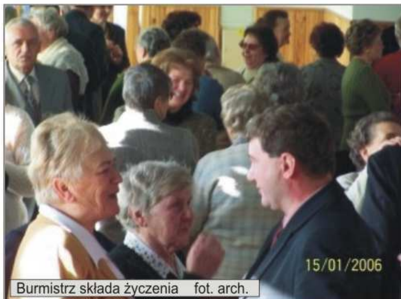
Burmistrz składa życzenia 15/01/2006