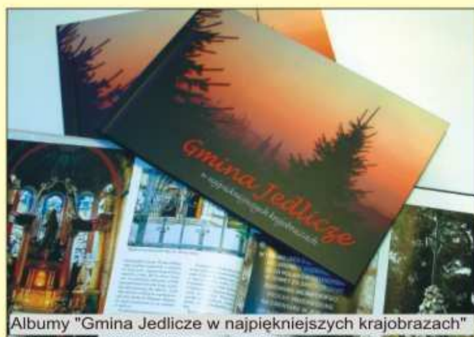
Albumy "Gmina Jedlicze w najpiękniejszych krajobrazach"