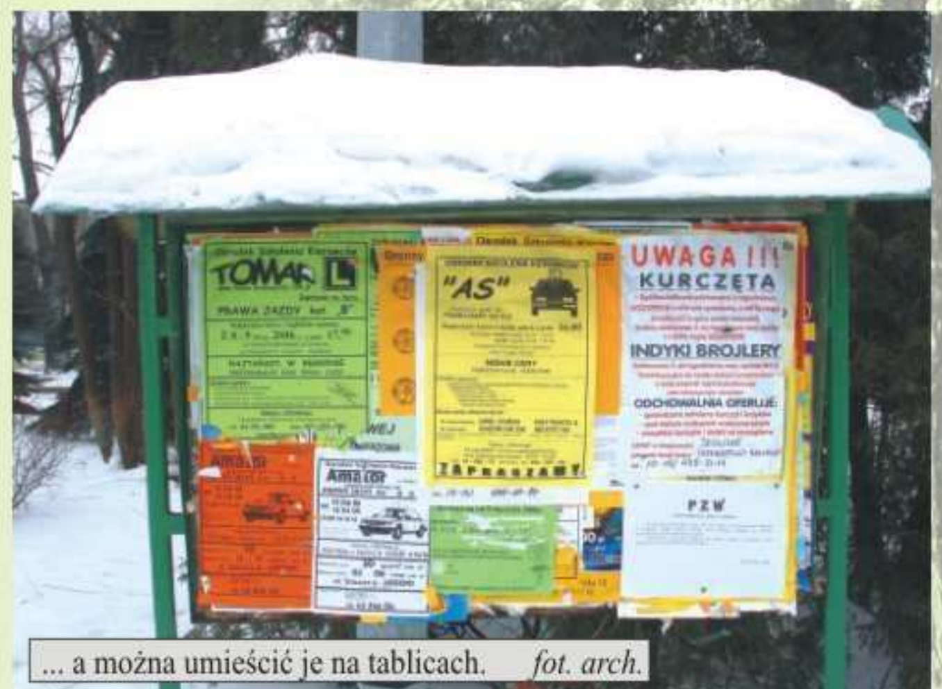
... a można umieścić je na tablicach.