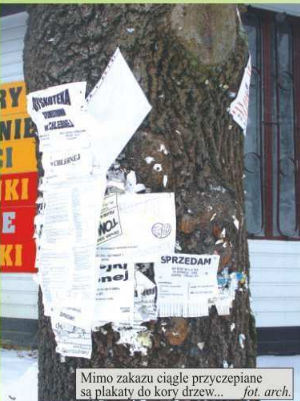
Mimo zakazu ciągle przyczepiane są plakaty do kory drzew...

Pomijając kwestie estetyki, działania takie wyrządzają drzewom szkodę. Musimy uświadomić sobie, iż drzewo nie jest miejscem na rozwieszanie plakatów, gdyż