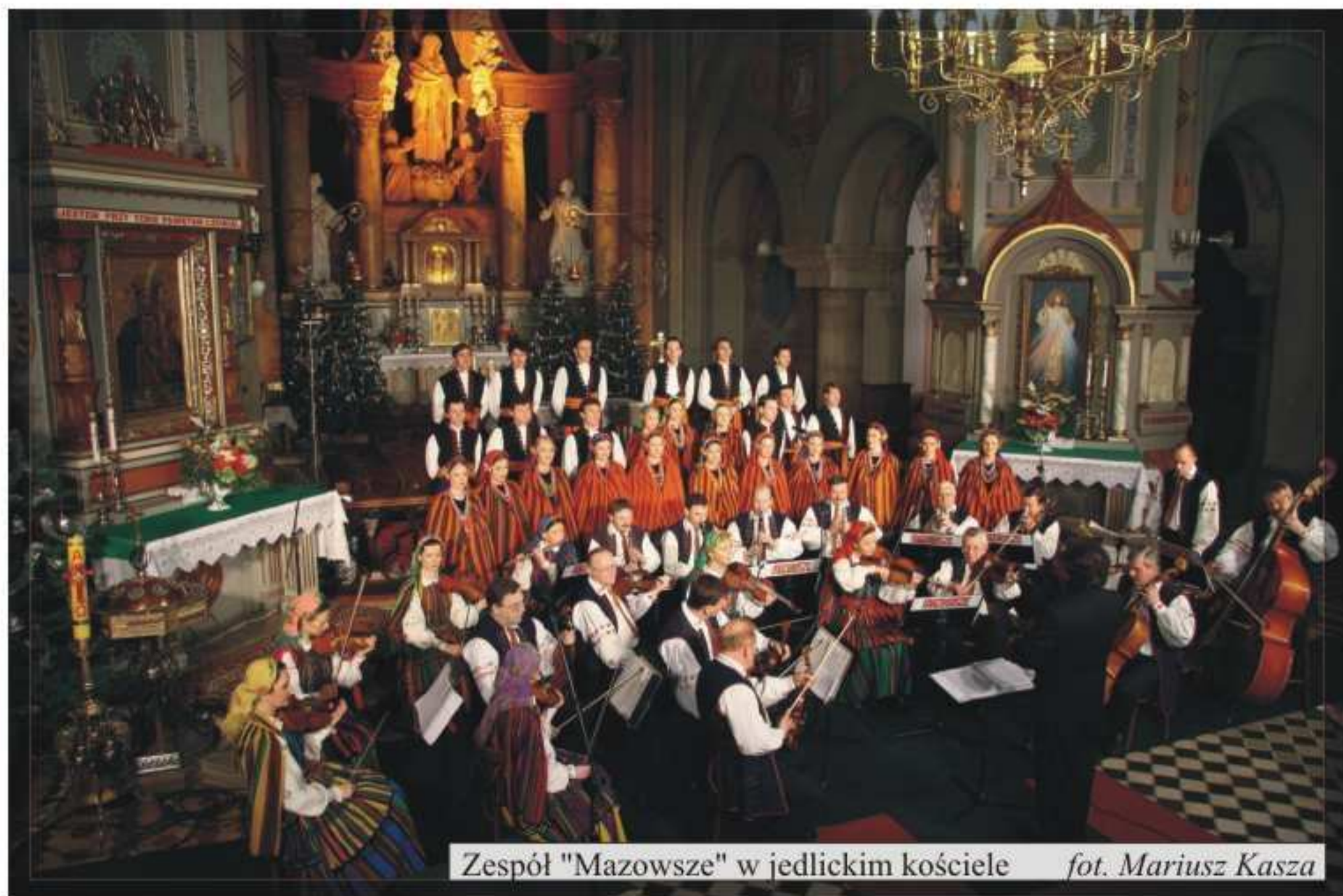
Zespół "Mazowsze" w jedlickim kościele