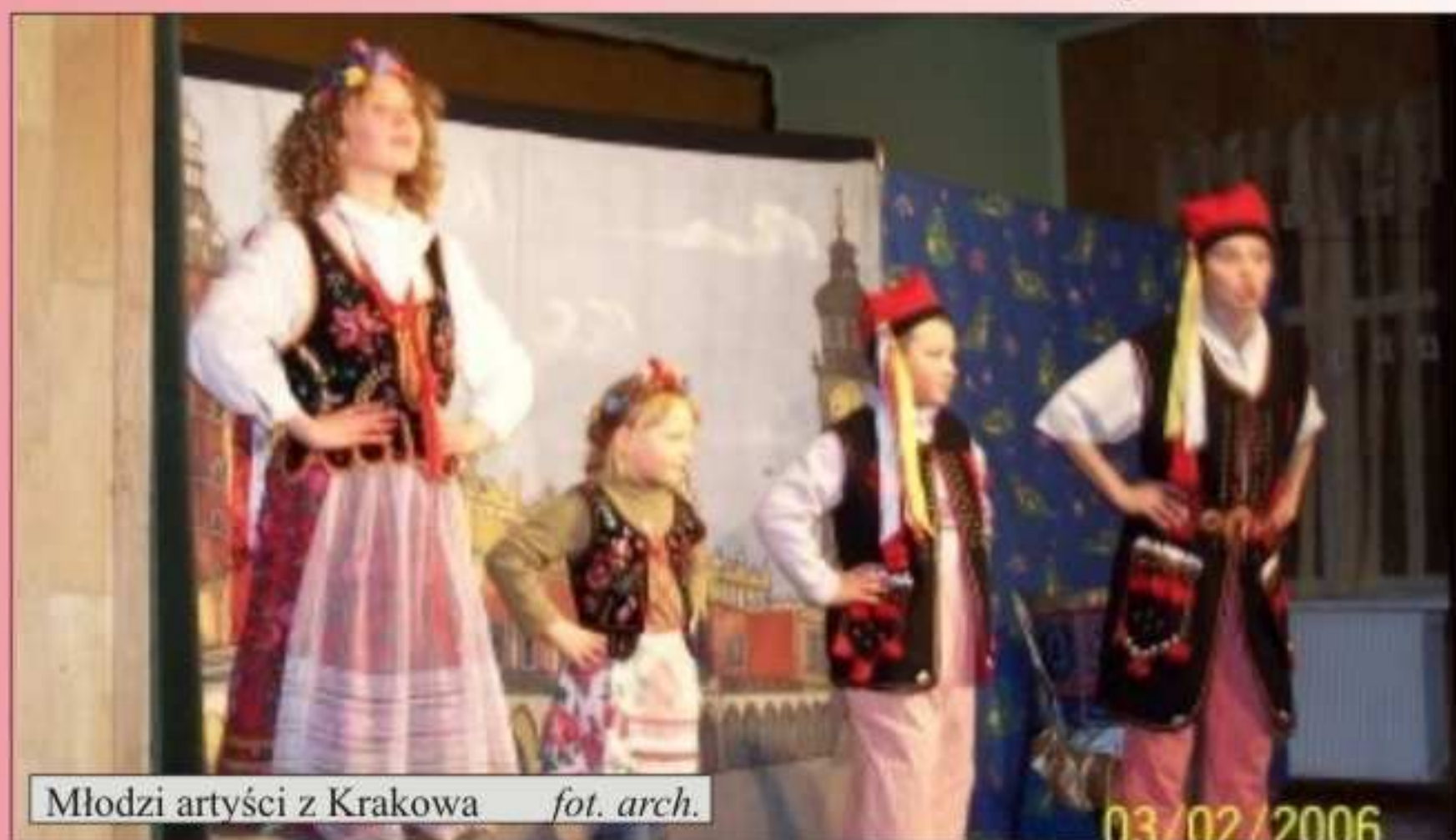
Młodzi artyści z Krakowa