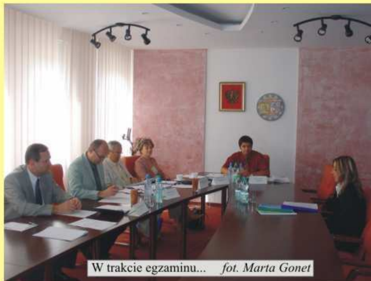
W trakcie egzaminu...

dziewięciu przystępujących do egzaminu nauczycieli aż 7 uzyskało najwyższą notę 10/10 punktów - powiedział Marek Świdrak, Przewodniczący Komisji. Na szczególną uwagę zasługuje bardzo bogaty warsztat pracy wszystkich przystępujących do egzaminu. Nauczyciele nie ograniczają się tylko do samodoskonalenia, ale aktywnie uczestniczą w realizacji zadań ogólnoszkolnych. Potrafią wykorzystać znajomość prawa oświatowego do rozwiązywania problemów uczniów -