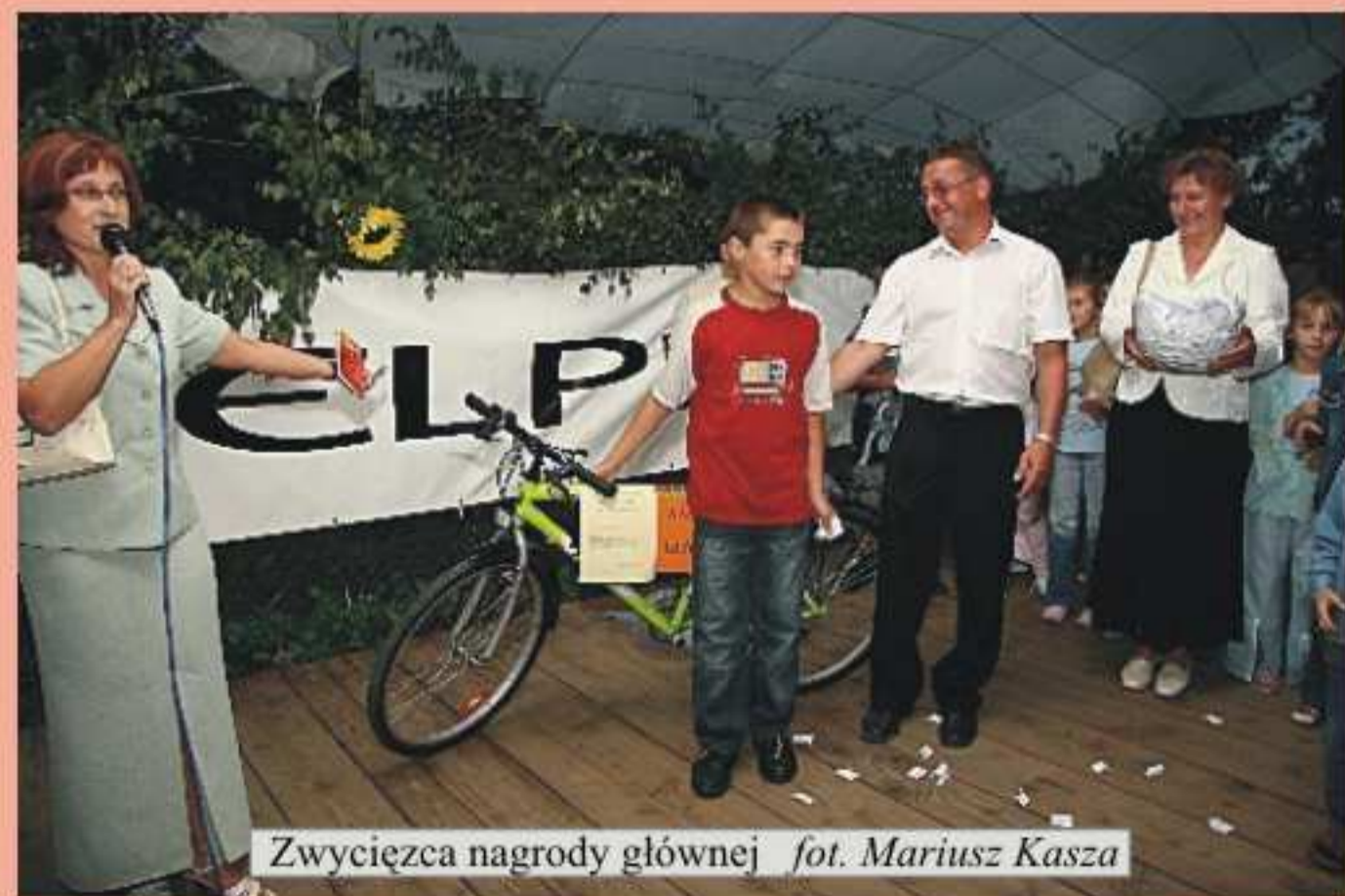
Zwycięzca nagrody głównej