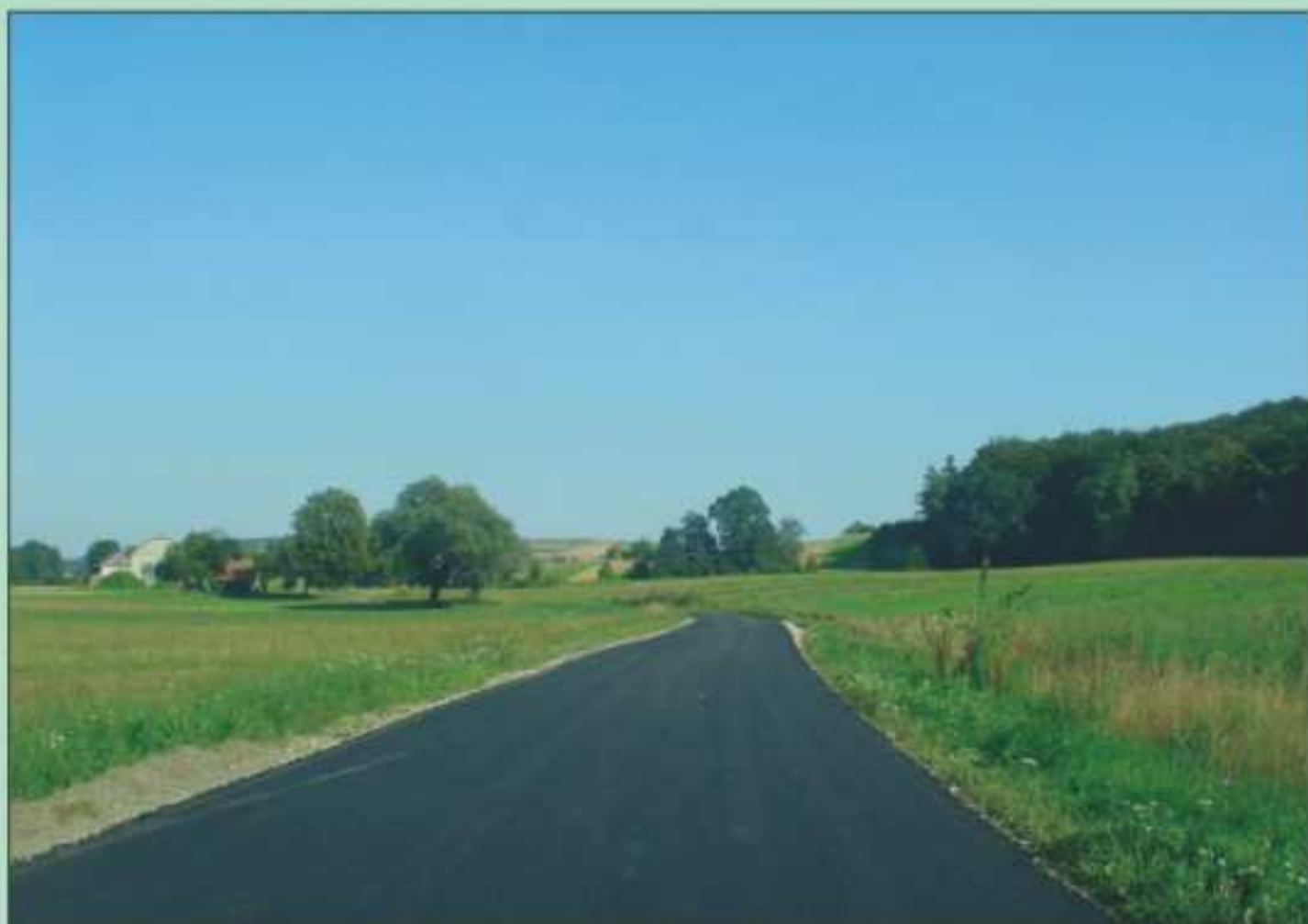
Nowa nawierzchnia drogi w Piotrówce - Budy, wykonana wraz ze Starostwem Powiatowym w Krośnie