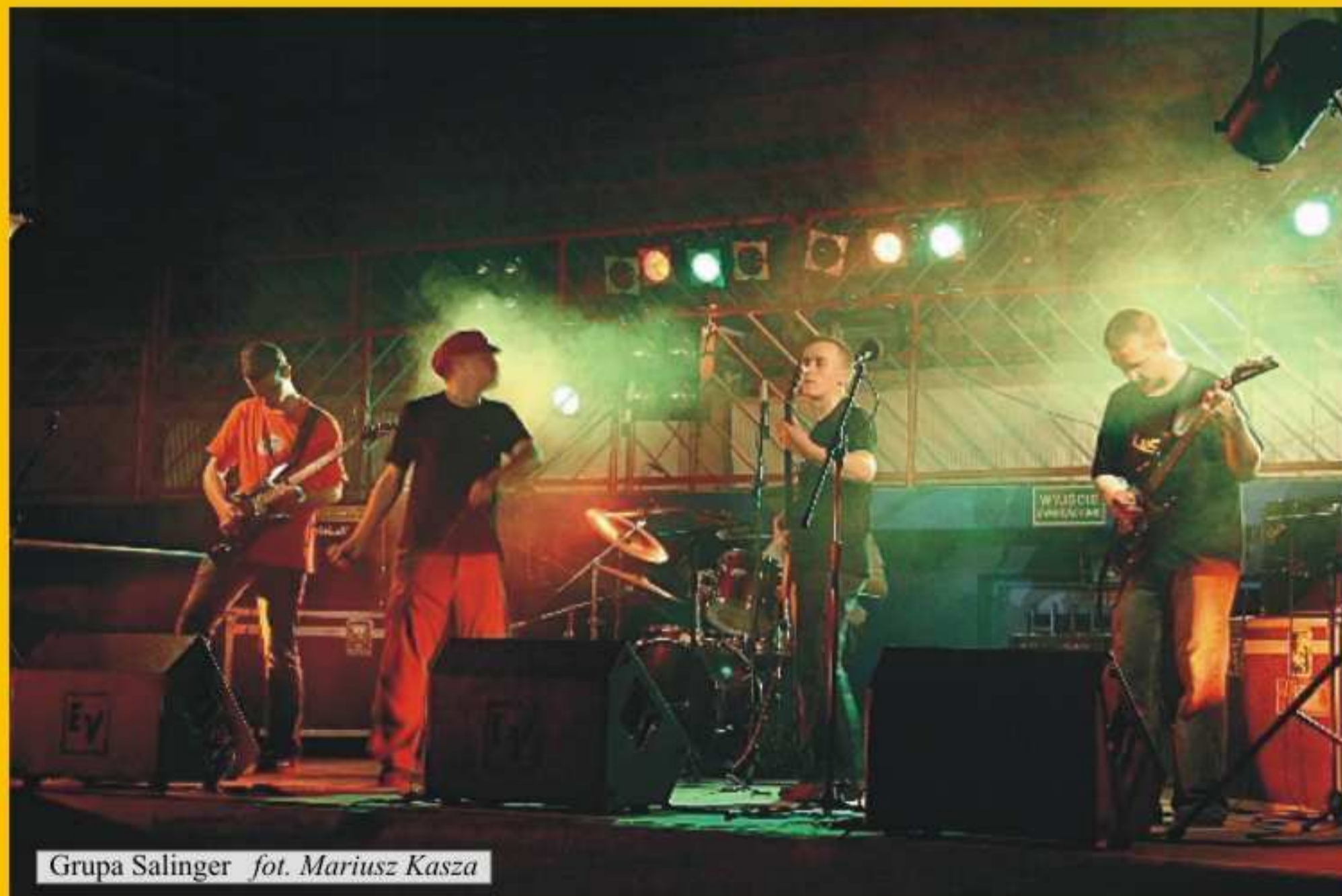
Grupa Salinger