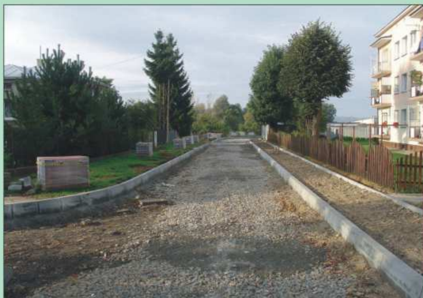
Budowa drogi w stronę Kładki w dzielnicy Borek w Jedliczu.