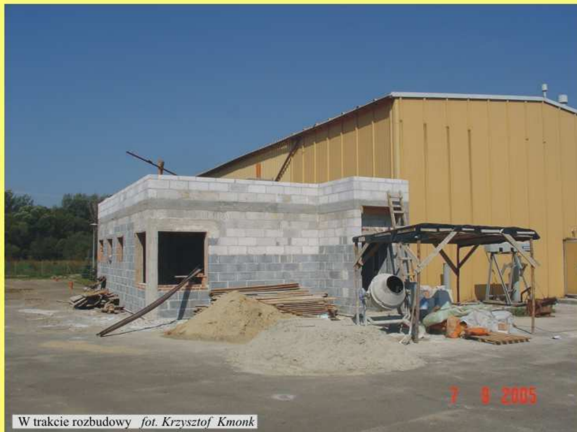
W trakcie rozbudowy