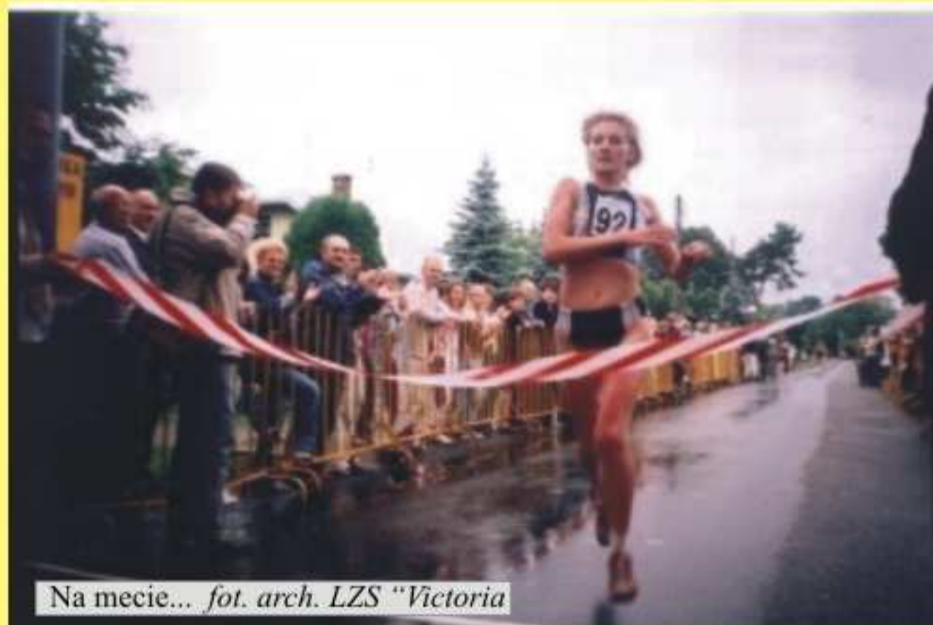
Na mecie...

Nagrody dla zwycięzców i uczestników ufundowali: Rafineria Nafty Jedlicze S.A., Jedlickie Przedsiębiorstwo Gospodarki Komunalnej i Mieszkaniowej, Gminny Ośrodek Kultury w Jedliczu, Zakład Gazowniczy Jasło, Sport-Kros, Sklep Spożywczy Wioletty i Mirosława Janochów z Dobieszyna, Krośnieńskie Huty Szkła, huty szkła: „Galicjan” w Tarnowcu, Studio Glass Krosno i Studio Glass Iwonicz, „Sabina” Rymanów, „Delta” Iwonicz, WS-POL, Nowy Styl, „Kuba-Pol”, Zakład Masarski „Kon-Bit”