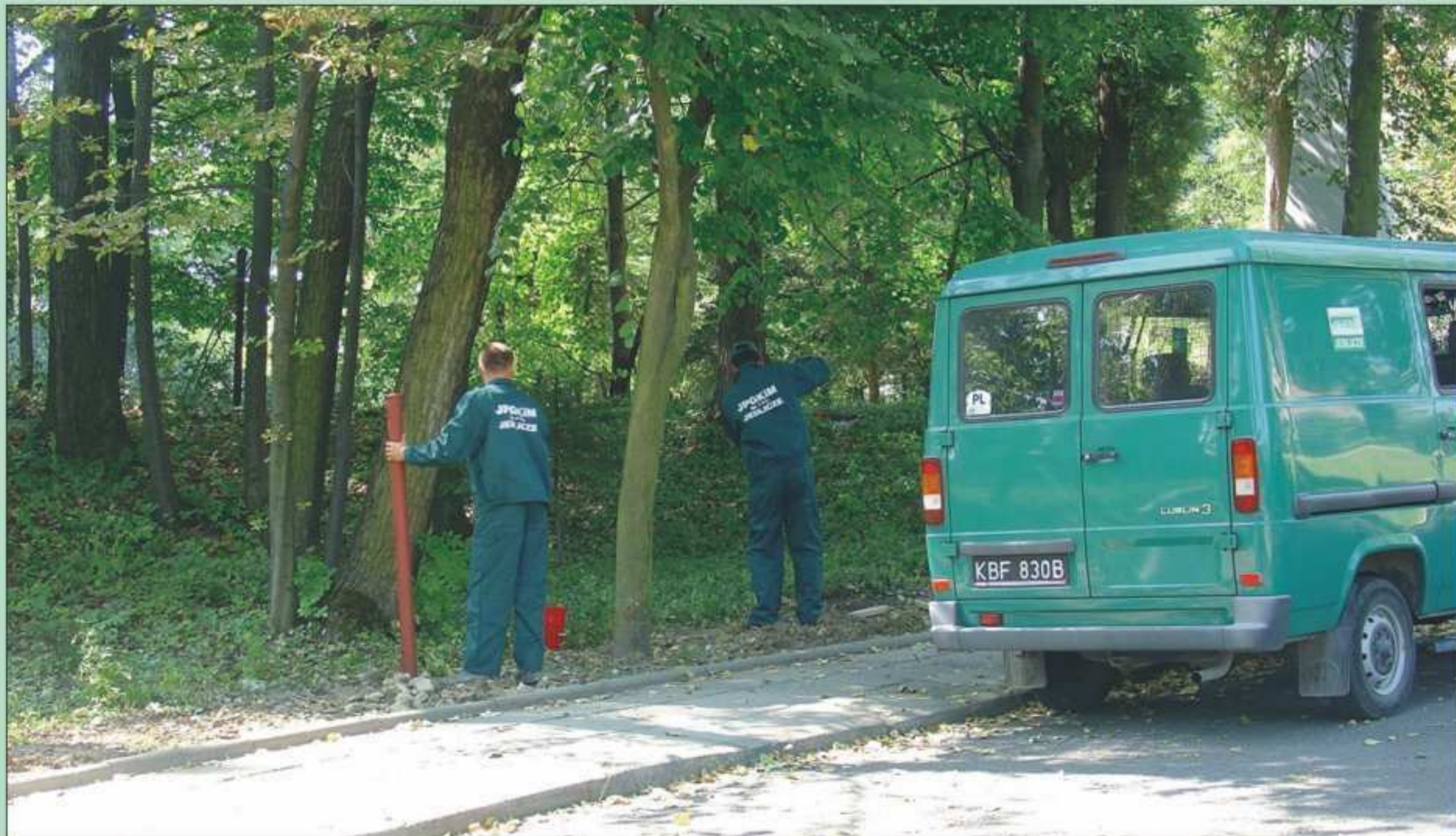
W ostatnim czasie zmienił się wygląd „Górki Kościelnej”. Prace przy budowanie nowego ogrodzenia od strony ul. Dubisa. Inwestorem jest Parafia Jedlicze. Wykonanie prac: Jedlickie Przedsiębiorstwo Gospodarki Komunalnej.