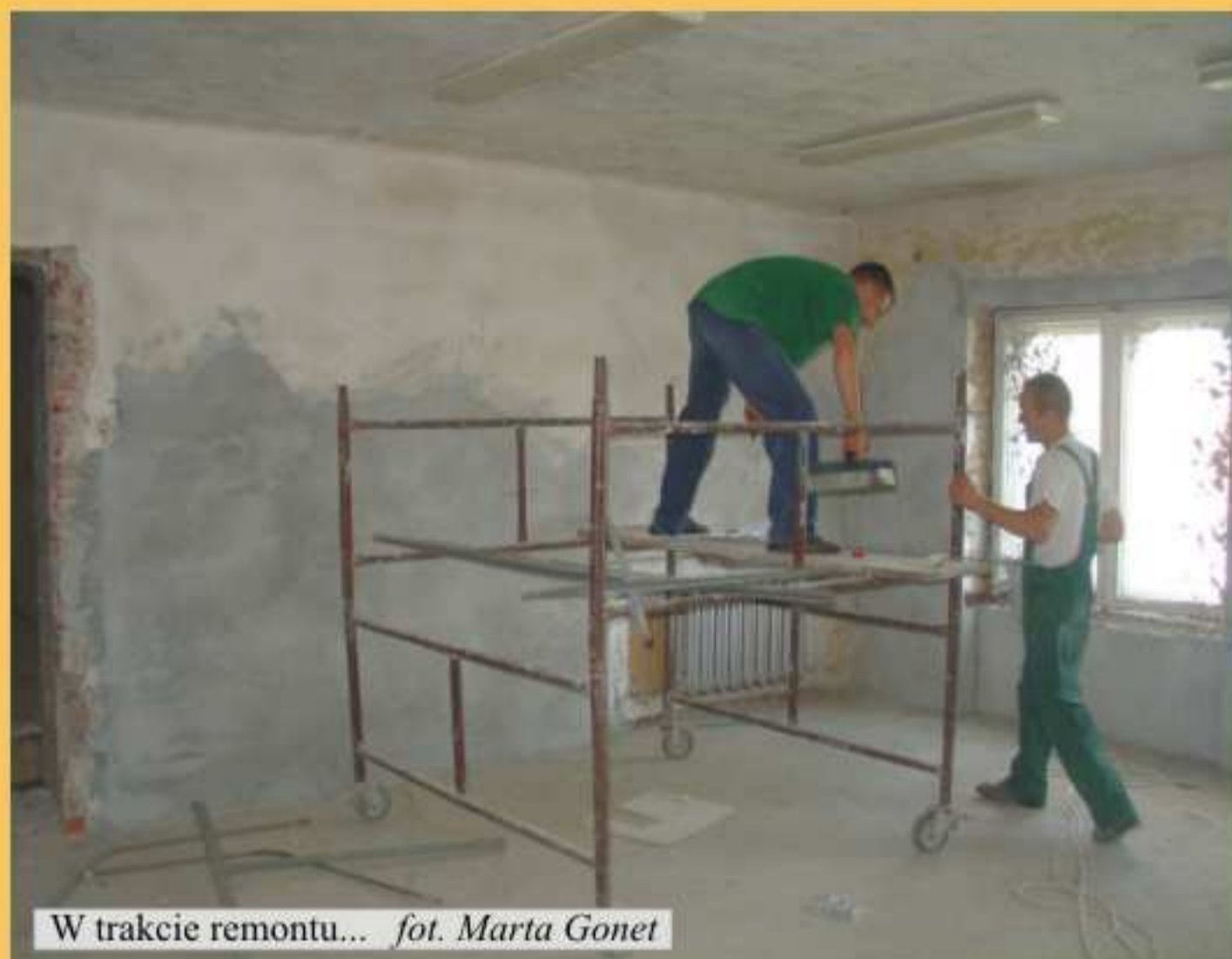
W trakcie remontu...