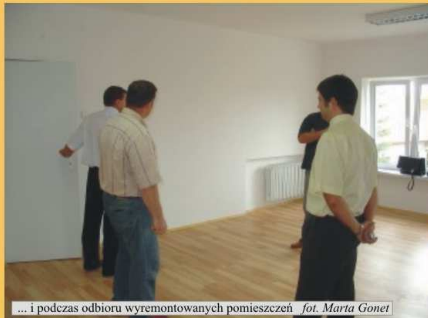
... i podczas odbioru wyremontowanych pomieszczeń