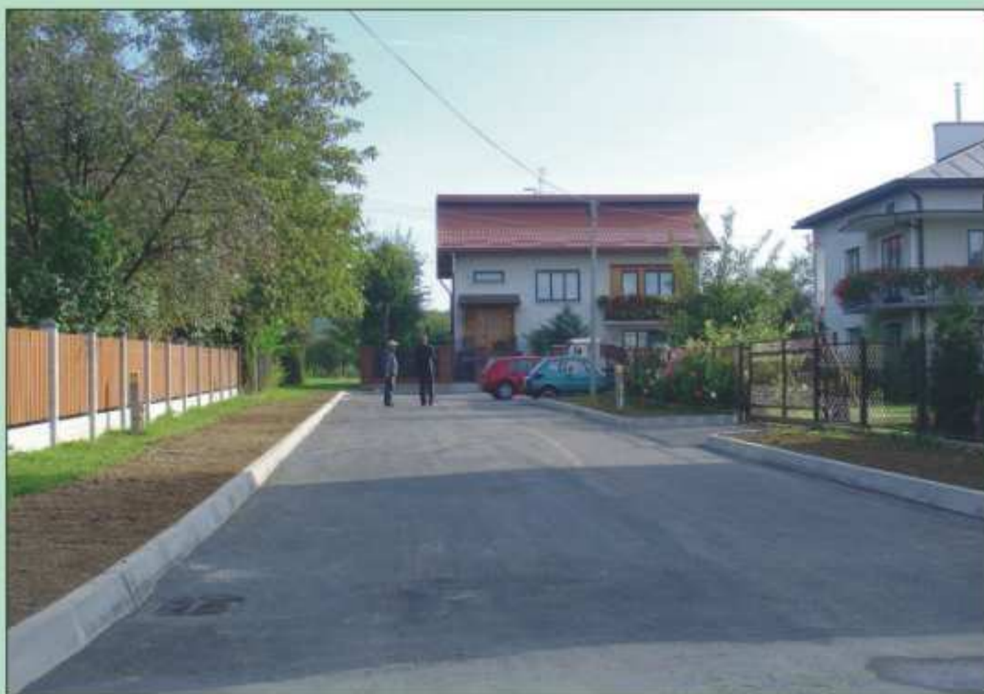
Ulica Krasińskiego w Jedliczu.