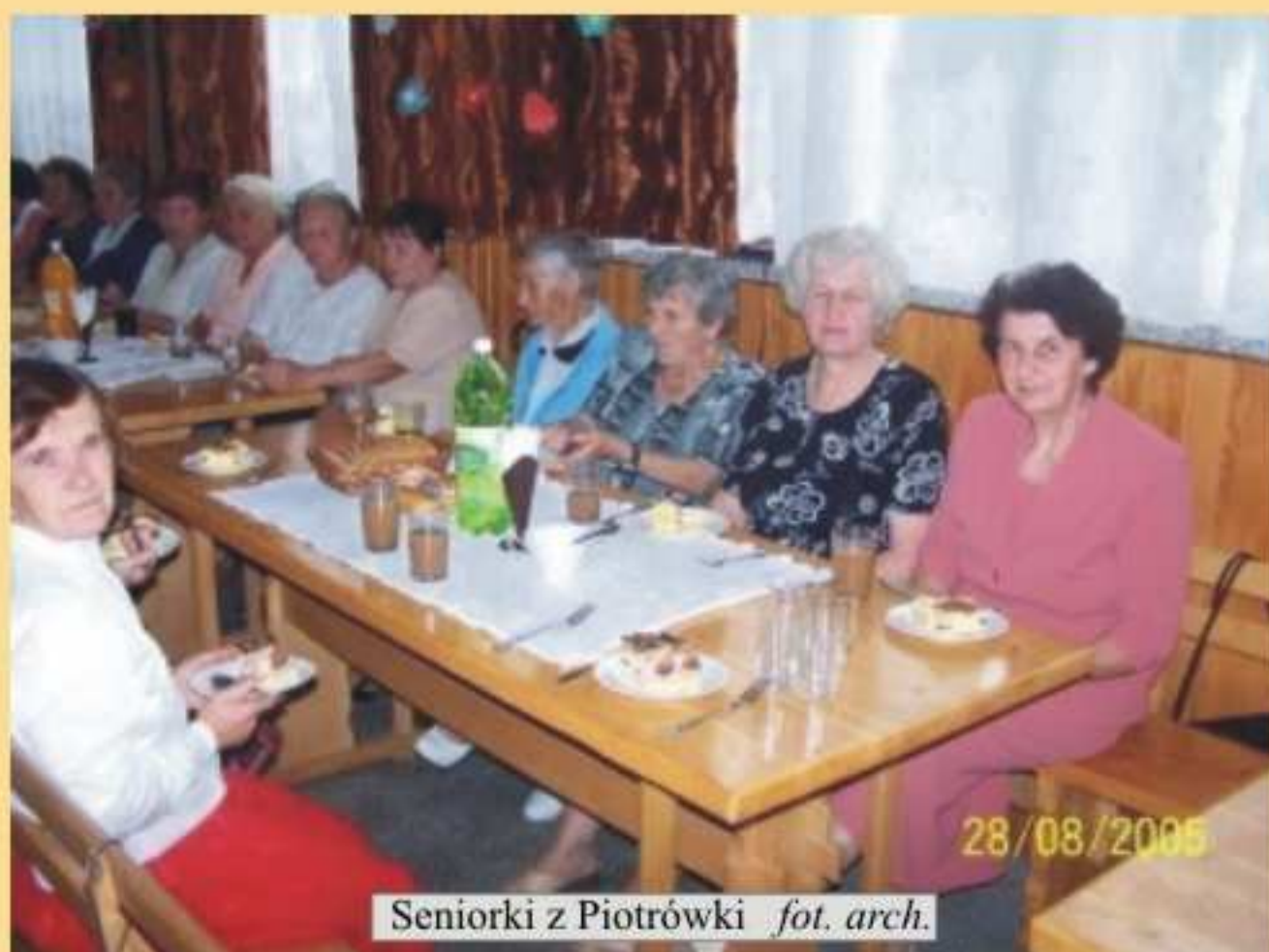
Seniorki z Piotrówki

W niedzielę 28 sierpnia br. do Domu Ludowego w Piotrówce Koło Gospodyń Wiejskich, Rada Sołecka oraz Gminny Ośrodek Kultury w Jedliczu zaprosili mieszkańców Piotrówki na coroczny Dzień Seniora.