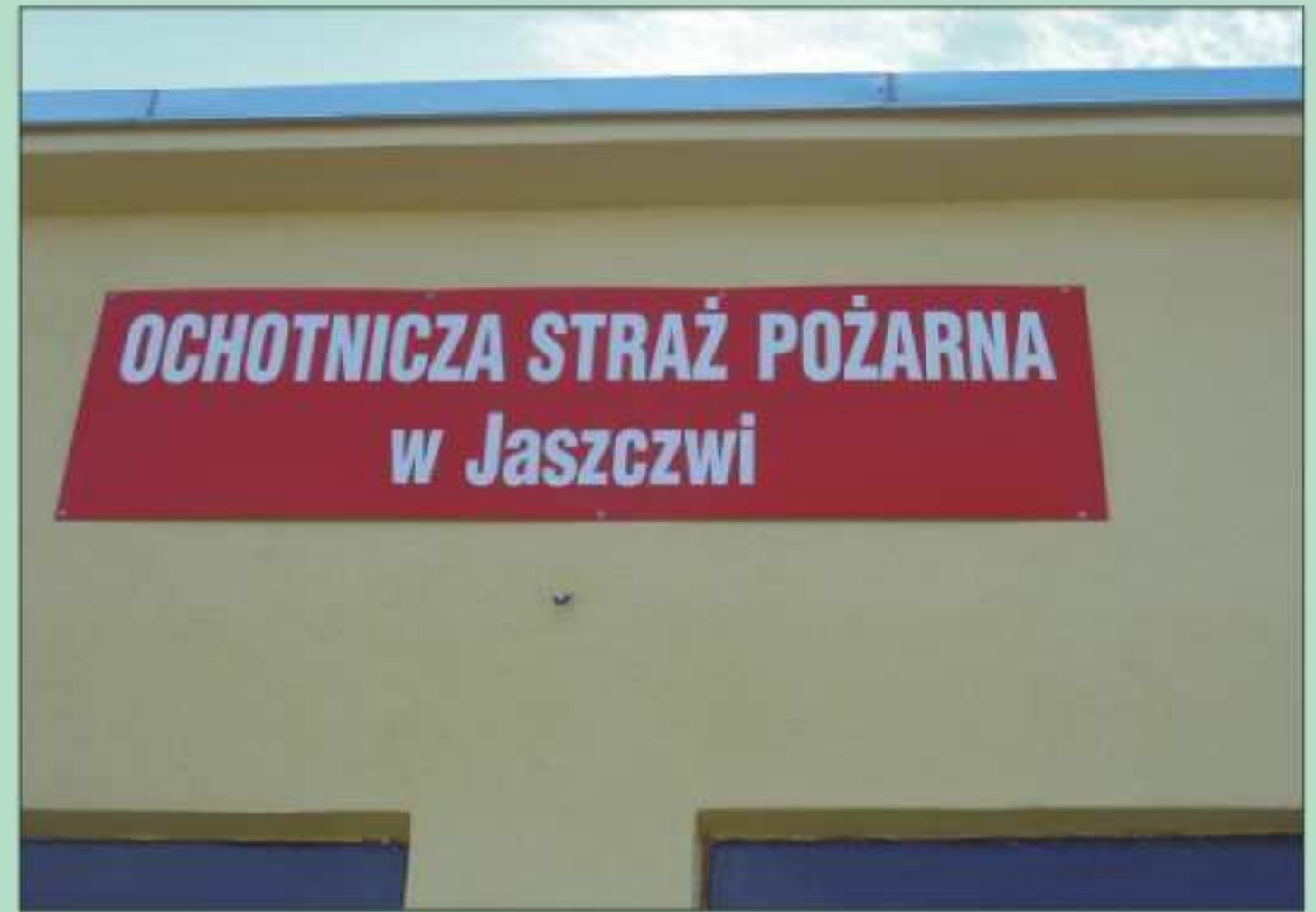
Wyremontowany budynek OSP w Jaszczwi.