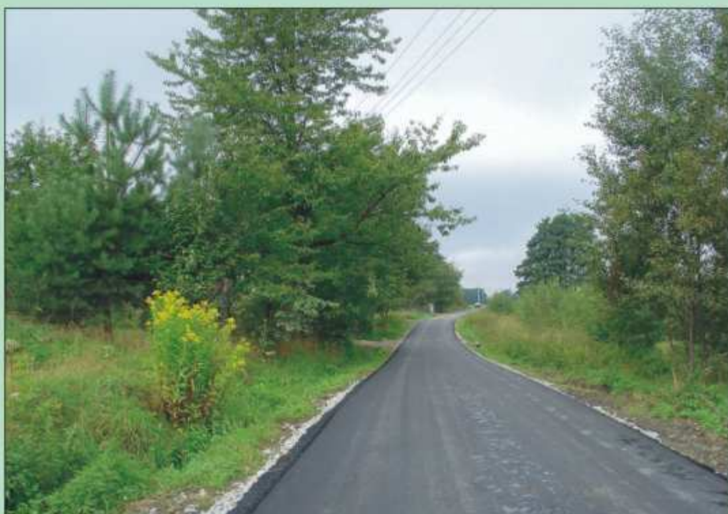
Nowa nawierzchnia drogi w Potoku - Kresy.