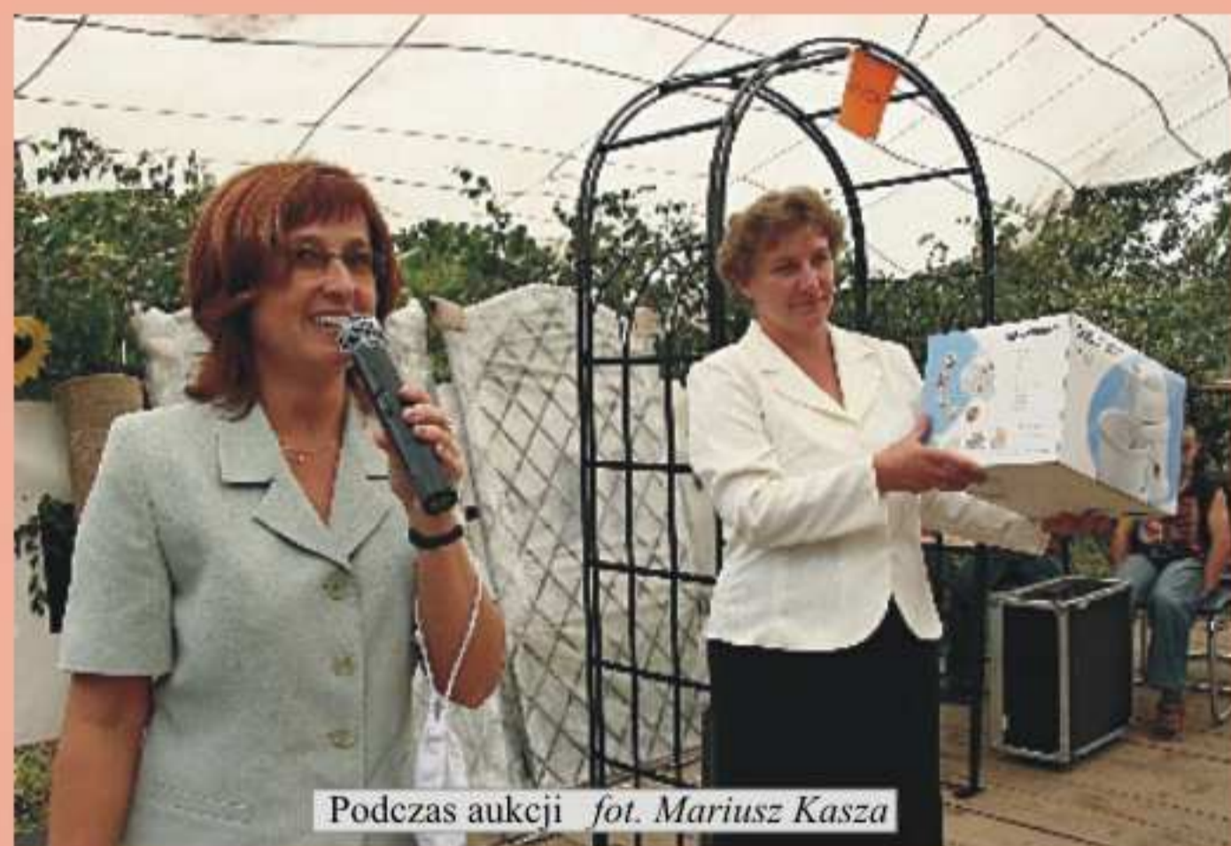
Podczas aukcji

W tym roku minęło 100 lat od czasu, kiedy progi Szkoły Podstawowej w Podniebylu przekroczyli pierwsi uczniowie. Wykształciło się w niej kilka pokoleń mieszkańców wsi. Szkoła ma już swoją tradycję, historię ma też przed sobą przyszłość - w którą wkracza pełna zapału i nowych możliwości.