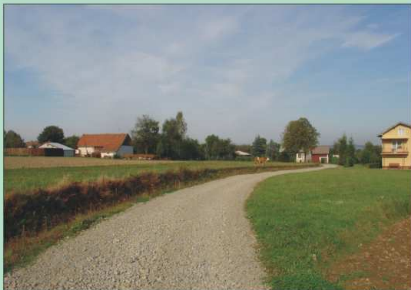
Podbudowa na drodze gminnej w Jaszczwi.