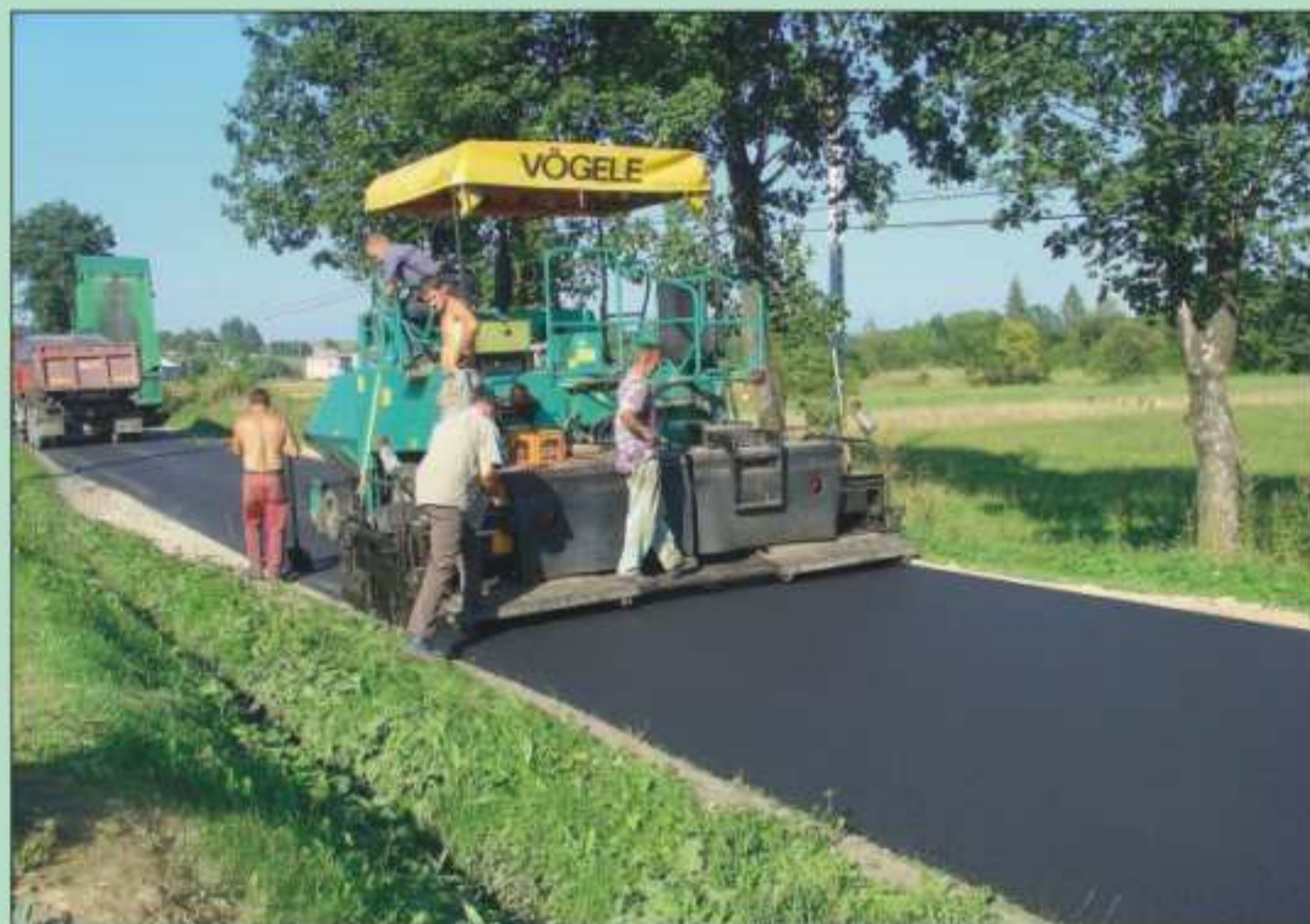
Prace na drodze w Piotrówce - wykonana wraz ze Starostwem Powiatowym w Krośnie