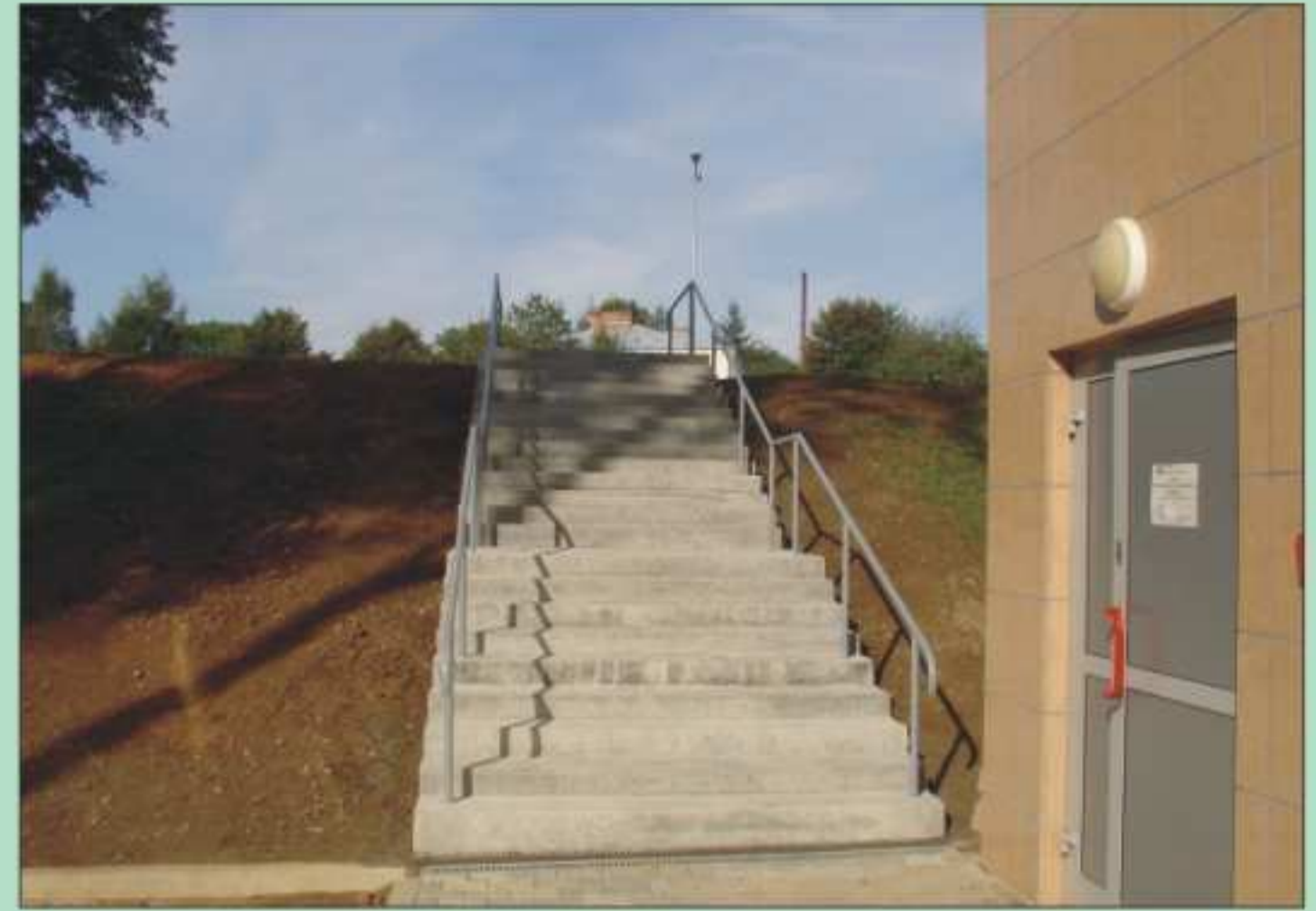
Zagospodarowanie terenu wokół Hali Widowiskowo-Sportowej w Jedliczu.