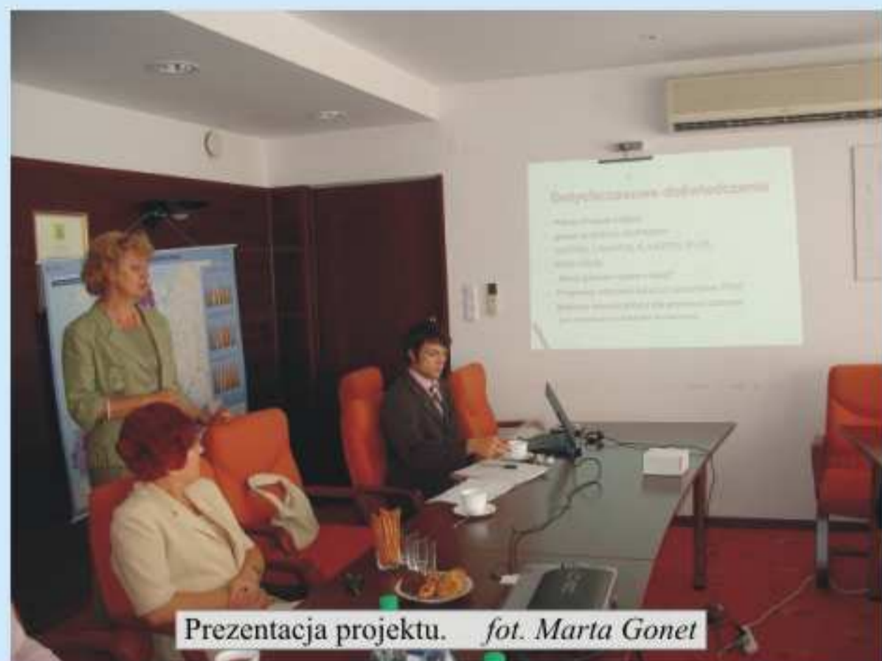
Prezentacja projektu.