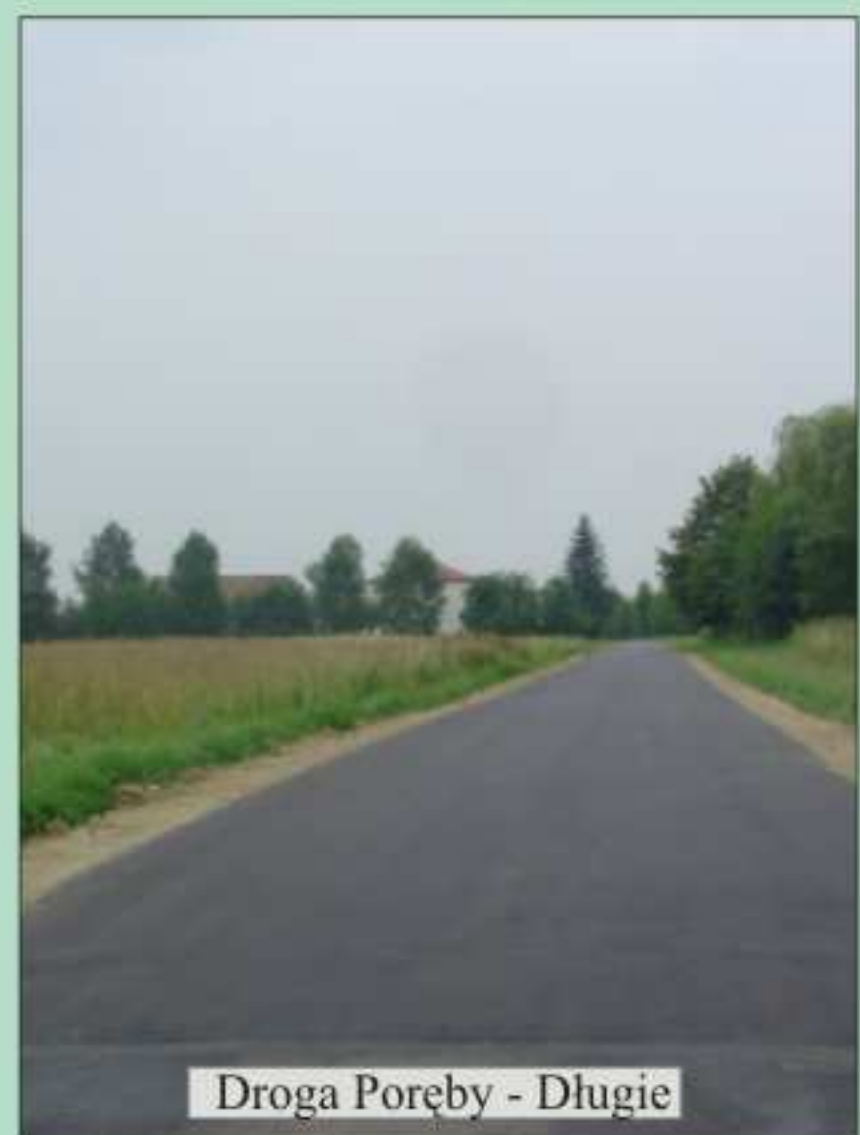
Droga Poręby - Długie