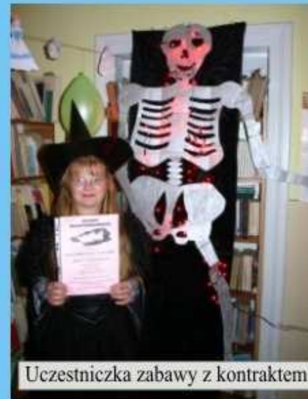
Uczestniczka zabawy z kontraktem