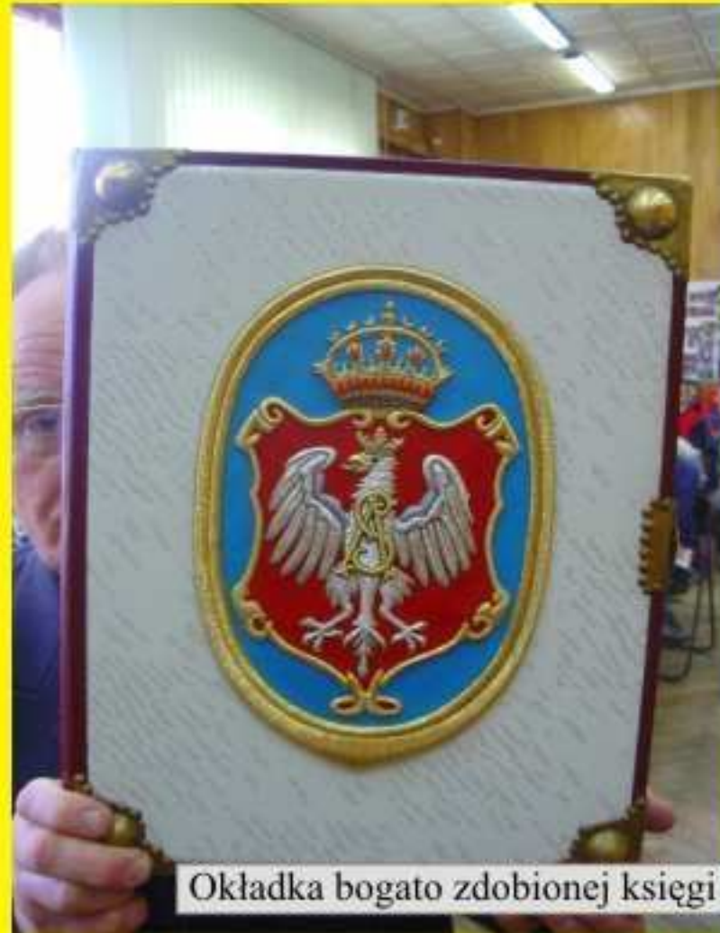
Okładka bogato zdobionej książki

odwzorowane książki egipskie - wykonane z papiirusu, gliniane książki Sumerów, książki chińskie, greckie, indyjskie, koptyjskie. Najpiękniejszym okazem w moich zbiorach jest żydowska TORA. Pracowałem przy niej ponad rok. Nauczyłem się dla niej haftować, ma metr wysokości - opowiadał.