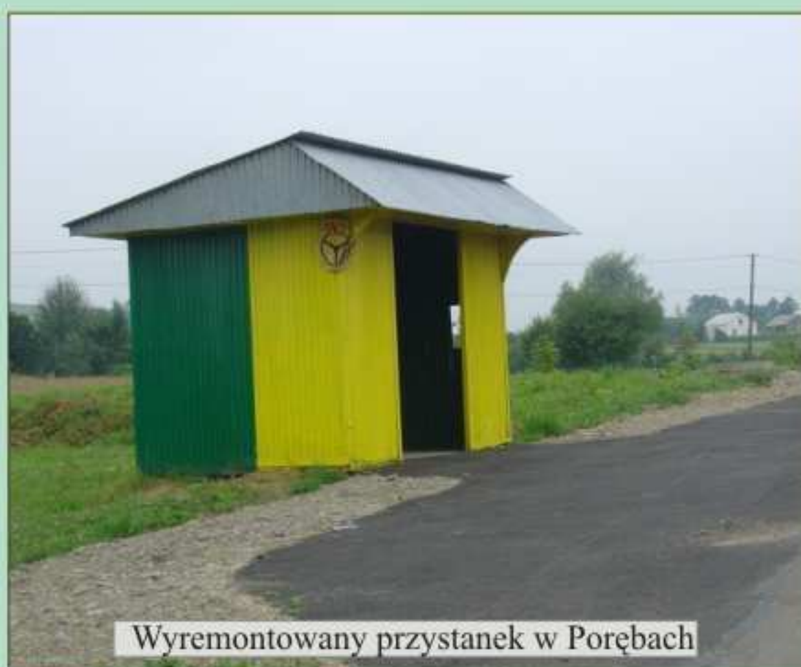
Wyremontowany przystanek w Porębach