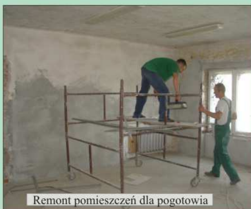
Remont pomieszczeń dla pogotowia