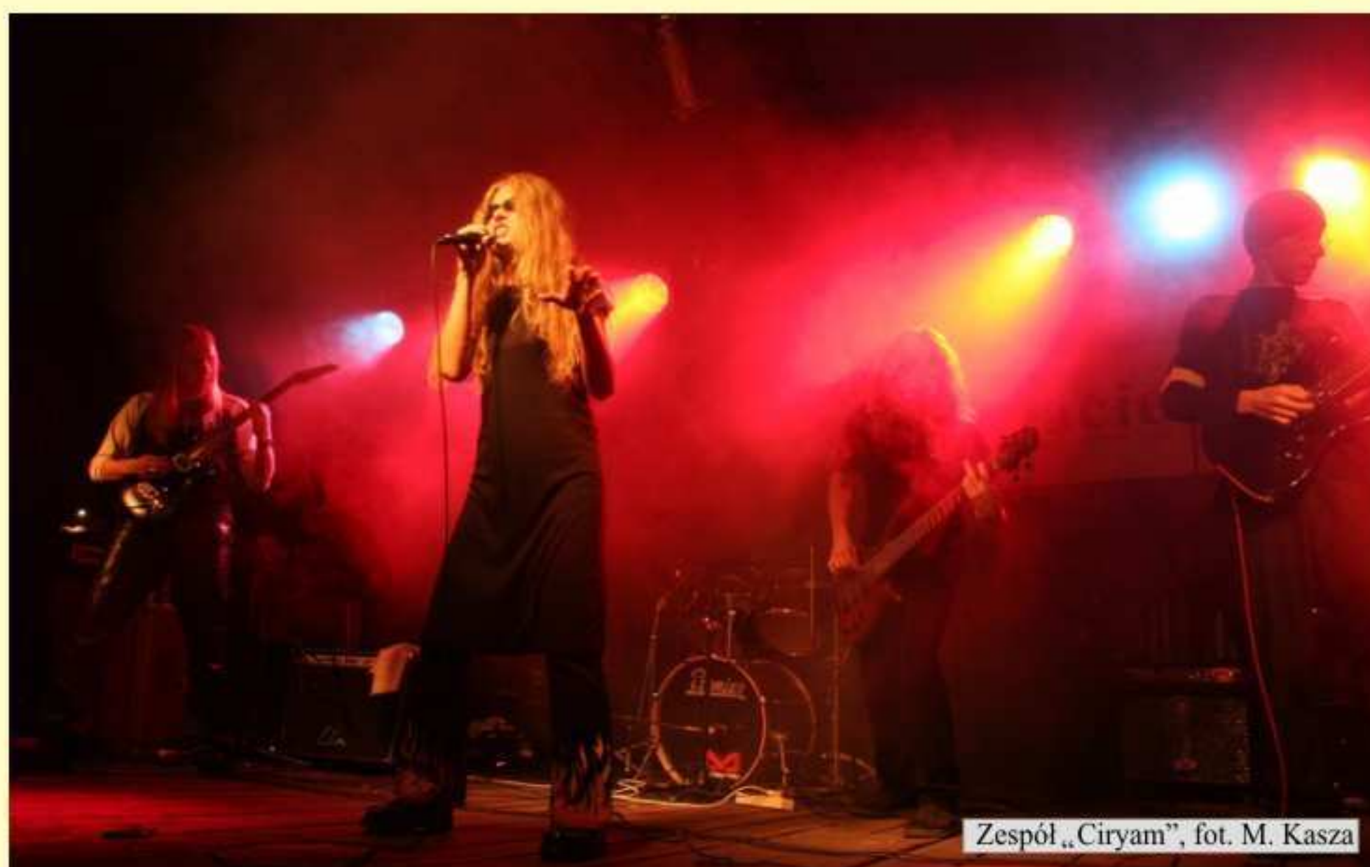
Zespół „Ciryam”