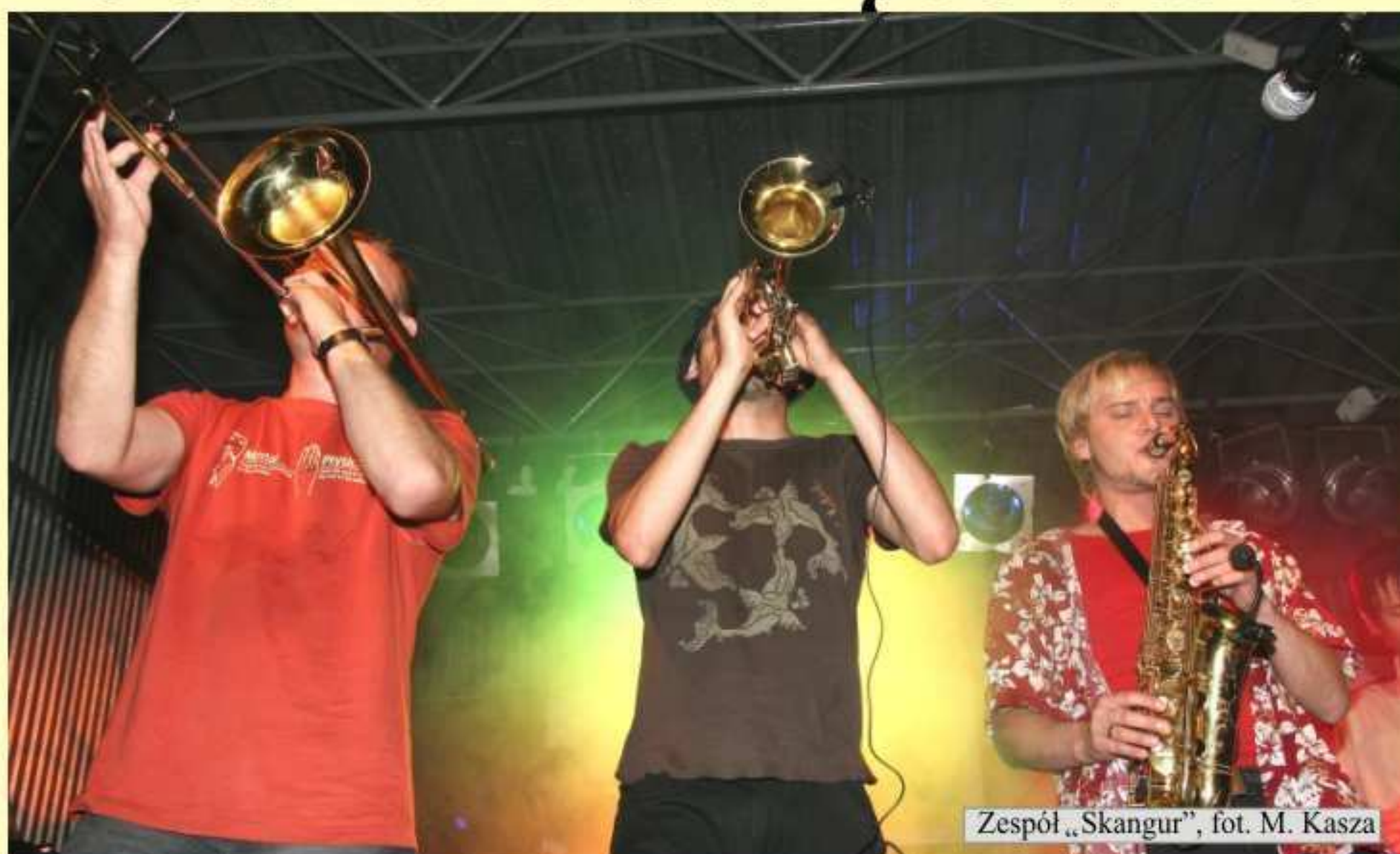
Zespół „Skangur”