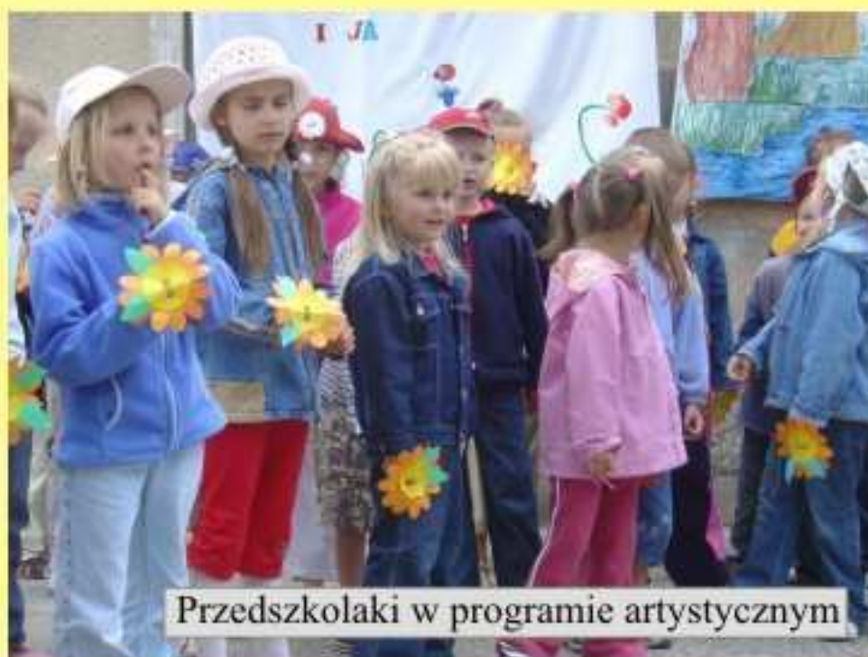
Przedokolaki w programie artystycznym

Organizatorami imprezy było Samorządowe Przedszkole w Jedliczu przy współudziale Rady Rodziców, jednak