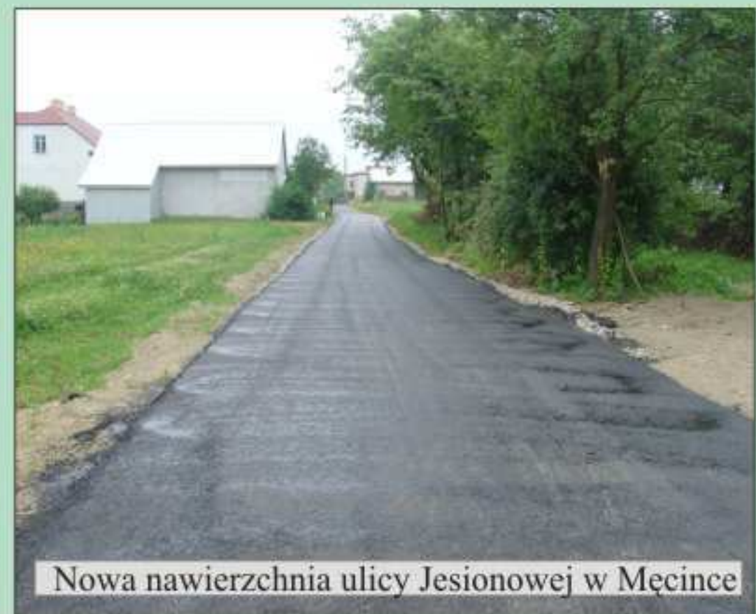
Nowa nawierzchnia ulicy Jesionowej w Męcince