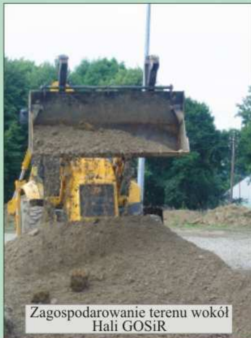
Zagospodarowanie terenu wokół Hali GOSiR