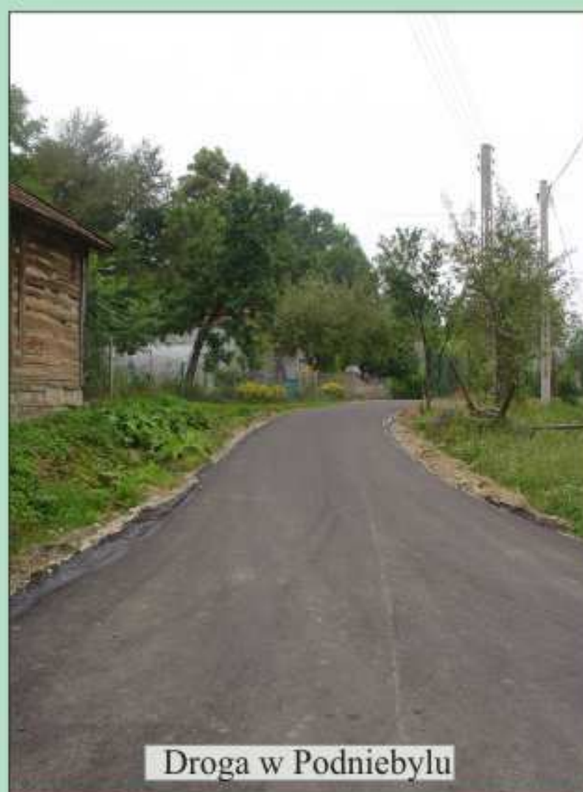
Droga w Podniebylu