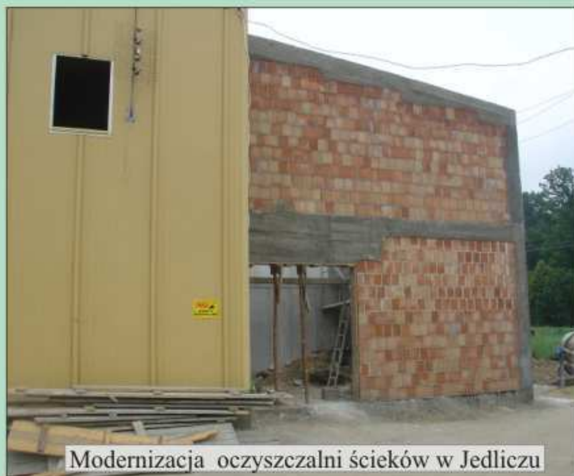
Modernizacja oczyszczalni ścieków w Jedliczu