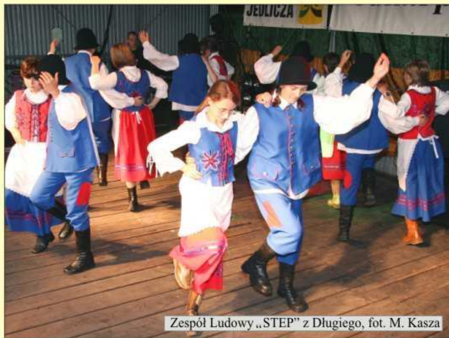
Zespół Ludowy „STEP” z Długoiego

Część artystyczną na stadionie rozpoczął spektakl dla dzieci pt. „O Smoku Obiboku i Królu Leniuchu” w wykonaniu aktorów „Bajlandii” z Rzeszowa. Początek przedstawienia