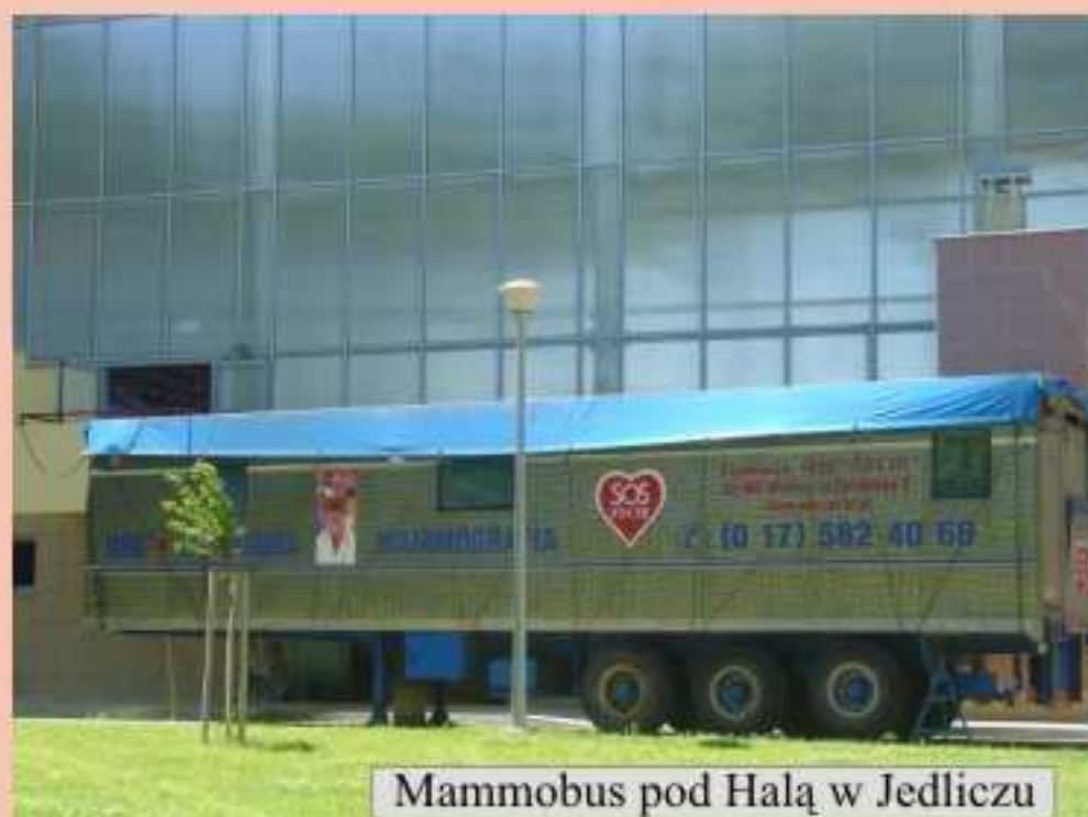
MammoBUS pod Halą w Jedliczu

Do wszystkich kobiet z terenu Gminy Jedlicze zostały rozesłane imienne zaproszenia. Kobiety w wieku 30-59 dostały zaproszenia na badania cytologiczne,