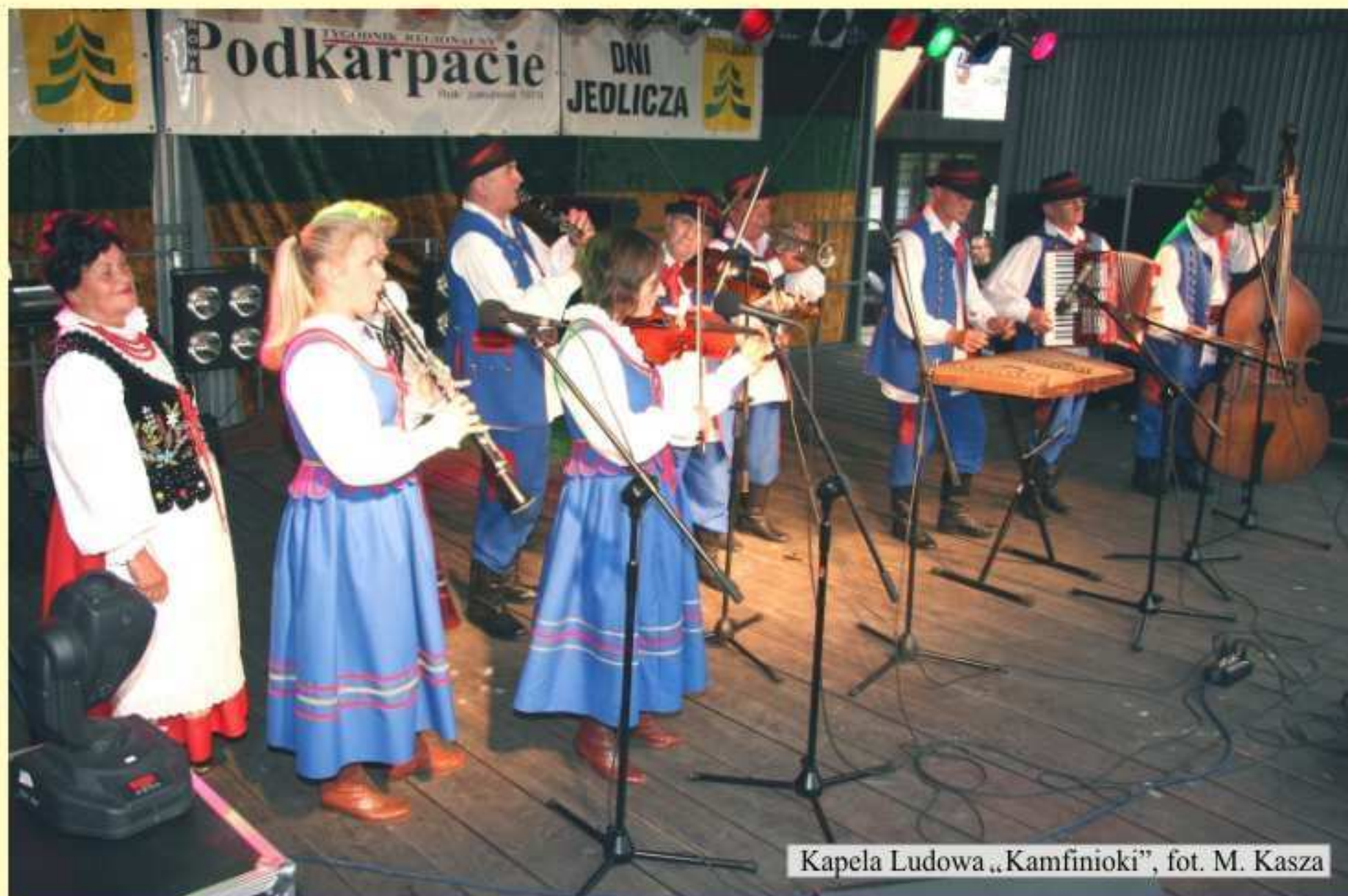
Kapela Ludowa „Kamfinioki”

Miłośnicy muzyki folklorystycznej mieli okazję usłyszeć swojskie nuty Kapeli „Kamfinioki”, a Zespół Taneczny „Step” ze Szkoły Podstawowej w Długiem skupił na sobie uwagę sympatyków tańców ludowych. Nowy układ taneczny zaprezentował także zespół „Szaasse” przygotowany przez Gabrielę Wilk.