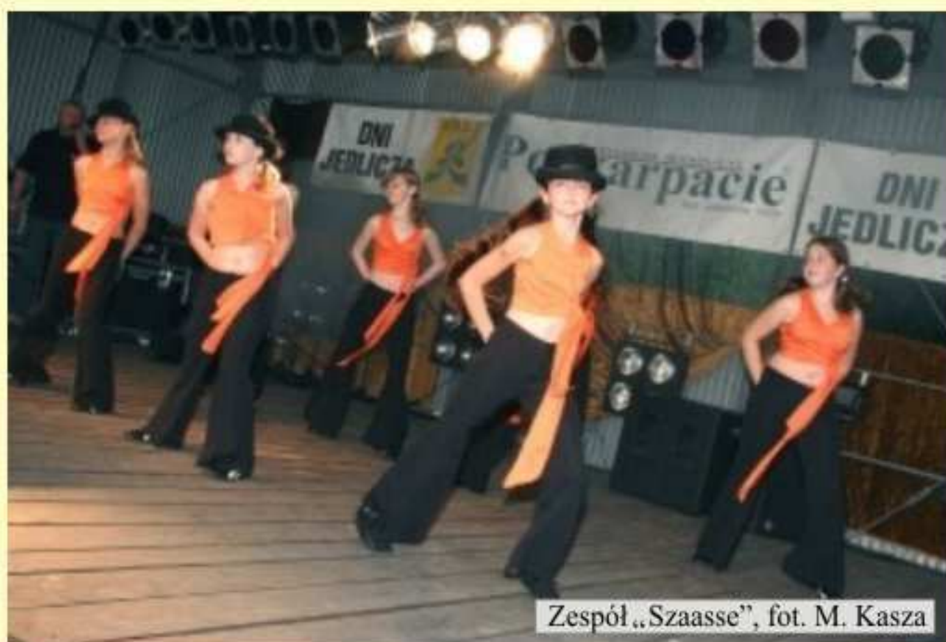
Zespół „Szaasse”, fot. M. Kasza