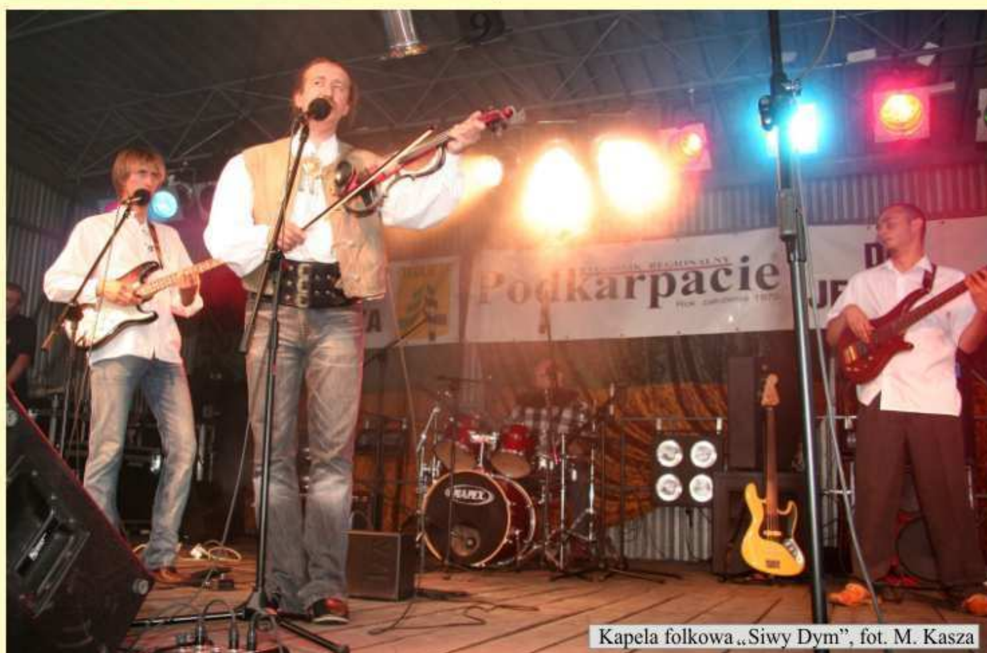
Kapela folkowa „Siwy Dym”

W zawodach strzeleckich z broni palnej najlepszy okazał się Wojciech