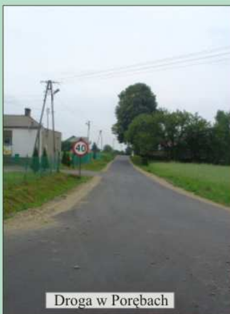
Droga w Porębach