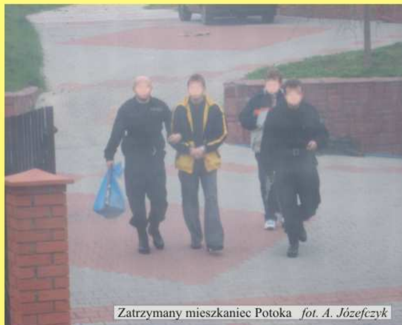
Zatrzymany mieszkaniec Potoka