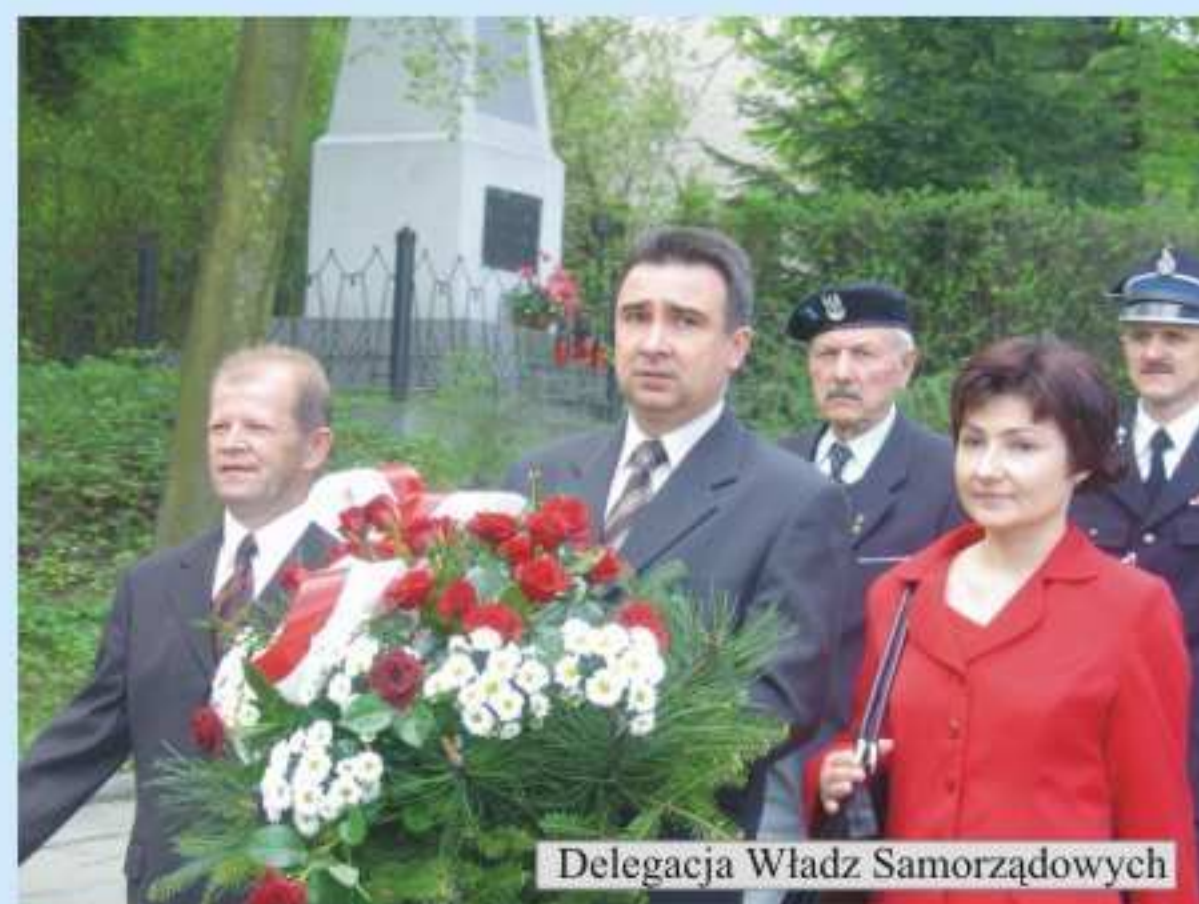
Delegacja Władz Samorządowych