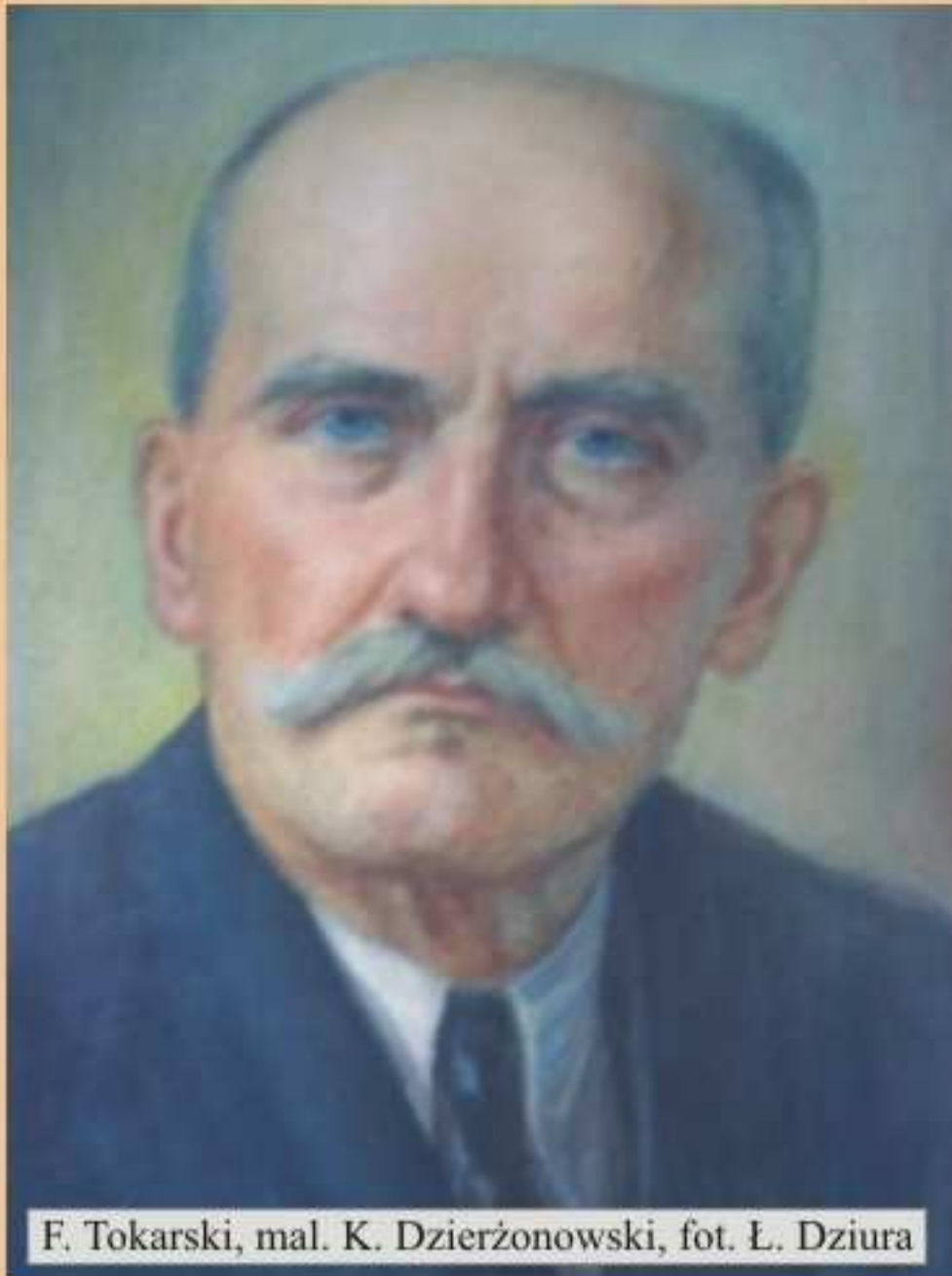
F. Tokarski, mal. K. Dzierżonowski

należały oględziny zwłok, bydła i mięsa w Jedliczu. Opłaty za te czynności wpływały do Funduszu Powiatowego. W okresie okupacji praktykował prywatnie. Z chwilą wyzwolenia Jedlicza 8 września 1944 r. i powstania Prywatnego Gimnazjum i Liceum Ogólnego