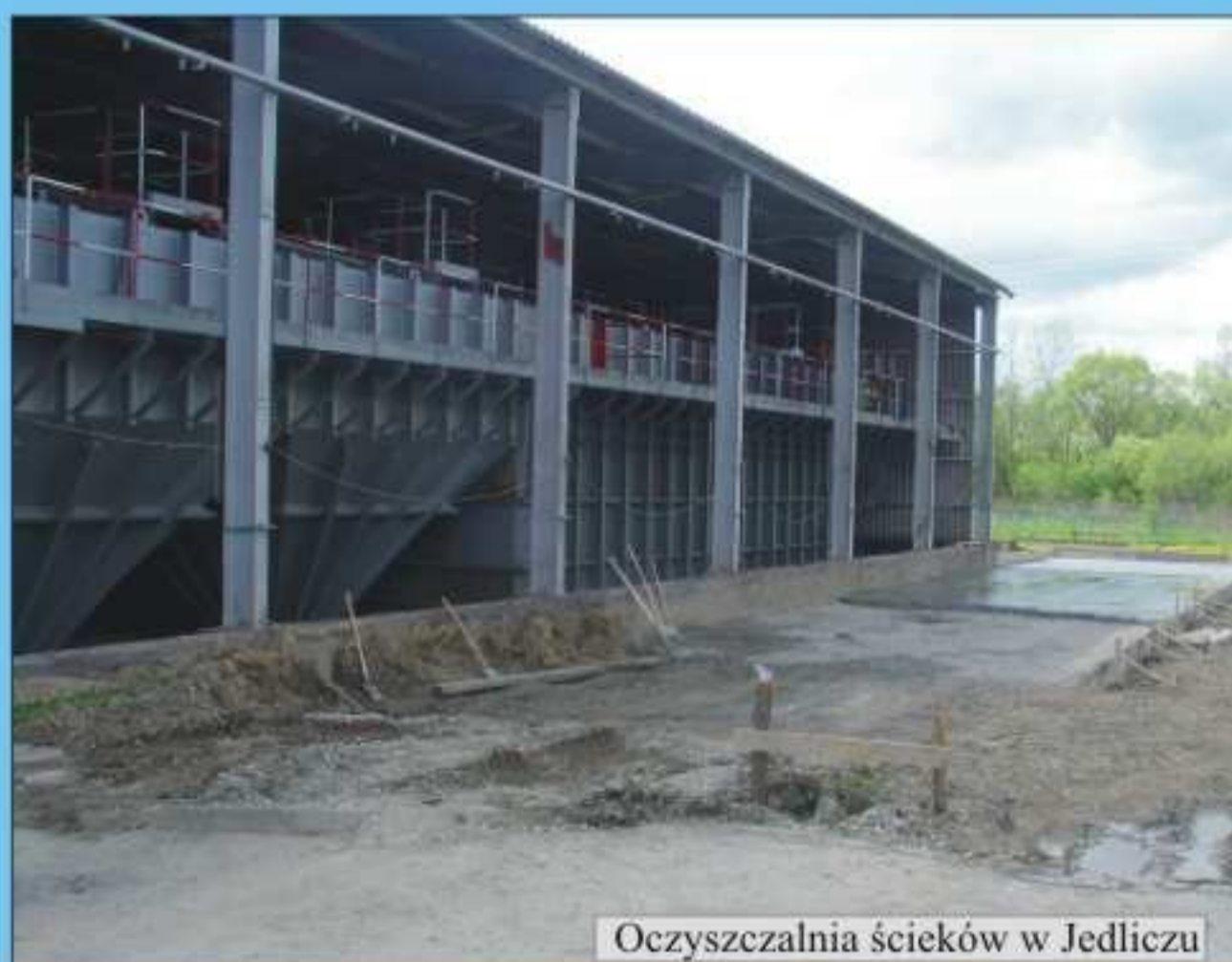
Oczyszczalnia ścieków w Jedliczu