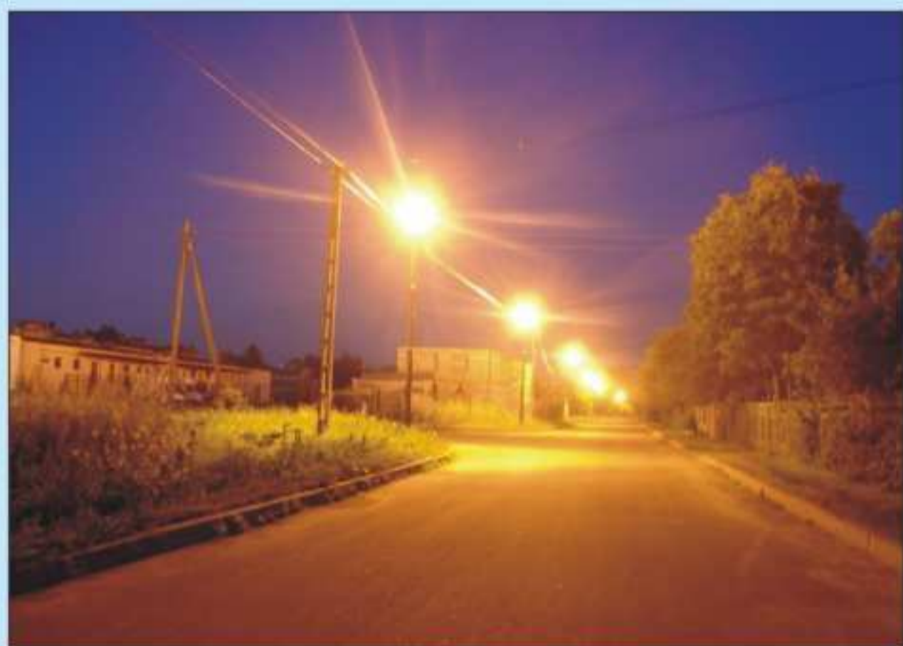
Oświetlenie ulic: 3-go Maja, Grunwaldzkiej i Reja w Jedliczu. W ramach tych prac zamontowane zostały 32 lampy. Koszt inwestycji - niespełna 78 000,00 zł.