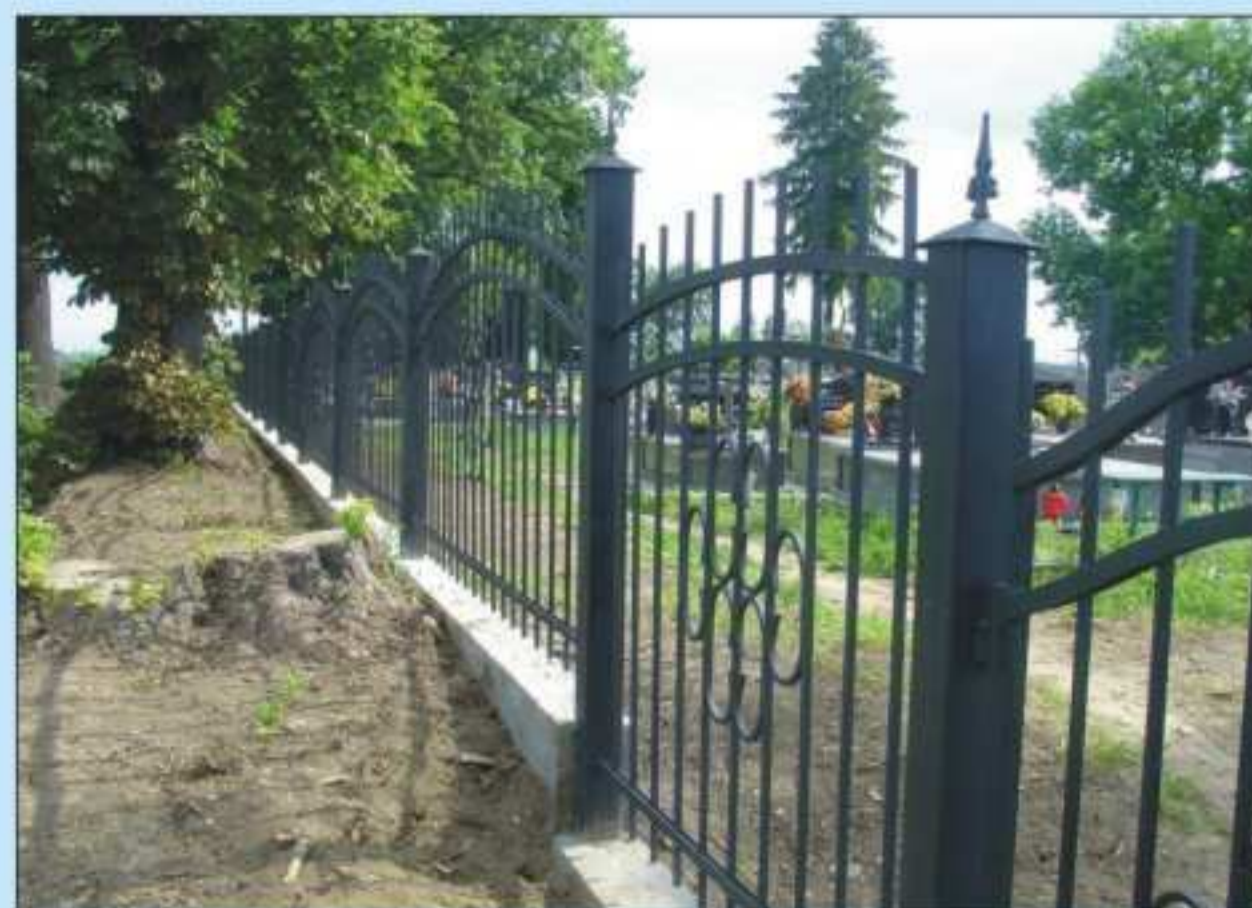
Ogrodzenie cmentarza. Długość 150 m, koszt - około 56 000,00 zł.

W dniu 5 lipca br. podpisana została umowa z funduszem Sapard o dofinansowanie budowy kanalizacji sanitarnej przy ul. Głowackiego w Jedliczu oraz części Żarnowca. Łączna długość kolektora sanitarnego wynosi około 3000 m. Do sieci planuje się przyłączyć 49 gospodarstw domowych. Koszt inwestycji zamknie się kwotą: 380 005,94 zł, w tym 152 002,39 zł to środki pochodzące z funduszu Sapard.