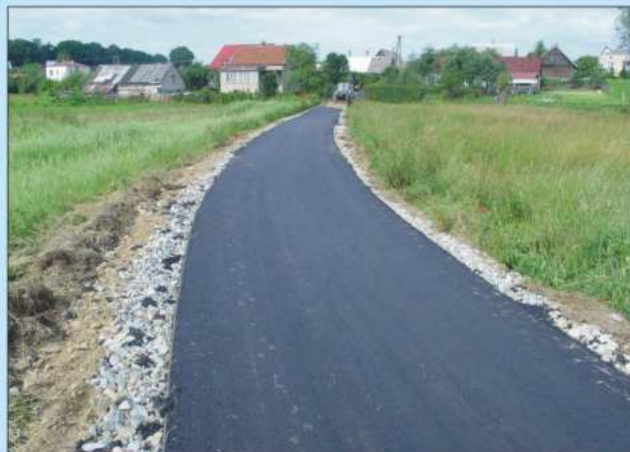
Droga Żarnowiec - Wisze. Długość 350 m. Współfinansowana ze środków Urzędu Rady Ministrów. Koszt: 62 512,80 zł.