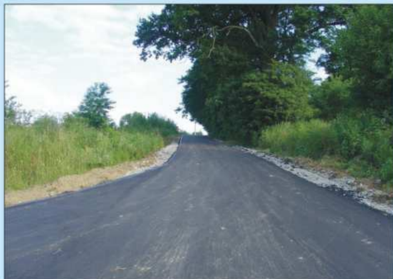
Droga w Chlebnej. Długość 516 m. Współfinansowana ze środków Urzędu Rady Ministrów. Koszt: 132 923,88 zł.