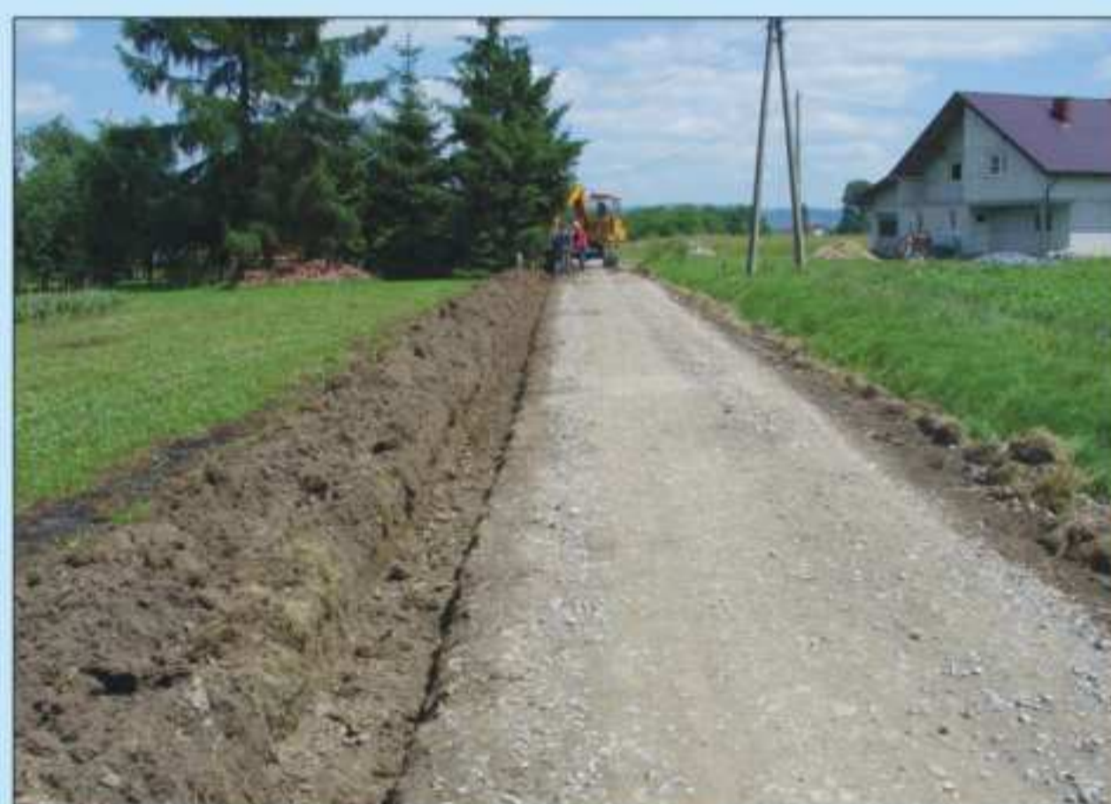
Droga Dobieszyn - Potok. Długość 1257 m. Współfinansowana ze środków pochodzących z funduszu Sapard. Całkowity koszt: 432 811,16 zł z tego 150 604,21 zł to środki z Sapardu.