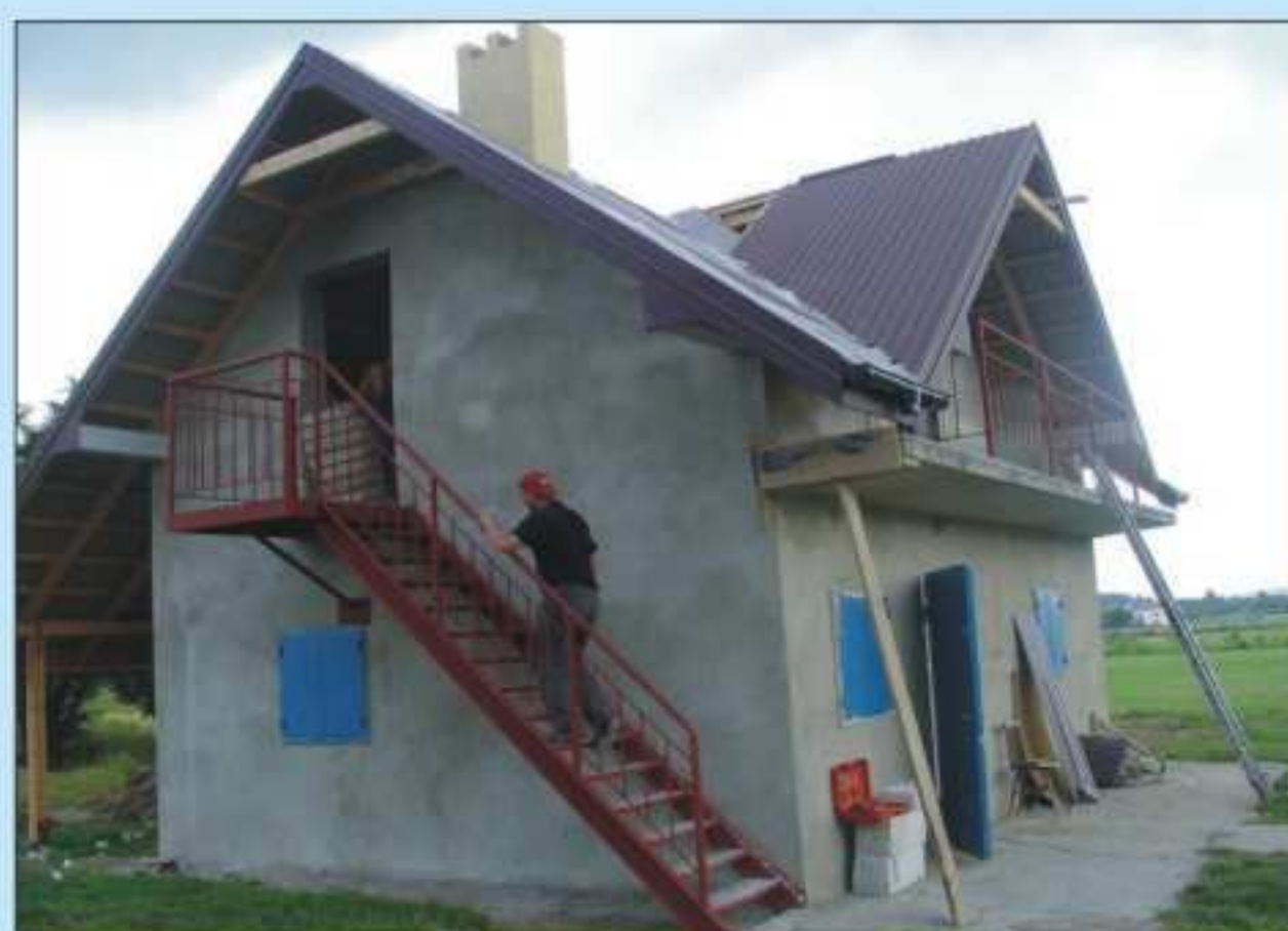
Szatnia dla sportowców przy stadionie w Dobieszynie. Koszt 46 684,00 zł