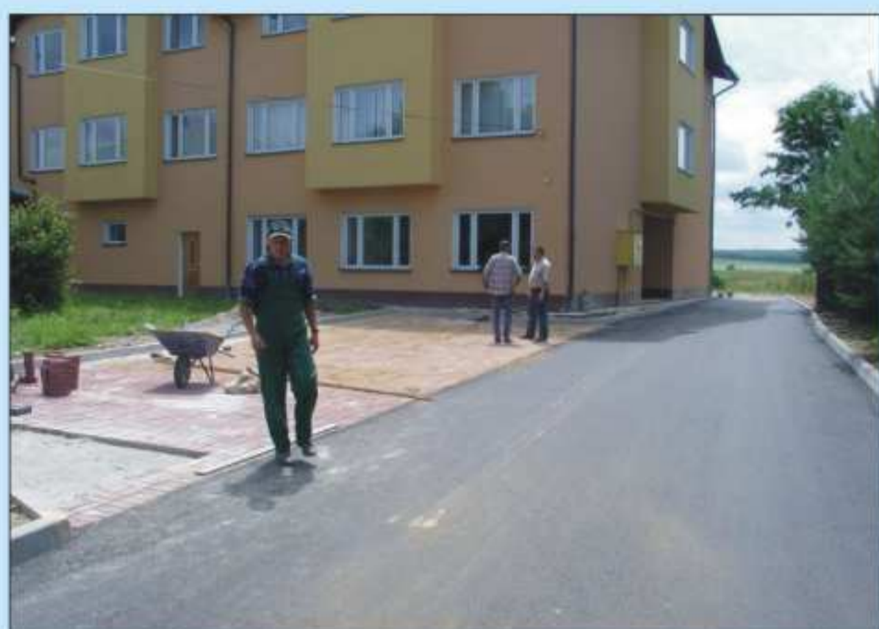
Parking i droga przy Zespole Szkół w Moderówce. Koszt 87 441,26 zł. W ramach tych prac wykonano także kanalizację deszczową i sieć odwodnieniową terenu wokół budynków szkoły.