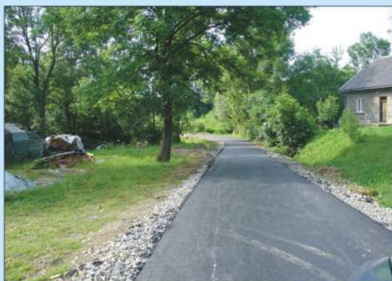
Droga Piotrówka - Grabie. Długość 200 m. Współfinansowana ze środków Urzędu Rady Ministrów. Koszt: 39 457,85 zł.