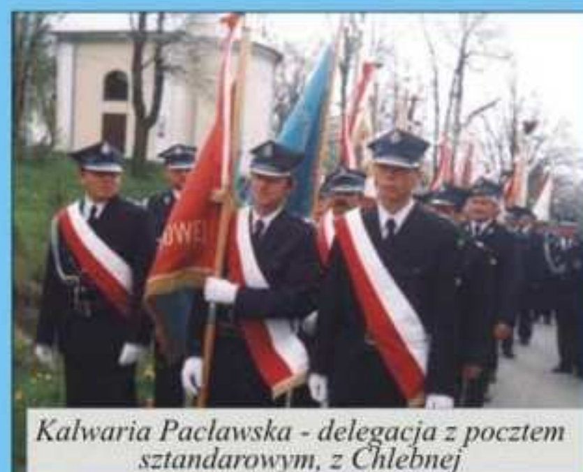
Kalwaria Paclawska - delegacja z pocztą sztandarowym, z Chlebnej