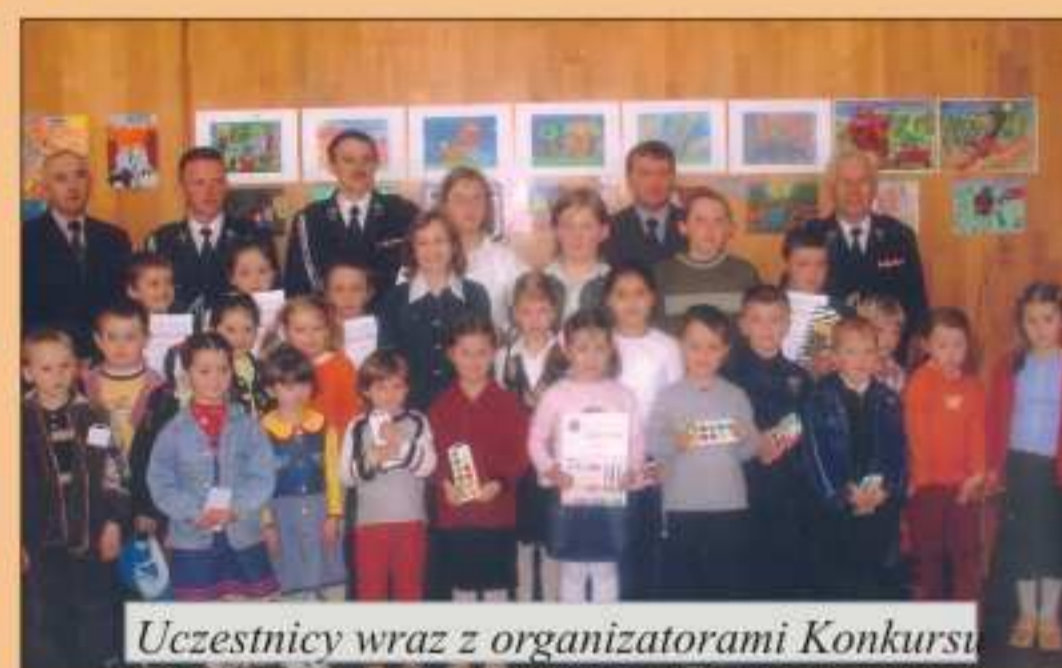
Uczestnicy wraz z organizatorami Konkursu