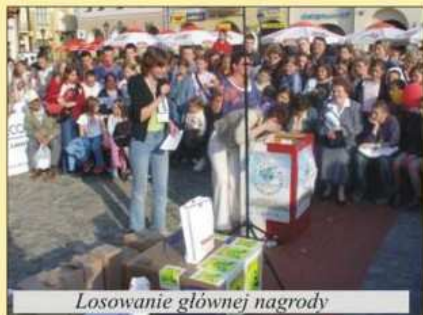
Losowanie głównej nagrody

W dniu 23 kwietnia 2004 roku na rynku w Krośnie odbył się „Piknik 25 państw” zorganizowany przez Stowarzyszenie „Twoje Krosno” oraz Europejski Klub Liderów działający pod egidą tej organizacji. Impreza rozpoczęła się o godz. 13.00 od parady europejskiej. Grupy młodzieży ze szkół Miasta Krosna i Powiatu Krośnieńskiego starały się jak najlepiej pokazać każdy z krajów - na przykład, „Lotysze” ubrani byli na biało-bordowo, „Duńczycy” nieśli klocki lego, a „Irlandczycy” mieli ze sobą zielone koniczynki. Barwny i radosny korowód przemaszerował na trasie Rondo-Rynek. Na Rynku przedstawiciele szkół