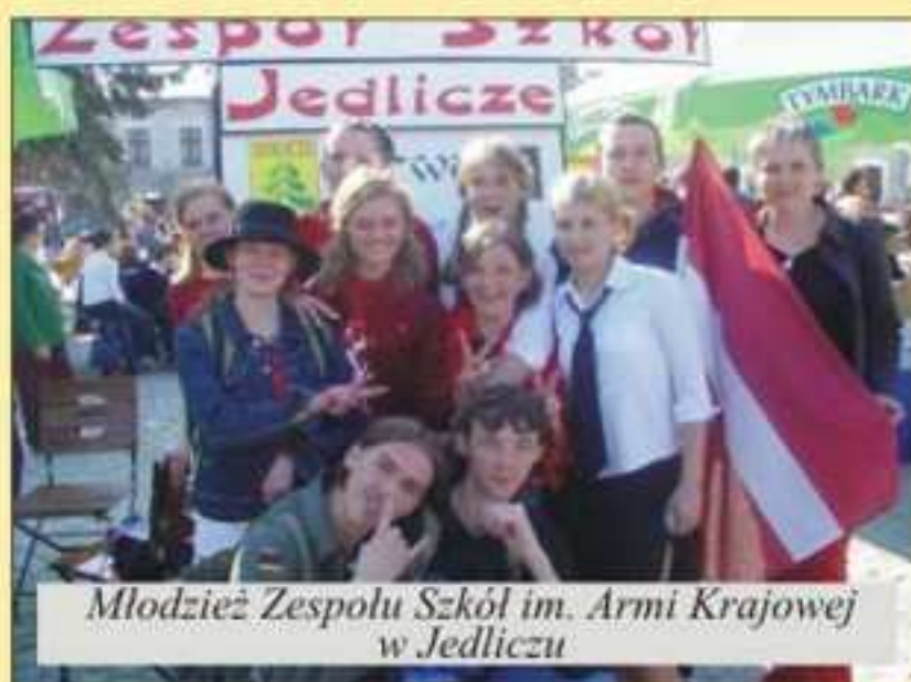
Młodzież Zespołu Szkół im. Armii Krajowej w Jedliczu

W imprezie brała udział również młodzież Zespołu Szkół im. Armii Krajowej w Jedliczu,