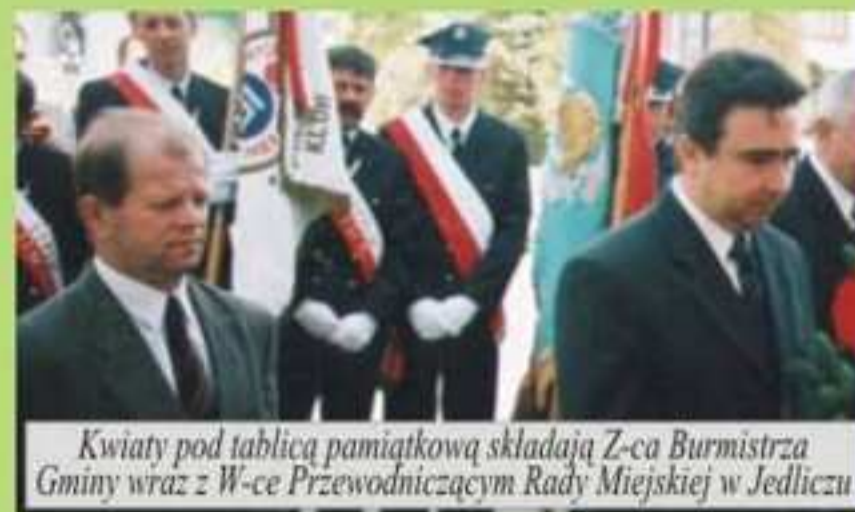
Kwiaty pod tablicą pamiątkową składają Z-ca Burmistrza Gminy wraz z W-ce Przewodniczącym Rady Miejskiej w Jedliczu

podkreślał również udział pocztów sztandarowych: Światowego Związku Żołnierzy Armii Krajowej - Koło w Jedliczu, Związku Kombatantów Rzeczypospolitej Polskiej i Byłych Więźniów Politycznych, Klubu Honorowych Dawców Krwi im. dr Zygmunta Tokarskiego, Ochotniczej Straży Pożarnej w Jedliczu, Ochotniczej Straży Pożarnej w Chlebnej, Liceum