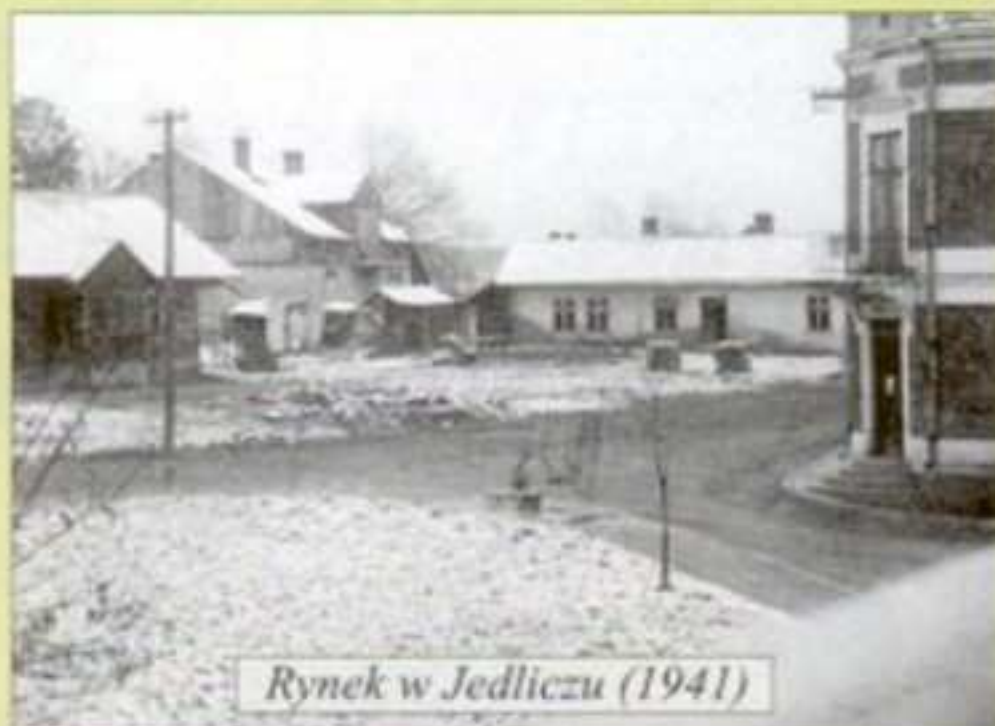
Rynek w Jedliczu (1941)

W roku 1941 Niemcy utworzyli w Jedliczu getto dla żydów, którzy następnie zostali rozstrzelani w różnych miejscach masowych straceń.