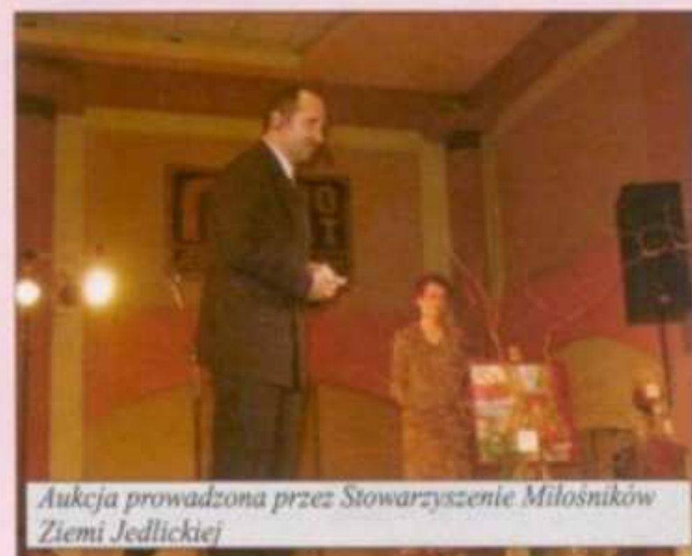
Aukcja prowadzona przez Stowarzyszenie Miłośników Ziemi Jedlickiej

(panieństwo) i czepek (małżeństwo); 3. pieniądze (bogactwo), chleb (życie w dostatku) i grudka ziemi (śmierć lub choroba bliskiej osoby albo bankructwo); 4. listek (staropanieństwo), różaniec (klasztor) i obrączka/pierścionek (ślub); 5. obrączka (małżeństwo), lalczka lub smoczek (nieślubne dziecko) i różaniec (staropanieństwo lub klasztor); 6. jedwabny szal (luksus), podarta