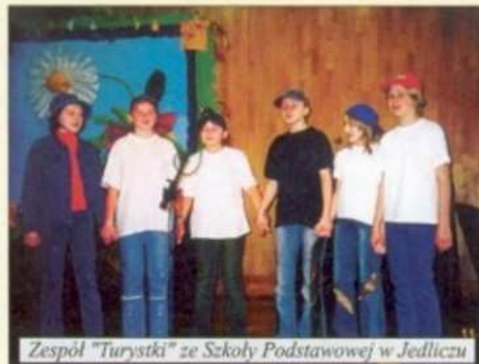
Zespół "Turystki" ze Szkoły Podstawowej w Jedliczu

Konkurs odbył się 26 listopada, w Sali Gminnego Ośrodka Kultury gdzie wystąpiły zespoły oraz soliści, reprezentujący cztery szkoły podstawowe z terenu naszej Gminy: SP w Długiem, Jaszczwi, Jedliczu i Żarnowcu. Razem w Konkursie wzięło udział 16 wykonawców.