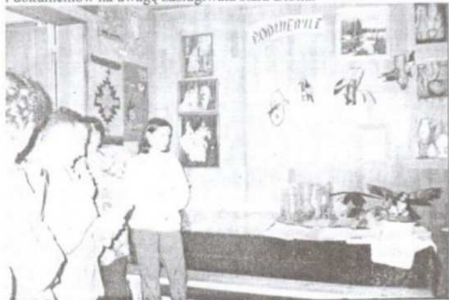
Prezentacja miniekspozycji miejscowości Podniebyle