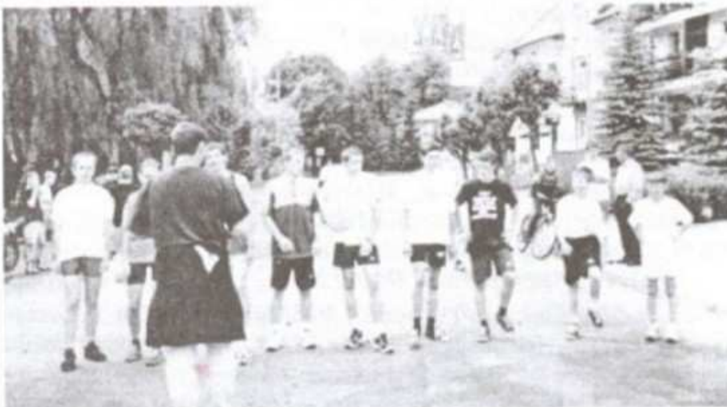
Start do biegu o puchar Burmistrza

W strugach deszczu rozpoczął się drugi dzień obchodów Dni Jedlicza. Jednak pogoda nie zepsuła dobrej zabawy. Wachlarz proponowanych imprez był bardzo szeroki, każdy mógł znaleźć coś dla siebie.