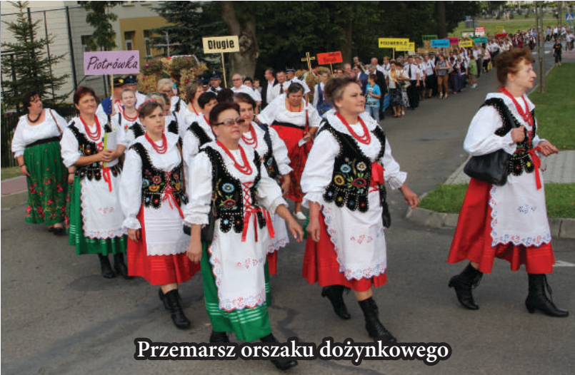
Przemarsz orszaku dożynkowego