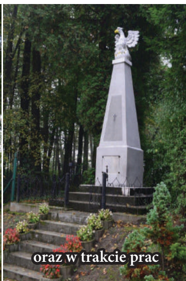
oraz w trakcie prac