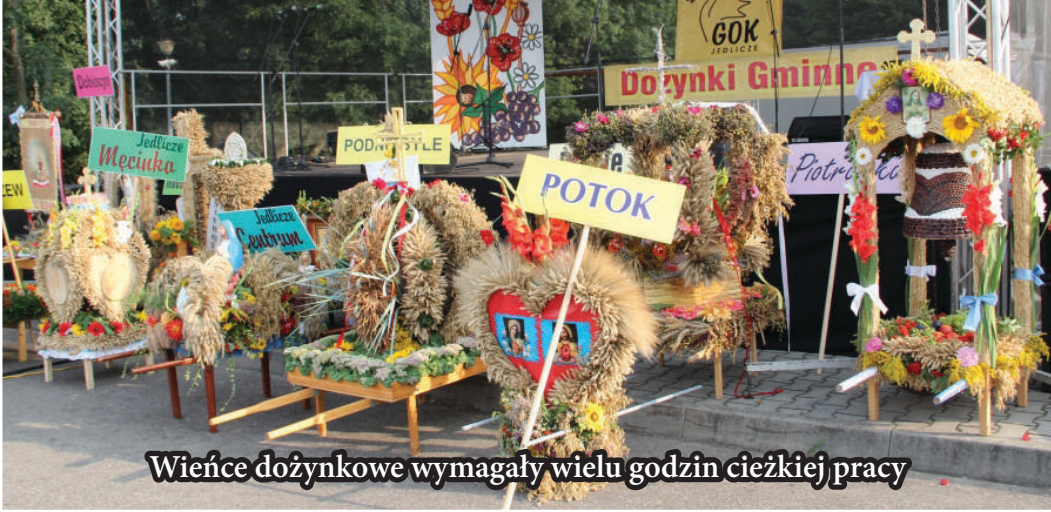
Wiance dożynkowe wymagały wielu godzin ciężkiej pracy