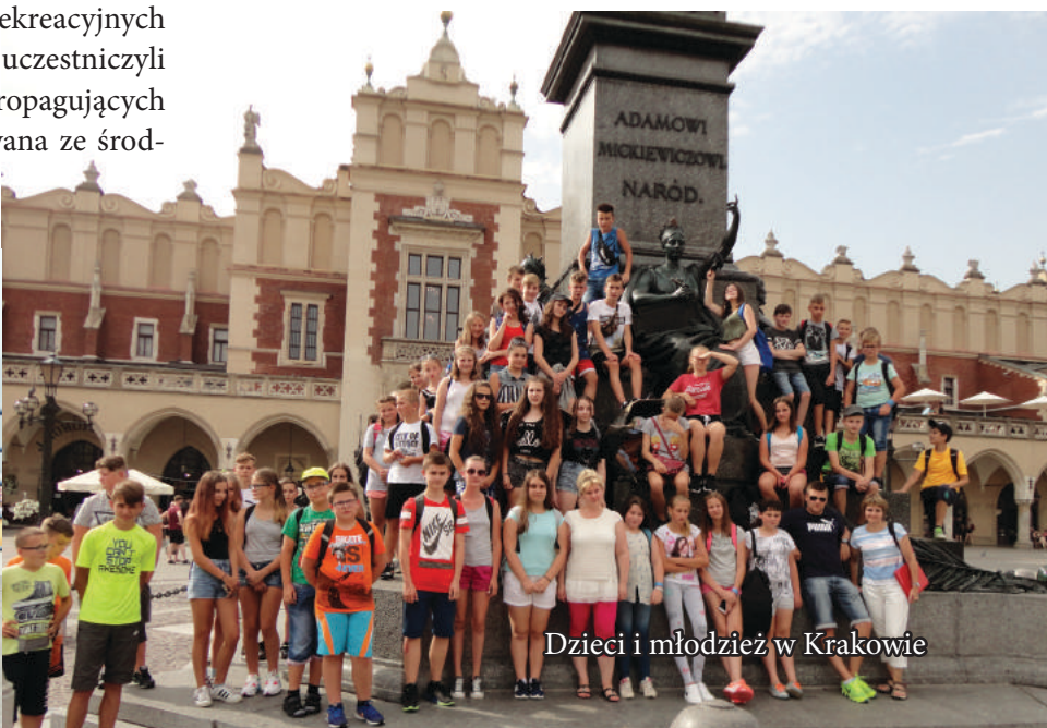
Dzieci i młodzież w Krakowie