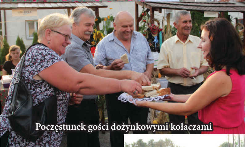
Poczęstunek gości dożynkowymi kołaczami