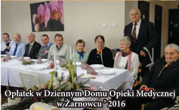
Opłatek w Dziennym Domu Opieki Medycznej w Żarnowcu 2016