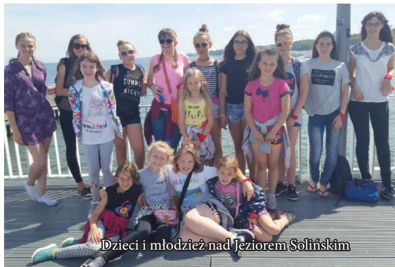
Dzieci i młodzież nad Jezioro Solińskim

Z kolei pobyt w Centrum Nauki Experiment był świetną okazją do zabawy przy interaktywnych stanowiskach. Niezapomnianym przeżyciem pozostanie spacer po promenadzie gwiazd, gdzie znani z wielkiego ekranu aktorzy zostawili swoje odciski dłoni. Oprócz zajęć rekreacyjnych oraz zawodów sportowych wychowankowie uczestniczyli w różnych programach profilaktycznych propagujących zdrowy styl życia. Kolonia została sfinansowana ze środków Gminy Jedlicze.