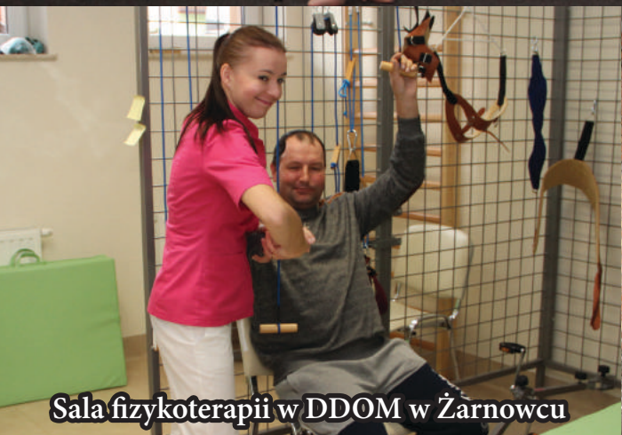
Sala fizykoterapii w DDOM w Żarnowcu