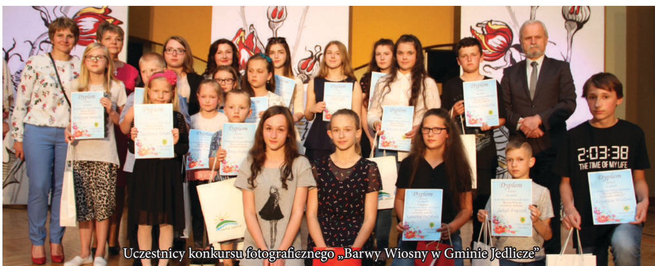
Uczestnicy konkursu fotograficznego „Barwy Wiosny w Gminie Jedlicze”