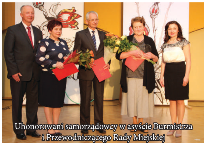
Uhonorowani samorządowcy w asyście Burmistrza i Przewodniczącej Rady Miejskiej

O oprawę artystyczną zadbali uczestnicy Gminnego