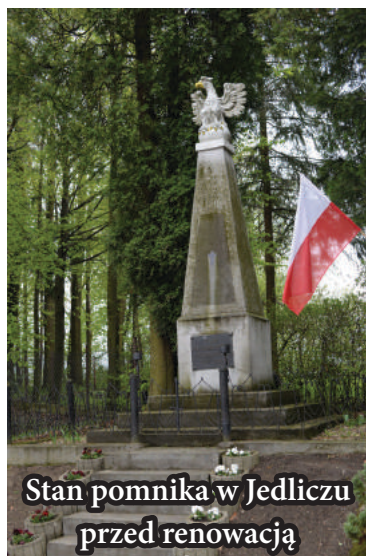
Stan pomnika w Jedliczu przed renowacją