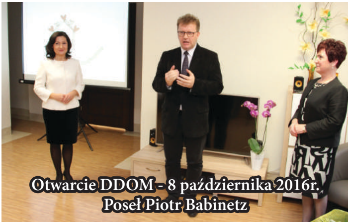
Otwarcie DDOM - 8 października 2016r. Poseł Piotr Babinetz