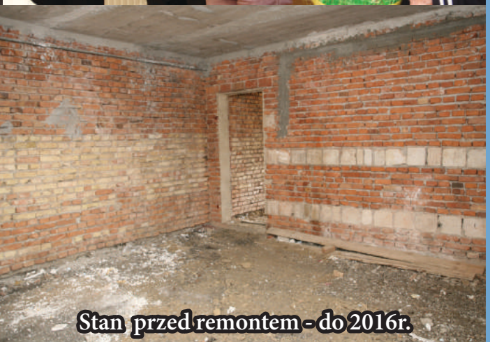
Stan przed remontem - do 2016r.