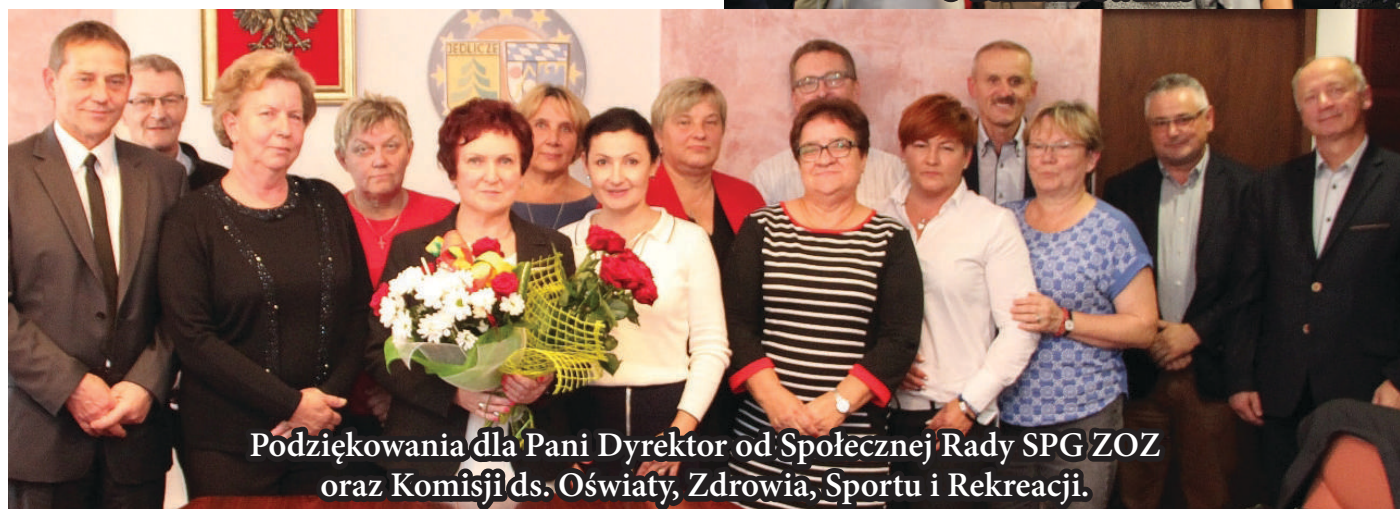
Podziękowania dla Pani Dyrektor od Społecznej Rady SPG ZOZ oraz Komisji ds. Oświaty, Zdrowia, Sportu i Rekreacji.