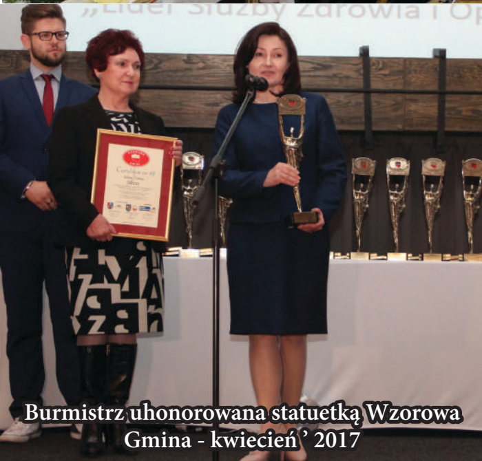
Burmistrz uhonorowana statuetką Wzorowa Gmina - kwiecień 2017