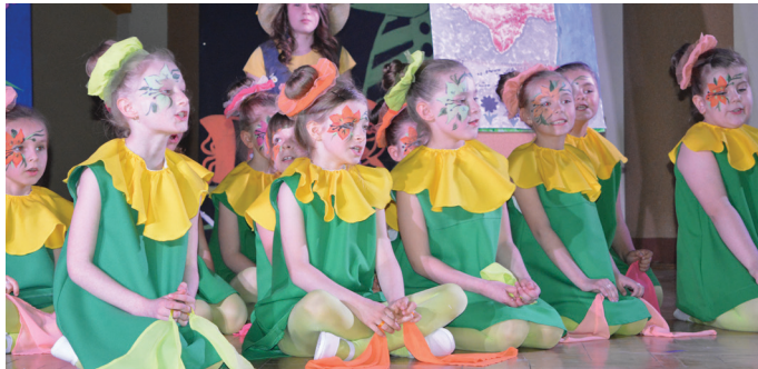
Zespół Szkół Publicznych w Jedliczu