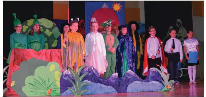
Szkoła Podstawowa w Dobieszynie