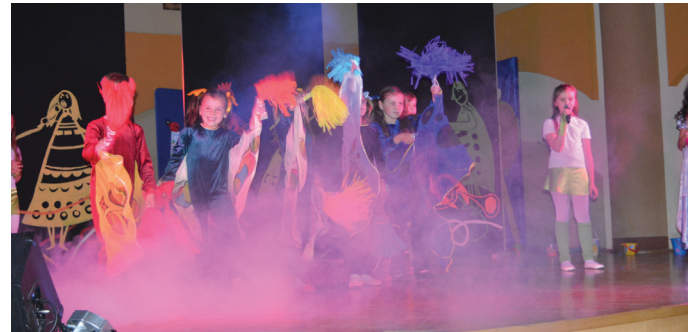
Zespół Szkolno – Przedszkolny w Żarnowcu