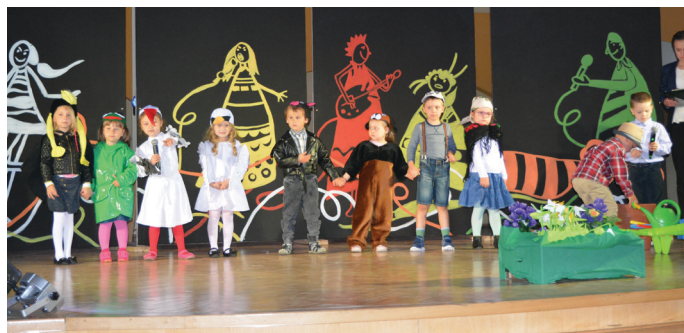
Punkt Przedszkolny „Kraina szczęścia” w Jaszczwi