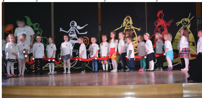
Przedszkole Niepubliczne im. Matki Anny Kaworek w Jedliczu