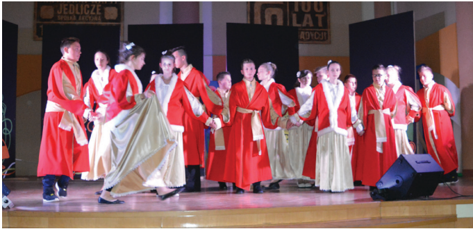
Zespół Szkół w Potoku