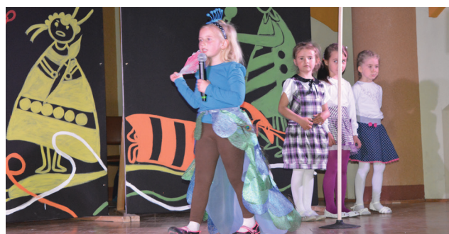
Oddział Przedszkolny przy Szkole Podstawowej w Dobieszynie