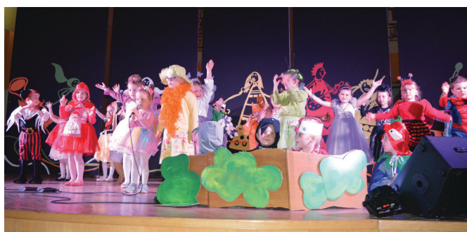
Samorządowe Przedszkole w Jaszczwi