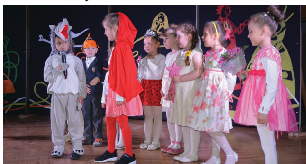
Oddział Przedszkolny przy Szkole Podstawowej w Żarnowcu