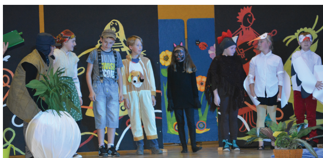
Zespół Szkół w Moderówce