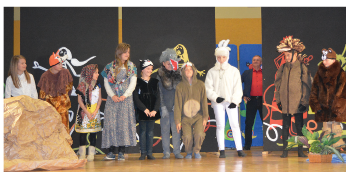
Szkoła Podstawowa w Piotrówce