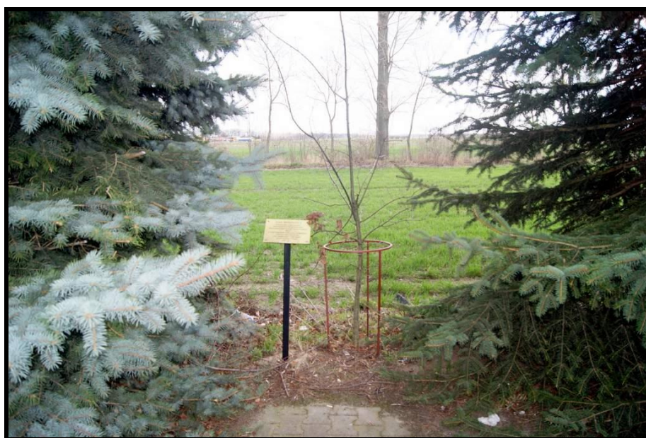
Dąb Wolności posadzony przez mieszkańców z inicjatywy Prezydenta RP Bronisława Komorowskiego