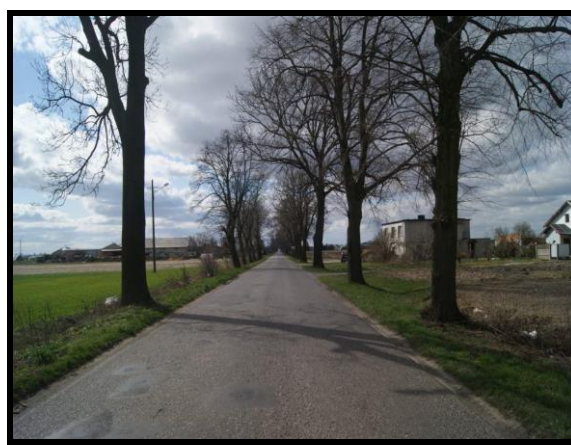
Aleja lipowa i kasztanowa