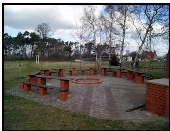
Miejsce rekreacji i sportu