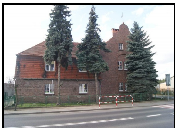
Zabytkowy budynek szkoły