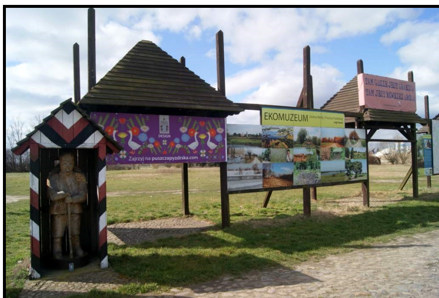
Rekonstrukcja - skansen, na byłym przejściu granicznym dzielącym Cesarstwa Rosyjskie i Niemieckie