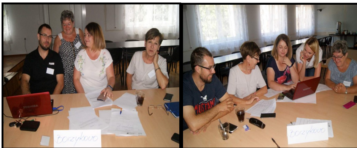
Grupa Odnowy Wsi w czasie warsztatów opracowania Sołeckiej Strategii Rozwoju. Sala Sesyjna Urzędu Gminy w Kołaczku w dniach 17-18.VII.2020r.

SOLECKA STRATEGIA ROZWOJU – BORZYKOWO wypracowana przez GOW na warsztatach w ramach programu UMWW - „Wielkopolska Odnowa Wsi 2013-2020”