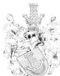
Bieganowscy h. Grzymała Kowalscy h. Korab