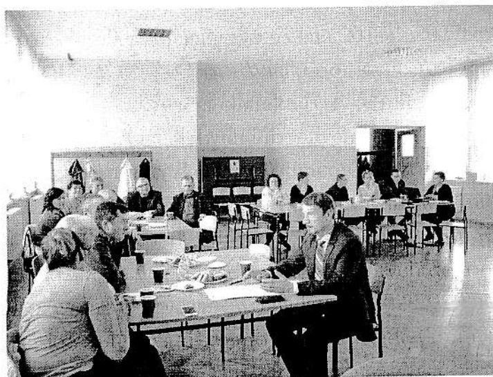
Praca na warsztatach

Sołecka Strategia Rozwoju Wsi Bieganowo na lata 2017 – 2027 spełnia wymagania, stawiane przez Marszałka Województwa Wielkopolskiego realizatora programu Wielkopolskiej Odnowy Wsi. Zawiera charakterystykę miejscowości, analizę jej zasobów wraz z oceną słabych i mocnych stron. Poprzez warsztaty przeprowadzone z udziałem mieszkańców, opracowana została wizja rozwoju miejscowości, plan długo i krótkoterminowy służący odnowie miejscowości. Zasadniczy wkład w powstanie i kształt niniejszego dokumentu wnieśli mieszkańcy Bieganowa, biorący udział w warsztatach podczas których dokonano ww. analizy. Sołecka Strategia Rozwoju Wsi Bieganowo na lata 2017 – 2027 podlega przyjęciu przez Zebranie Wiejskie Sołectwa Bieganowo oraz Radę Gminy Kołaczkowo.