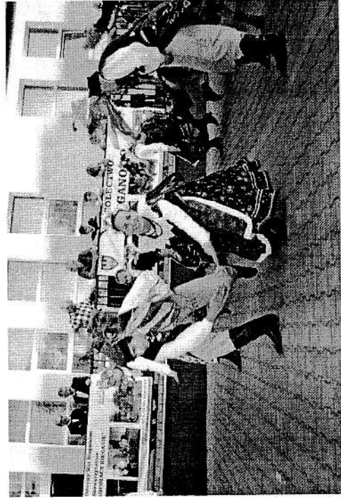
Zespół folklorystyczny Ziemia Wrzesińska