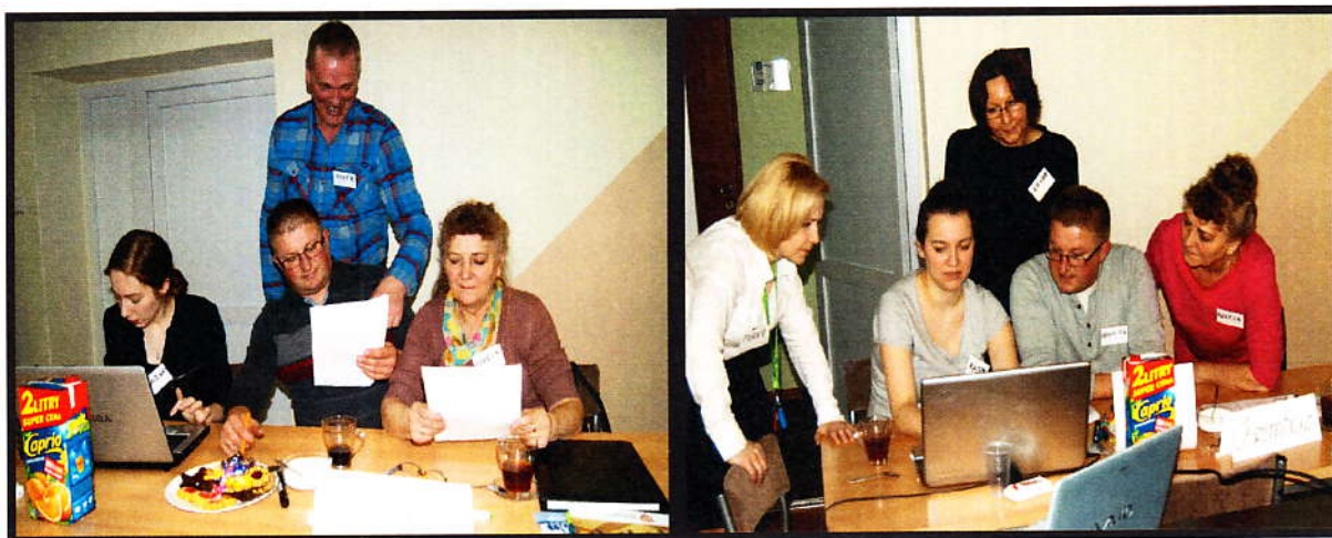
Grupa Odnowy Wsi w czasie warsztatów opracowania Sołeckiej Strategii Rozwoju. Urząd Gminy w Kołaczkowie 17-18.II.2017r.