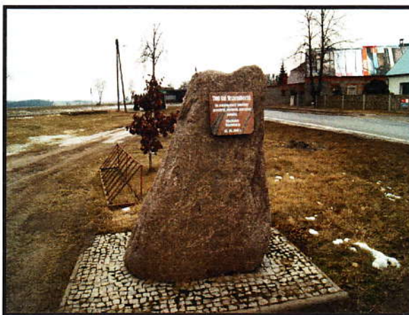
Kamień upamiętniający 700 Lecie Wszemborza 5.06.2010r