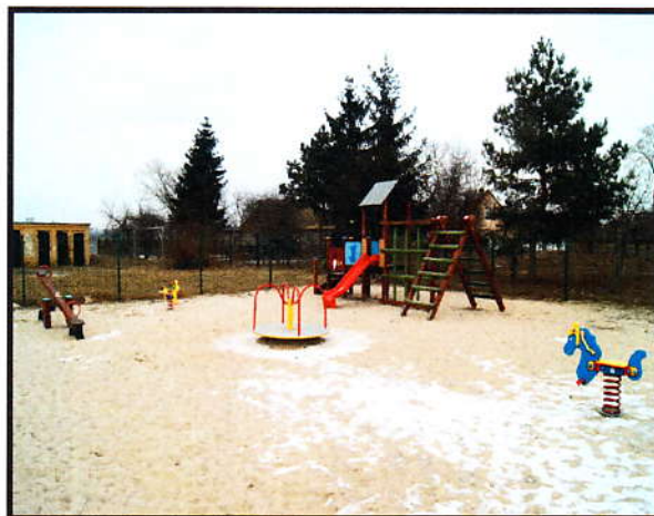
Plac zabaw dla najmłodszych