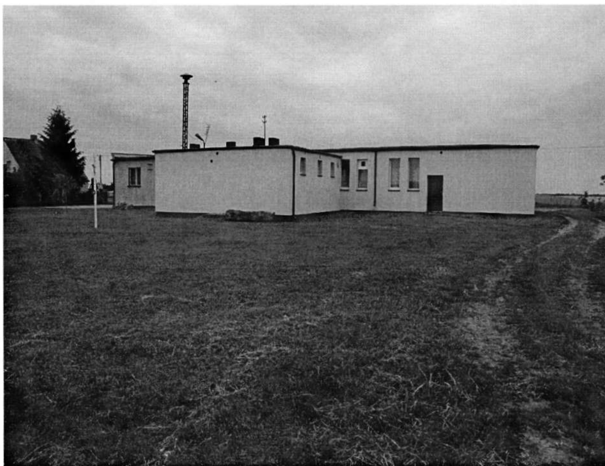
Budynek świetlicy i boisko

We Wsi funkcjonuje świetlica wiejska, a przy niej działa jednostka OSP.