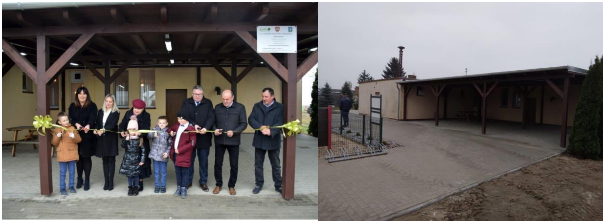
Dobudowa wiaty rekreacyjnej do budynku świetlicy wiejskiej w Gałęzewicach.