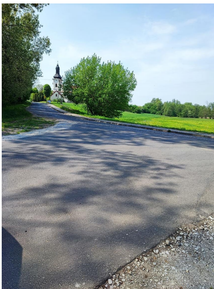
Budowa ulic w Sokolnikach ul. Pocztowa i ul. Szkolna