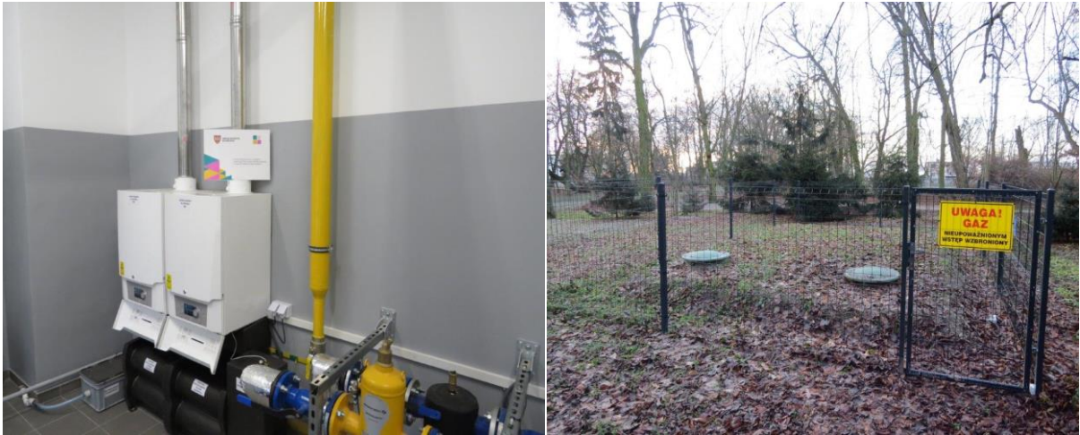
Przebudowa pomieszczenia kotłowni w budynku Gminnego Ośrodka Kultury wraz z budową instalacji gazowej oraz instalacji zbiornikowej na gaz płynny.