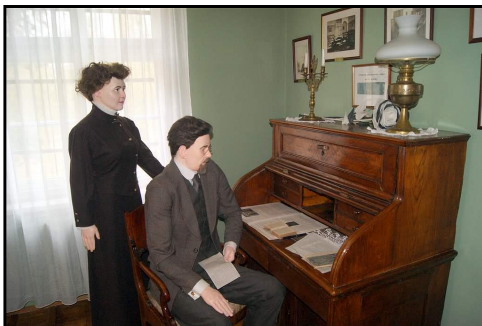
Izba pamięci Wł. St. Reymonta z cennymi eksponatami

SOŁECKA STRATEGIA ROZWOJU – KOŁACZKOWO wypracowana przez GOW na warsztatach w ramach programu UMWW - „Wielkopolska Odnowa Wsi 2013-2020”