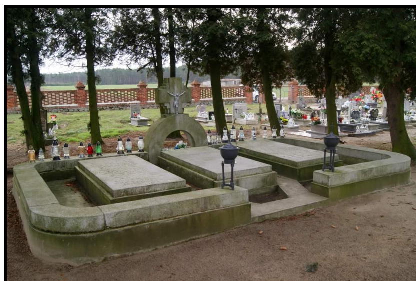
Żywa pamięć o lokalnych bohaterach