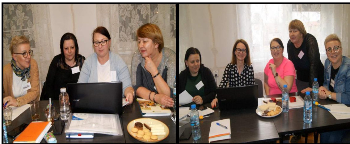
Grupa Odnowy Wsi w czasie warsztatów opracowania Sołeckiej Strategii Rozwoju. Sala Sesyjna Urzędu Gminy w Kołaczku w dniach 28-29.II.2020r.

SOLECKA STRATEGIA ROZWOJU – GORAZDOWO wypracowana przez GOW na warsztatach w ramach programu UMWW - „Wielkopolska Odnowa Wsi 2013-2020”