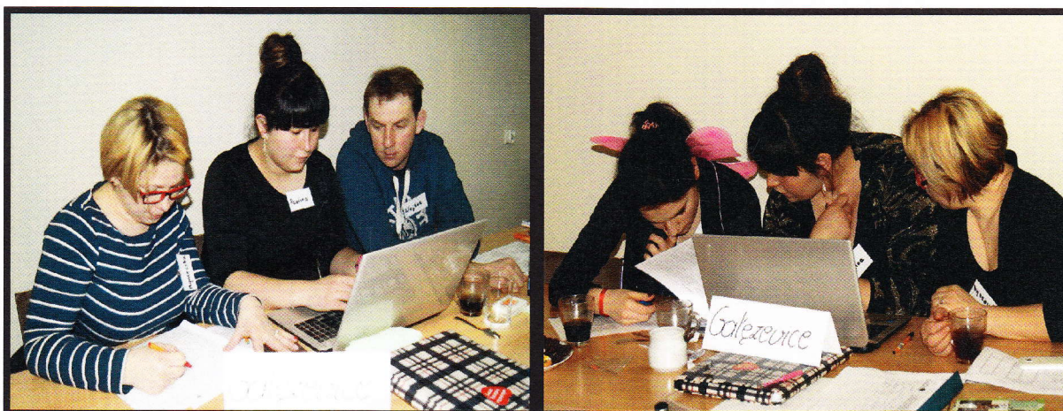
Grupa Odnowy Wsi w czasie warsztatów opracowania Sołeckiej Strategii Rozwoju. Urząd Gminy w Kołaczkowie 17-18.II.2017r.