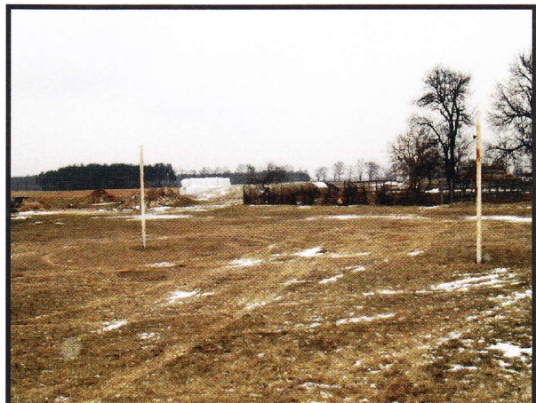
Boisko do siatkówki