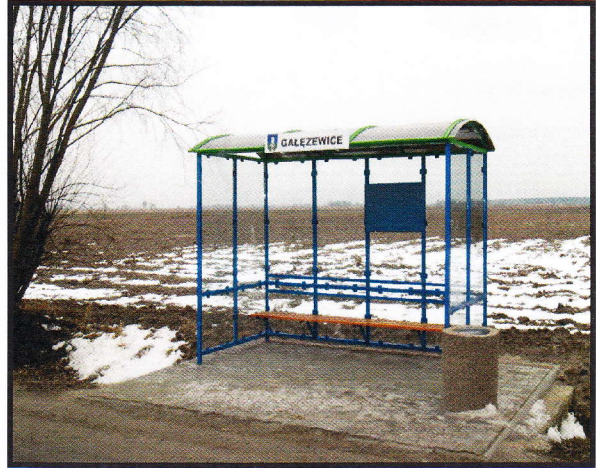
Przystanek szkolny i PKS