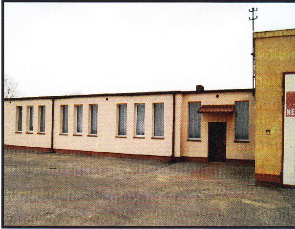
Budynek świetlicy wiejskiej, OSP